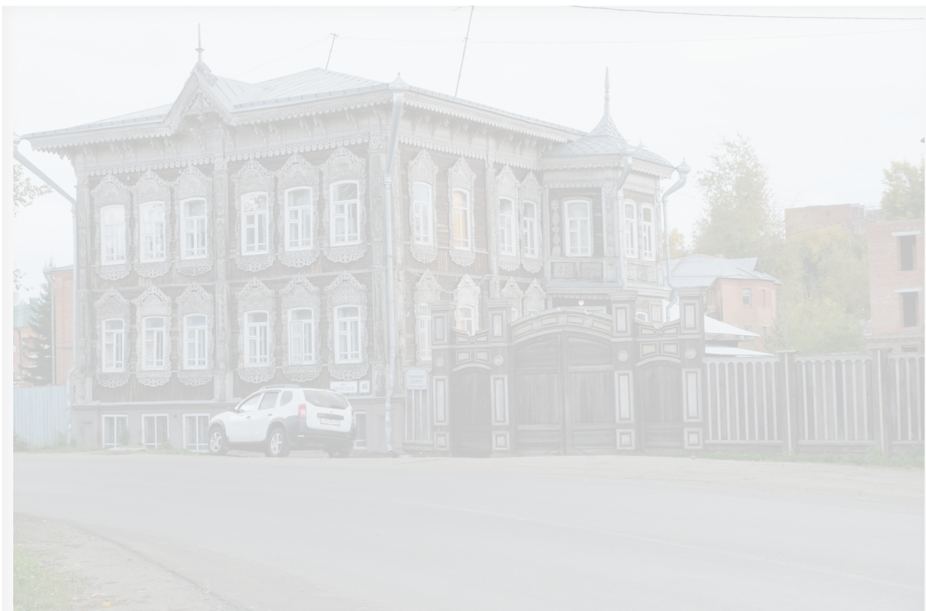
Автор: Алёна Штерн Фото из альбома "Томск. Татарская слобода" © Фотобанк "RuBabr"

В мае 2023 года стало известно, что «Квартал» намерен построить рядом с долгостроем на Источной, 41а четыре трёхэтажных многоквартирных дома . И всё бы ничего, но рядом располагается ещё и объект культурного наследия федерального значения – дом купца Ахметова (Татарская, 46). Здание было построено в 1902 году, а владел им купец Ахмедулла Москов.