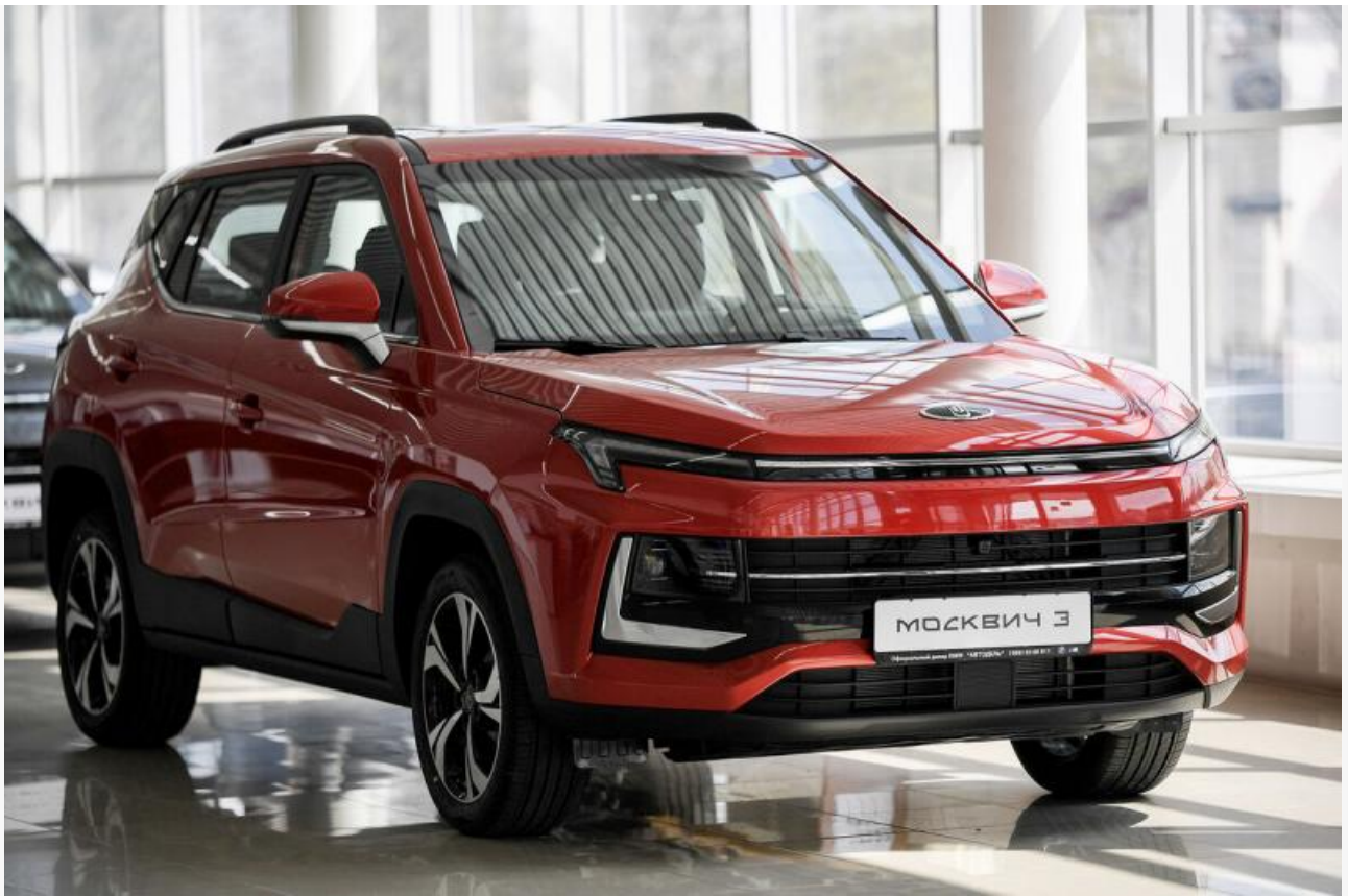
Так выглядит современный модельный ряд «Москвича»

И вот власти в Красноярском крае почувствовали, куда ветер дует, и разместили тендер на покупку четырёх автомобилей марки «Москвич Z» для нужд краевой администрации. Стоит заметить, что «Москвич» нынче не такое дешёвое удовольствие — во всяком случае для среднего класса точно. Один автомобиль стоит около 2,5 миллиона рублей. Четыре автомобиля предлагается приобрести за 9,98 миллиона рублей.