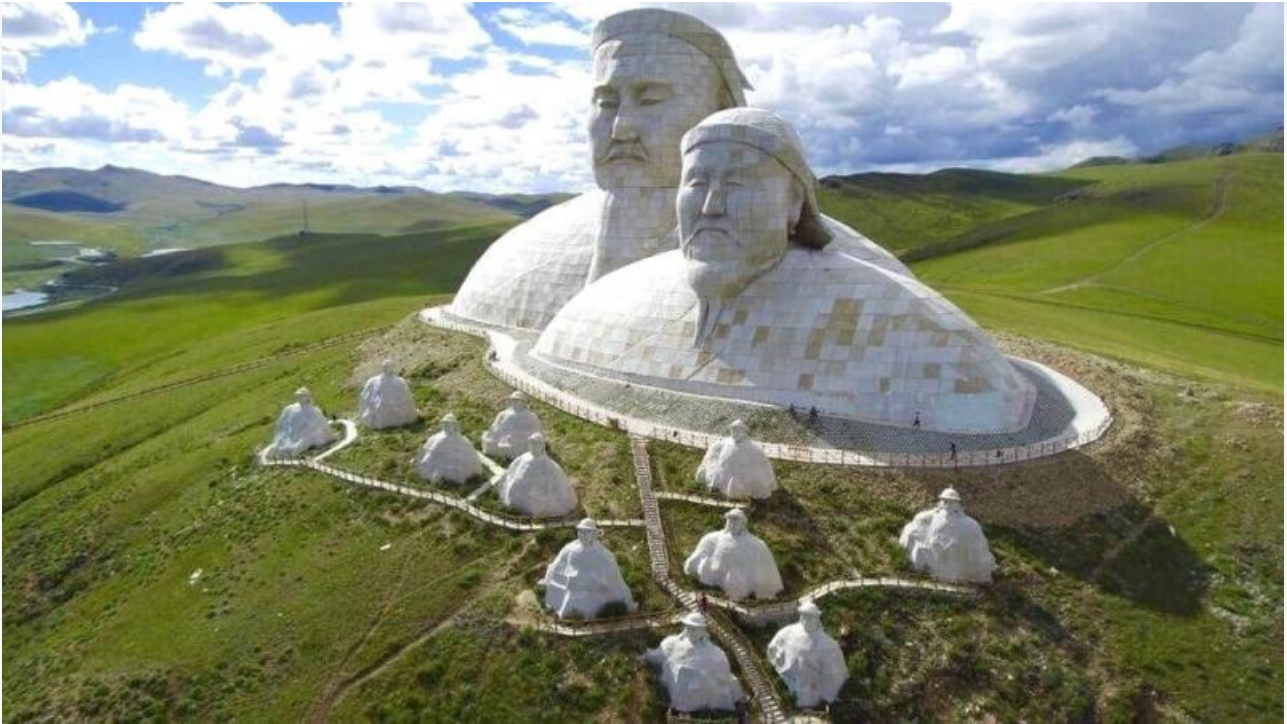
Памятник Чингисхану и его внуку Хубилаю во Внутренней Монголии

В начале XIII века великий монгольский вождь Чингисхан объединил множество монгольских племен и начал завоевания, которые привели к созданию огромной монгольской империи. Внутренняя Монголия стала частью этой империи и играла важную роль в истории монгольской культуры и власти.