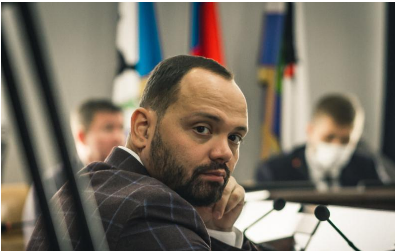
Фото: Ирсити, t.me/nov_irk

Автор: Лилия Войнич © Babr24.com ПОЛИТИКА, ИРКУТСК 👁 16555 06.09.2023, 11:37 📌 276