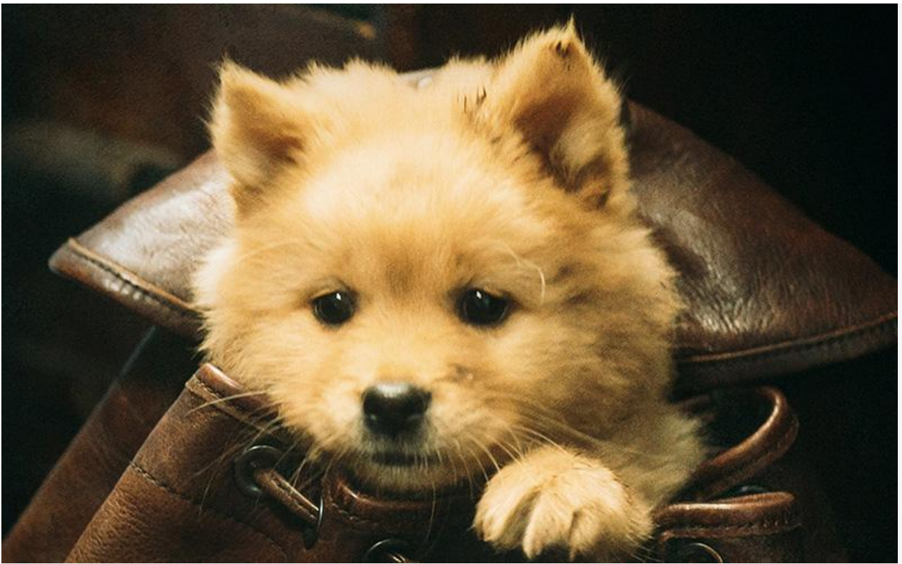
Постер к фильму «Мой Хатико»