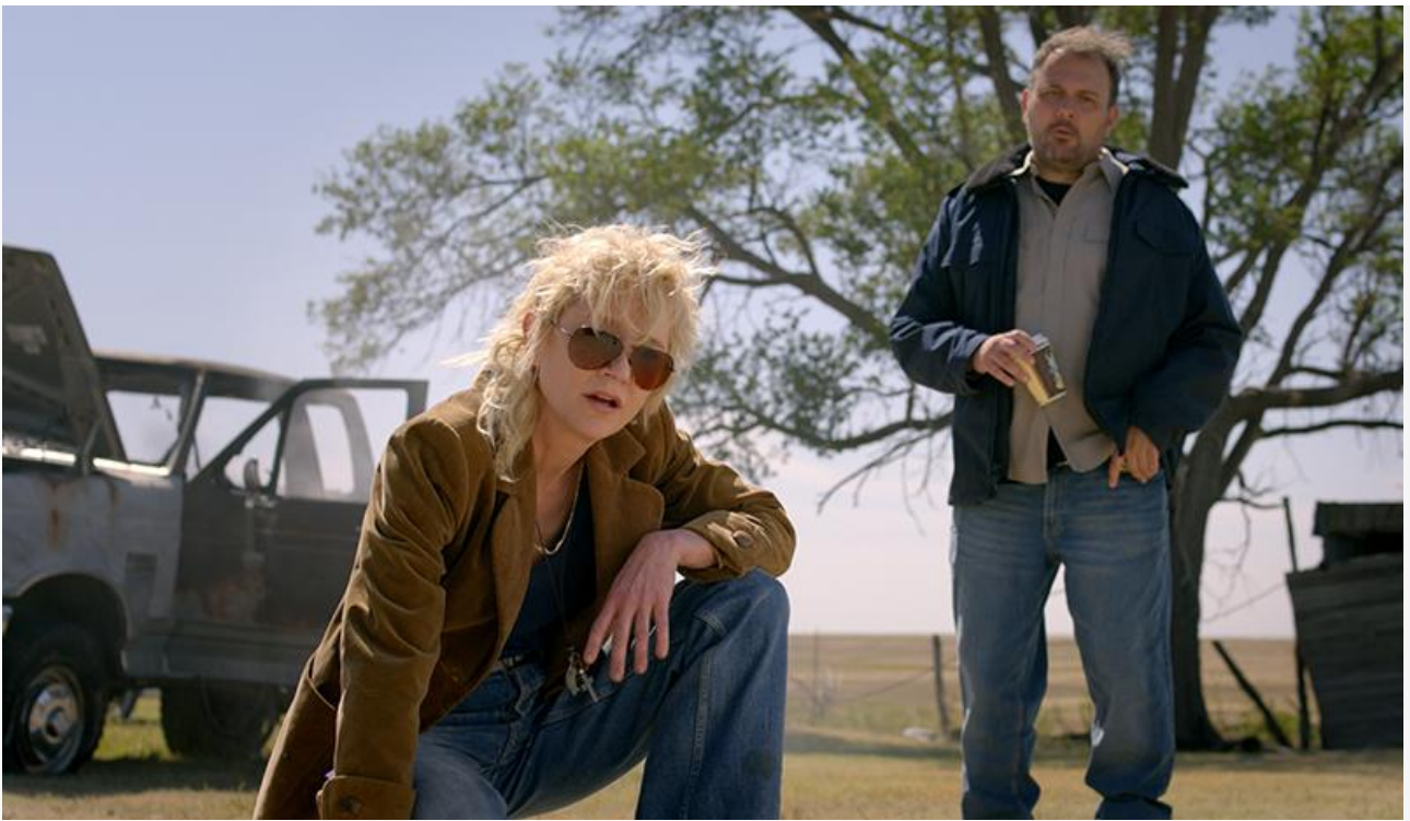
Кадр из фильма «Зов мести»