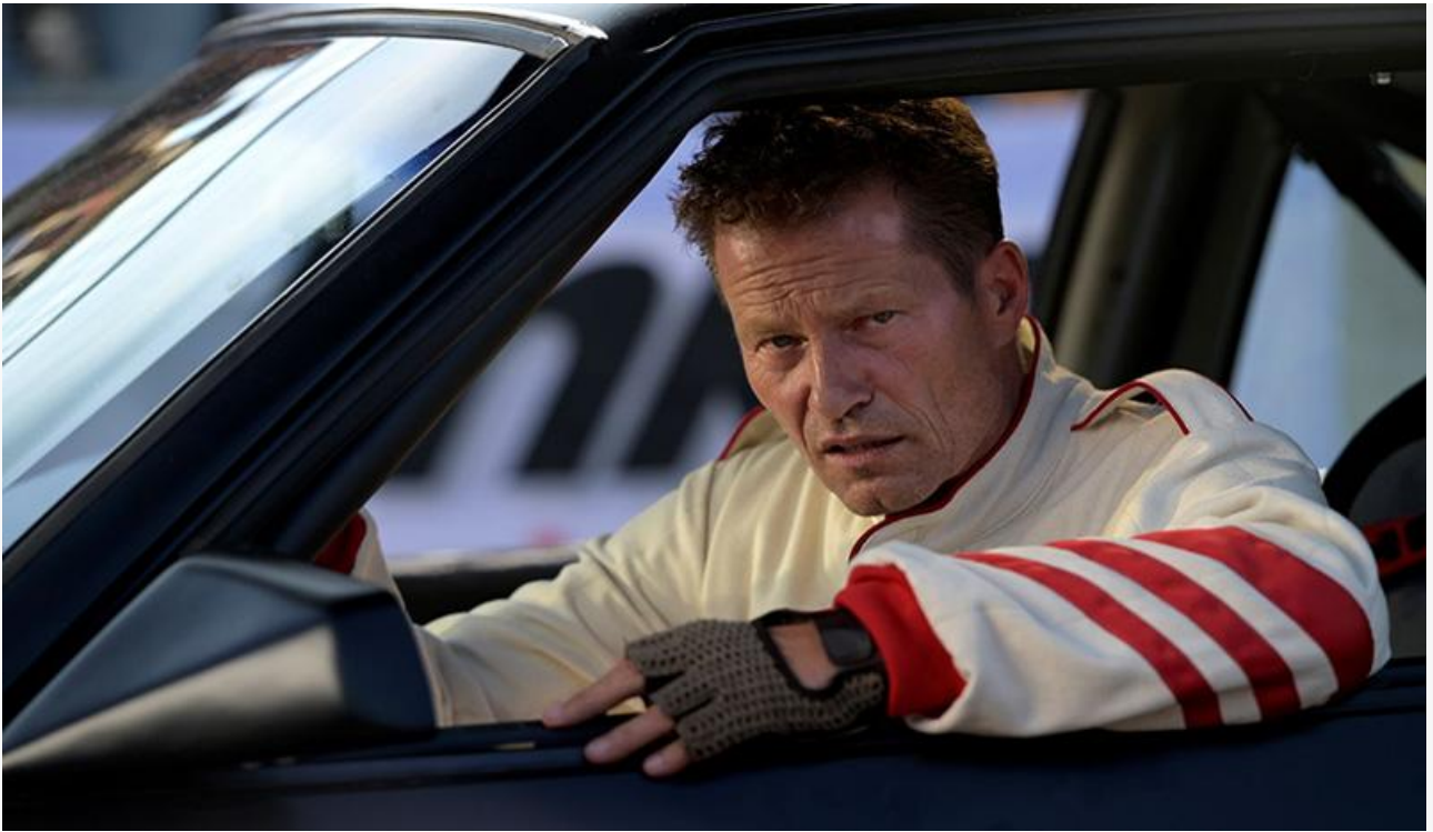
Кадр из фильма «Гонщики на драйве»