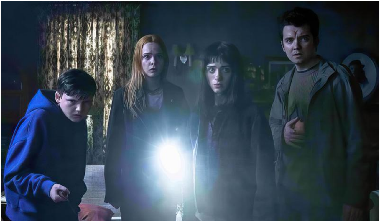
Кадр из фильма «Игра в прятки»