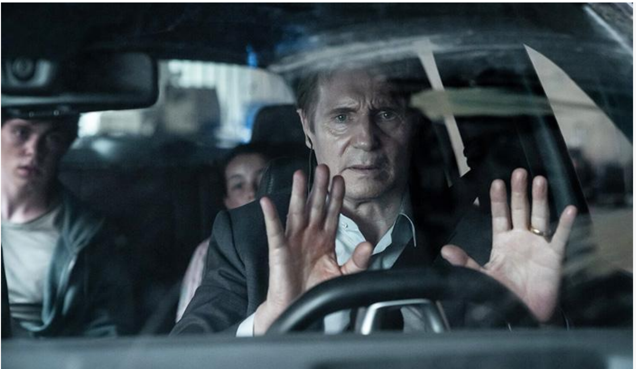
Кадр из фильма «Заложники»