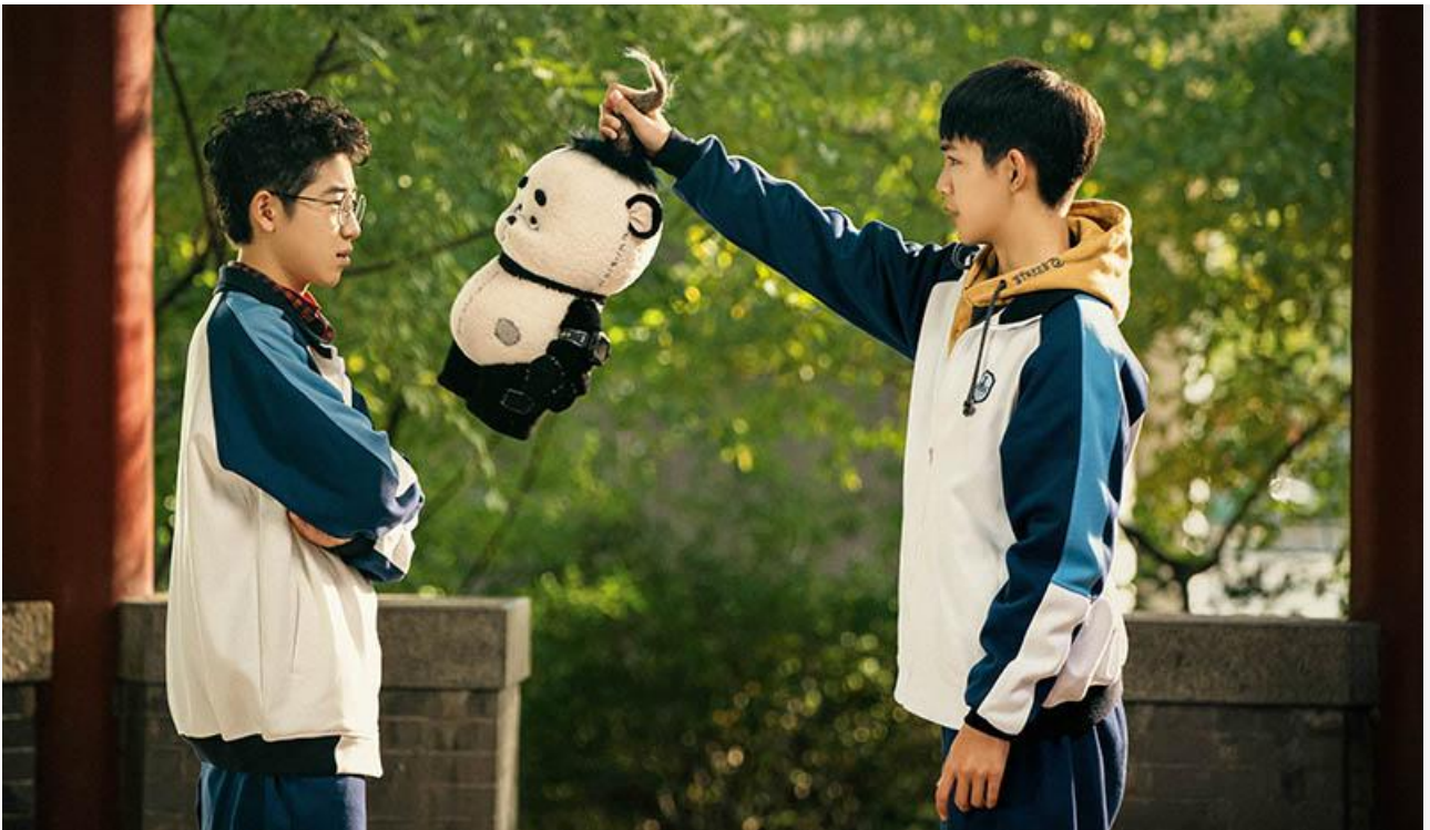
Кадр из фильма «Панда из космоса»

Впервые на большом экране российские зрители смогут посмотреть культовый японский триллер ужасов « Звонок » (18+), снятый Хидэо Накатой в 1998 году.