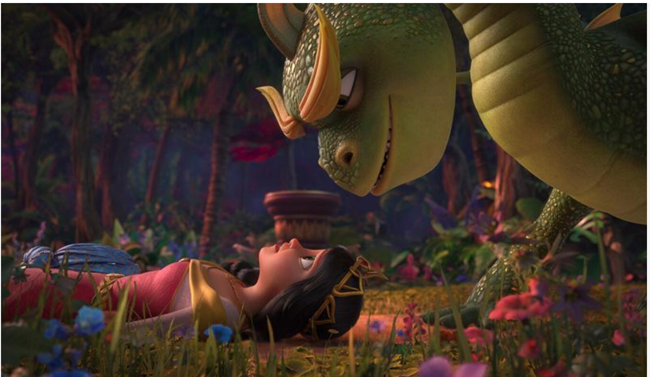
Кадр из фильма «Руслан и Людмила. Больше, чем сказка»

Из других премьер уикенда наилучшие результаты показали германский триллер Максимилиана Эрленвайна с Луизой Краузе и Софи Лоу « Подводный капкан », на 853 экранах собравший 17 миллионов и ставший седьмым, и хоррор Ребеки МакКендри « Игра в лифте », получивший 467 экранов и с суммой 10,2 миллиона замкнувший топ-10 проката.