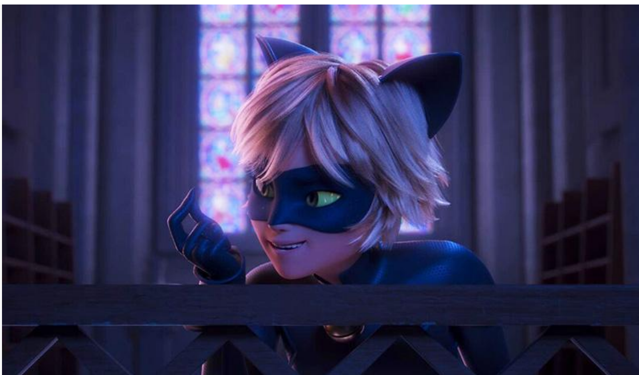
Кадр из фильма «Леди Баг и Супер-кот: Пробуждение силы»

Американский экшн-триллер Нимрода Антала « Заложники » с Лиамом Нисоном в главной роли получил в распоряжение 1 298 экранов и стартовал с суммы в 39,2 миллиона рублей. Всего на 1,5 миллиона меньше, правда, на 2 049 экранах, заработал российский мультфильм от студии «Воронеж» « Руслан и Людмила. Больше, чем сказка ». Как итог – третье место по итогам уикенда.