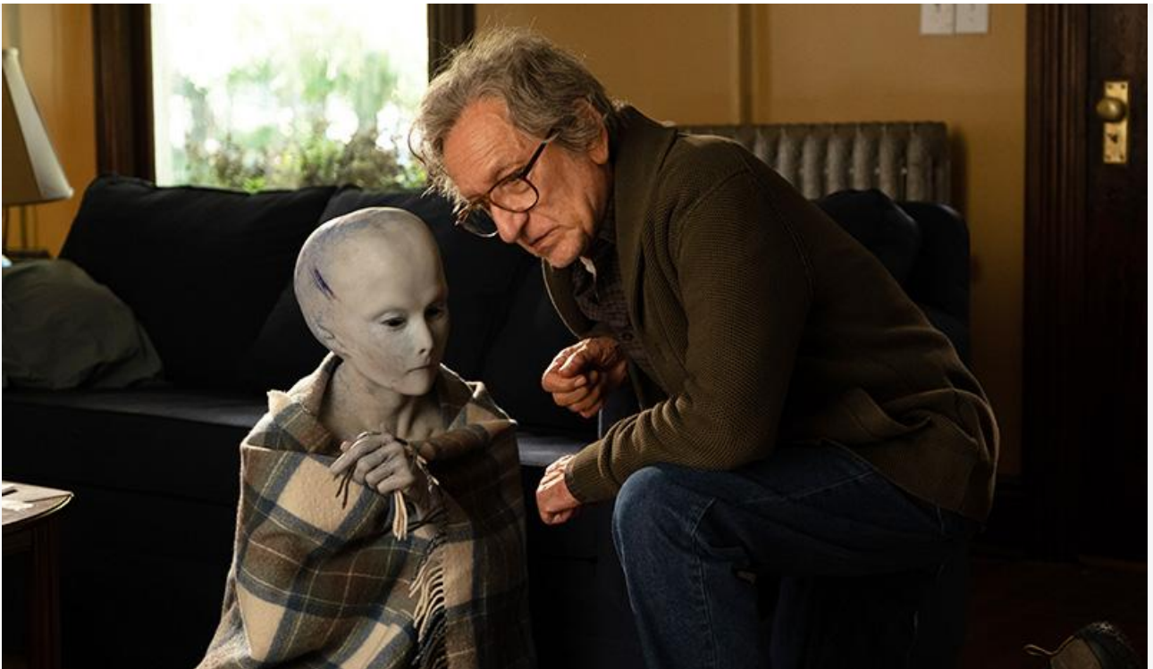
Кадр из фильма «Джулс»