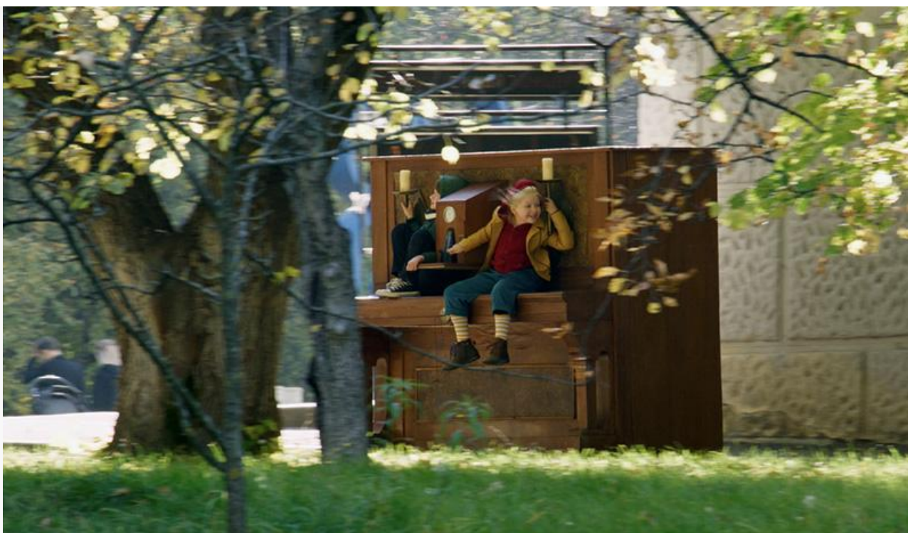
Кадр из фильма «Девочка Нина и похитители пианино»

Кроме «Чижика-Пыжика» на попадание в топ-10 претендуют китайская семейная драма Сюй Ан « Мой Хатико » и американско-канадский экшн-триллер Кевина Гревье « Охота на короля » (18+) с Фрэнком Грилло, Стивеном Дорффом и Аленом Мусси.