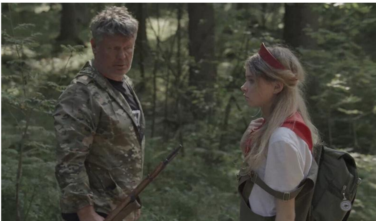
Кадр из фильма «Квест»

В общем, если вы прочитаете наш анонс недельной давности , то поймёте, что уикенд прошёл без сюрпризов.