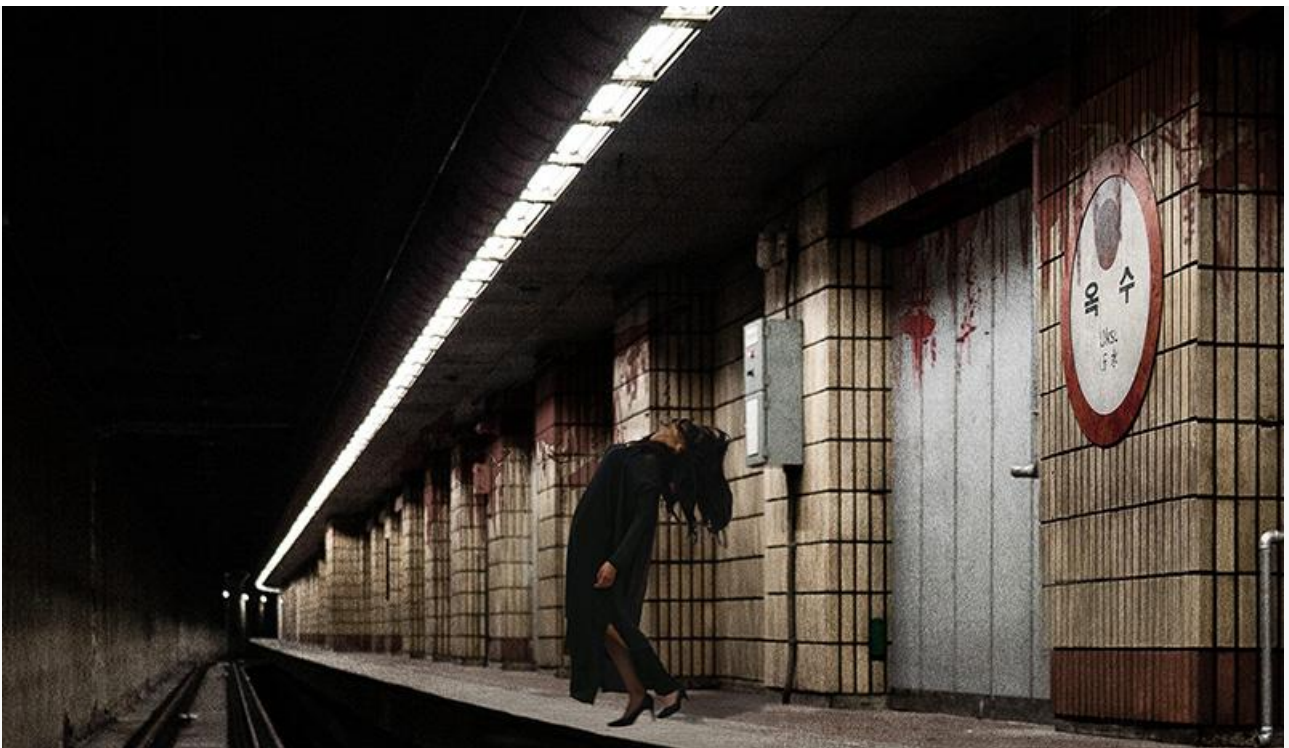
Постер к фильму «Призрачная станция»

Также выходят на экраны немецкий комедийный боевик Тила Швайгера с ним же в главной роли «Гонщики на драйве» , американская фантастическая драмеда Марка Тёрлтауба «Джулс» , американский детективный триллер Нэйтана Скоггинса «Зов мести» (18+) с Энн Хеч, Келланом Латсом и Крессом Уильямсом, датский криминальный триллер «Молчание ангелов» (18+), французская комедийная мелодрама Тибо Сегуэна «Романтик» (18+) и китайская семейная фантастическая комедия Чэнь Сычэна «Панда из космоса» .