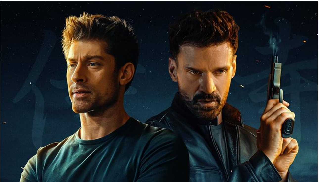
Постер к фильму «Охота на короля»