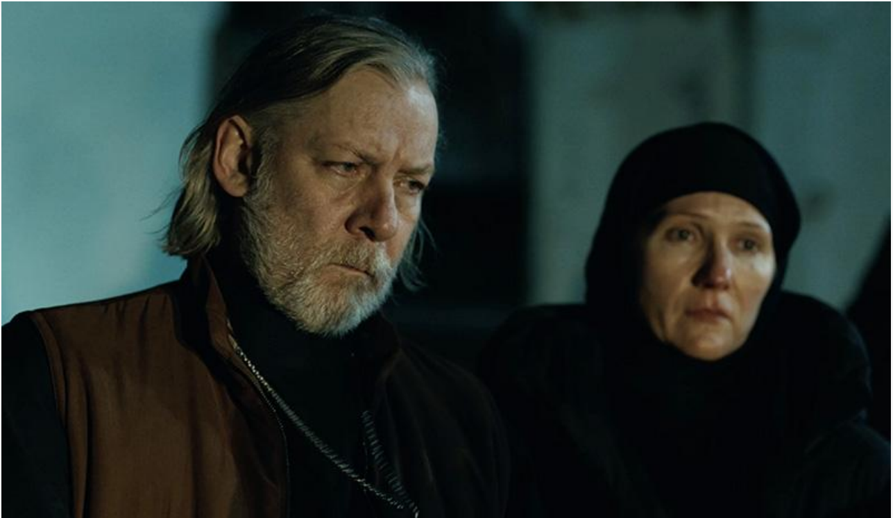
Кадр из фильма «Свидетель»

Средняя посещаемость фильма в кинотеатрах за полторы недели проката составила пять человек за сеанс. Если скорость падения сборов не замедлится (а предпосылок для внезапного прогресса у неё нет), то уже через неделю «Свидетеля» можно смело снимать с проката.