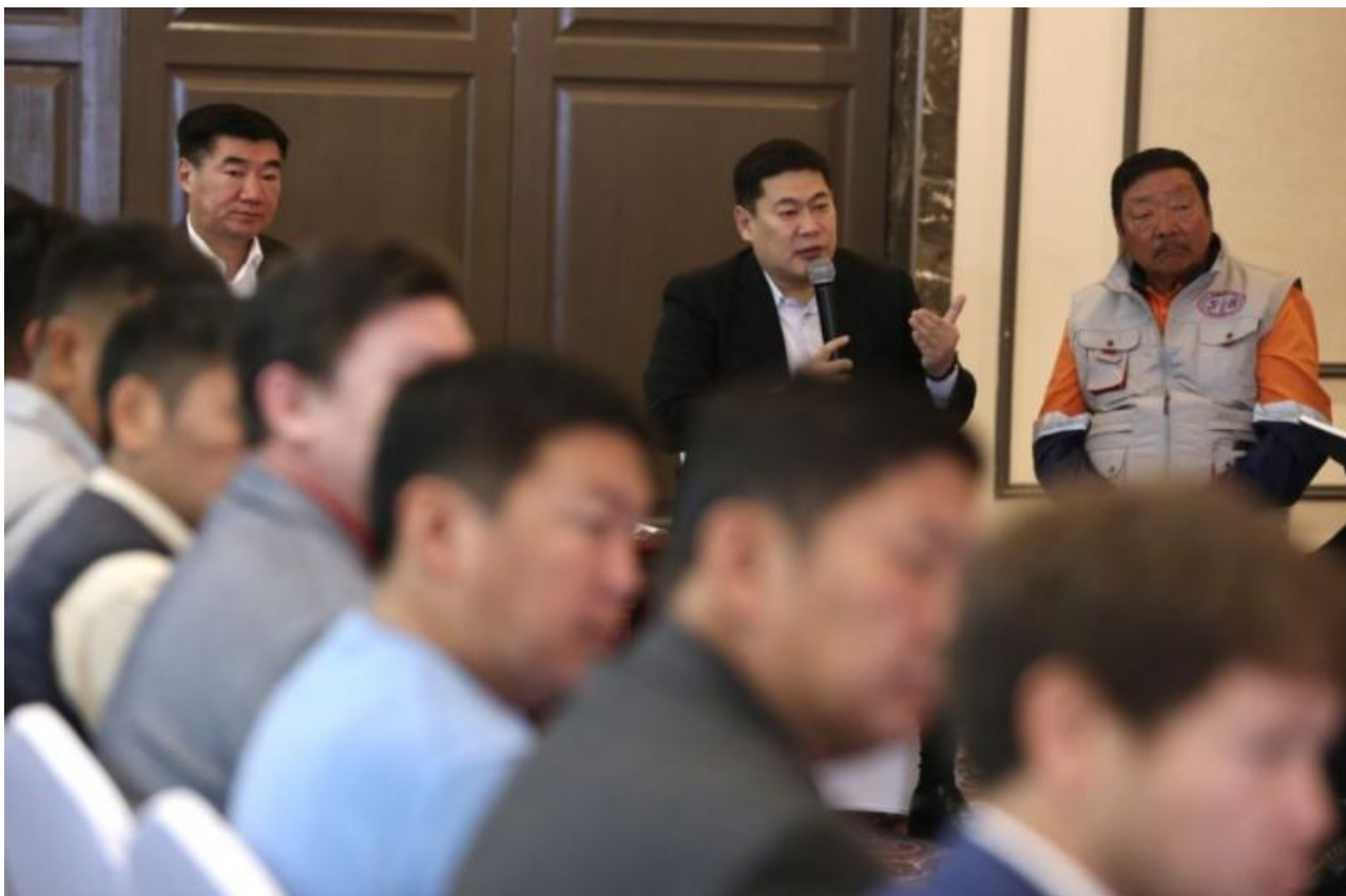
Фото: пресс-служба правительства Монголии

Автор: Денис Большаков © Babr24.com ПОЛИТИКА, ТРАНСПОРТ, ЭКОНОМИКА И БИЗНЕС, МОНГОЛИЯ 11234 31.08.2023, 19:11 237