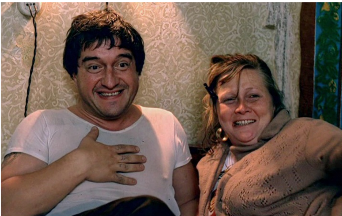
обетованные», 1991 год