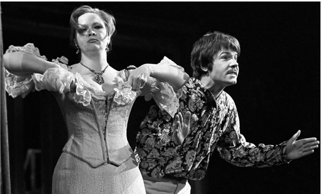
Липочка в спектакле

Летом 2001 года ведущая актриса театра была вынуждена оставить сцену по состоянию здоровья. В начале сентября этого же года ушёл из жизни и Андрей Гончаров.