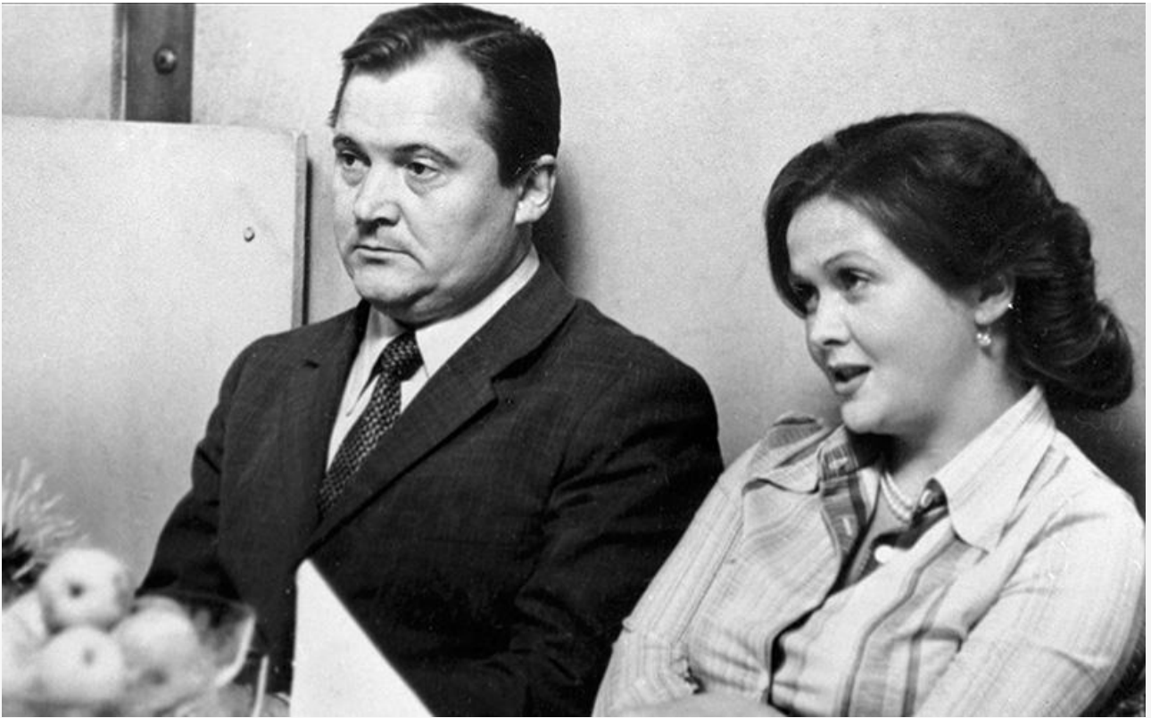
С Виктором Павловым в фильме «Уходя — уходи», 1978 год

После окончания Щукинского училища в 1971 году 22-летняя звезда курса Юрия Катина-Ярцева получила приглашения сразу в четыре знаковых театра столицы: МХАТ, «Современник», имени Вахтангова и имени Маяковского, из которых выбрала последний. Вся театральная карьера Натальи Гундаревой была неразрывно связана с Московским драматическим театром имени Маяковского и его главным режиссёром и художественным руководителем Андреем Гончаровым.