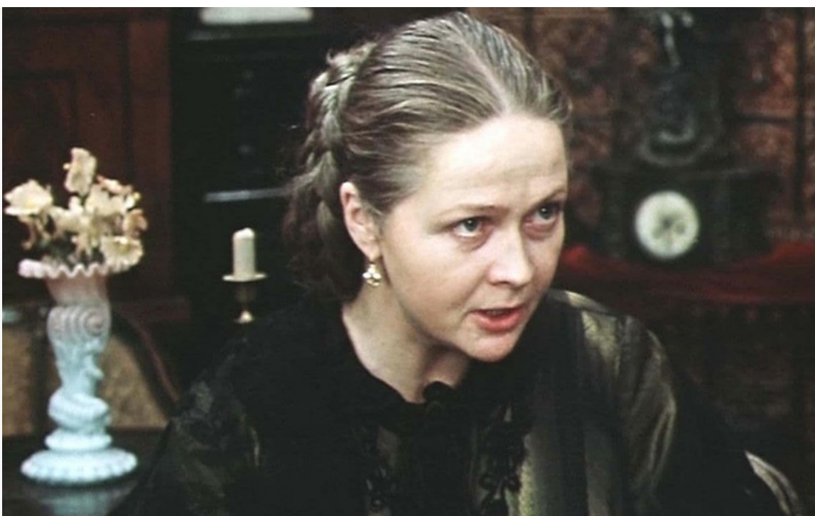
«Подросток», 1983 год