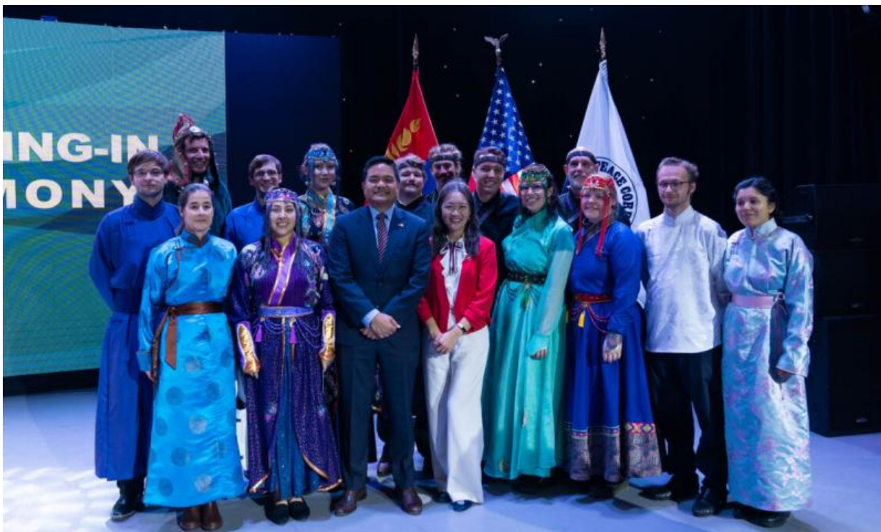
Фото: пресс-служба посольства США в Монголии

Автор: Денис Большаков © Babr24.com ПОЛИТИКА, ОБЩЕСТВО, МОНГОЛИЯ 👁 12868 19.08.2023, 08:33 👍 293