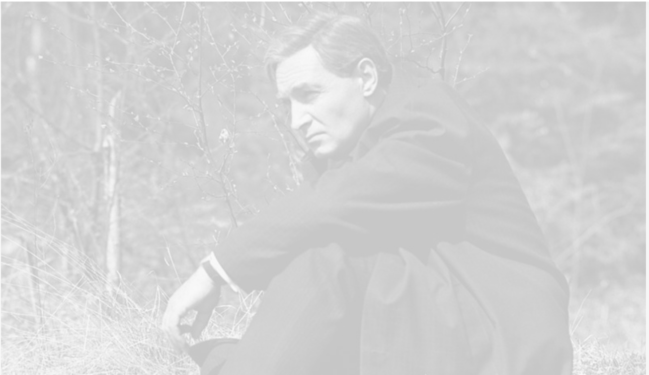
Макс Отто фон Штирлиц, он же Максим Исаев – Вячеслав Тихонов

К юбилею выхода на экраны культового сериала, во время показа которого пустели улицы страны, мы вспомнили знаменитые и остроумные фразы некоторых персонажей, актёров, которые их произнесли, и сцены из фильма с их участием.