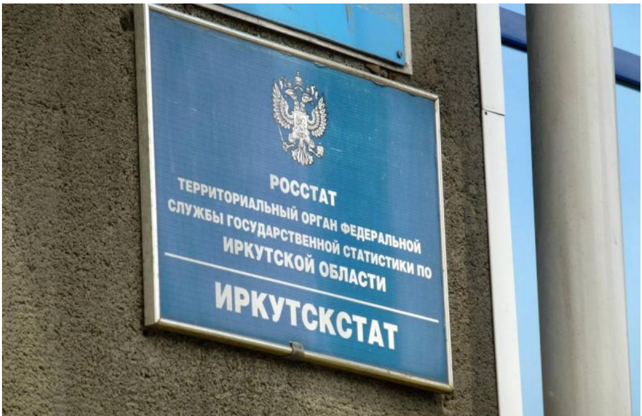
Фото с сайта Иркутскстата

Автор: Алина Саратова © Babr24.com ЭКОНОМИКА И БИЗНЕС, ИРКУТСК 👁 8369 15.08.2023, 19:36 📌 203