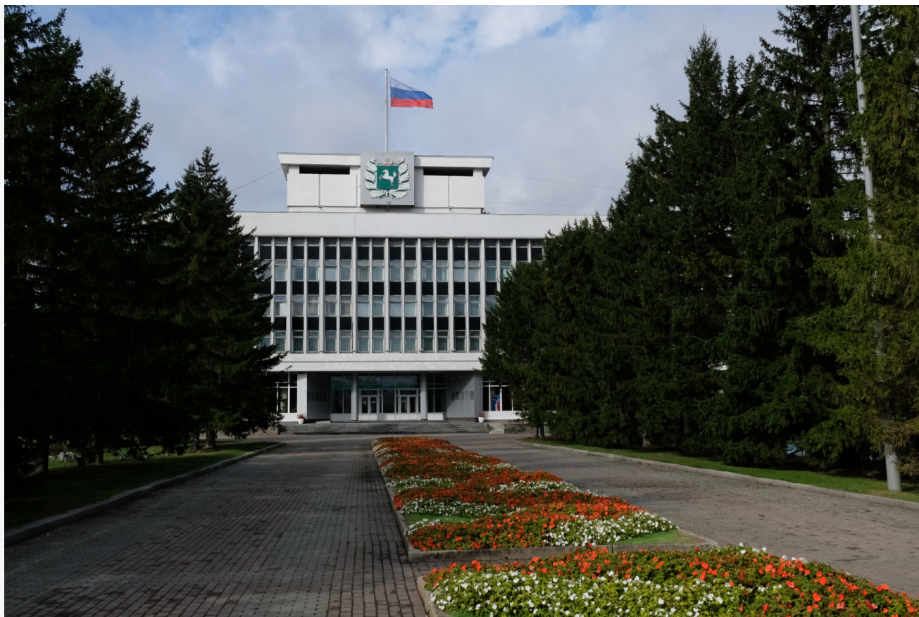
Автор: Алёна Штерн Фото из альбома "Томск. Правительство и Законодательная Дума" © Фотобанк "RuBabr"

В октябре 2022 года Законодательная дума Томской области приняла региональный закон о замене в Томске прямых выборов мэра на конкурсную процедуру. Теперь выбирать главу города будут не томичи, а особая комиссия, состоящая из 14 человек: семь – от думы Томска, семь – от губернатора Томской области.