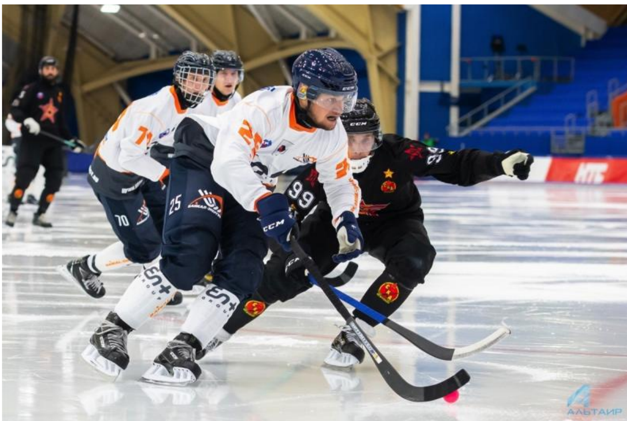
Фото с сайта ХК «Байкал-Энергия»

Автор: Ярослава Грин © Babr24.com СПОРТ, СКАНДАЛЫ, РАССЛЕДОВАНИЯ, ИРКУТСК 👁 54902 08.08.2023, 15:13 📄 338