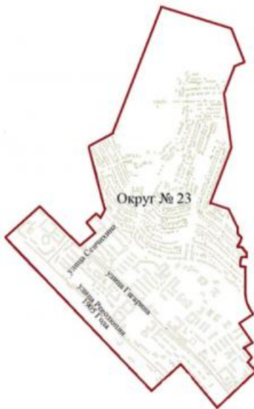
Графическое изображение схемы одномандатного избирательного округа № 23 для проведения выборов депутатов Народного Хурала Республики Бурятия (центр одномандатного избирательного округа – г. Улан-Удэ, здание администрации Железнодорожного района муниципального образования «Город Улан-Удэ», ул. Октябрьская, д. 2)

Предвыборная кампания «Единой России» в округе № 23 могла стать не такой легкой, как рассчитывалось. В списке кандидатов появился известный в республике оппозиционер, более опасный для «партии власти», чем те же коммунисты. Но первый блин вышел комом.