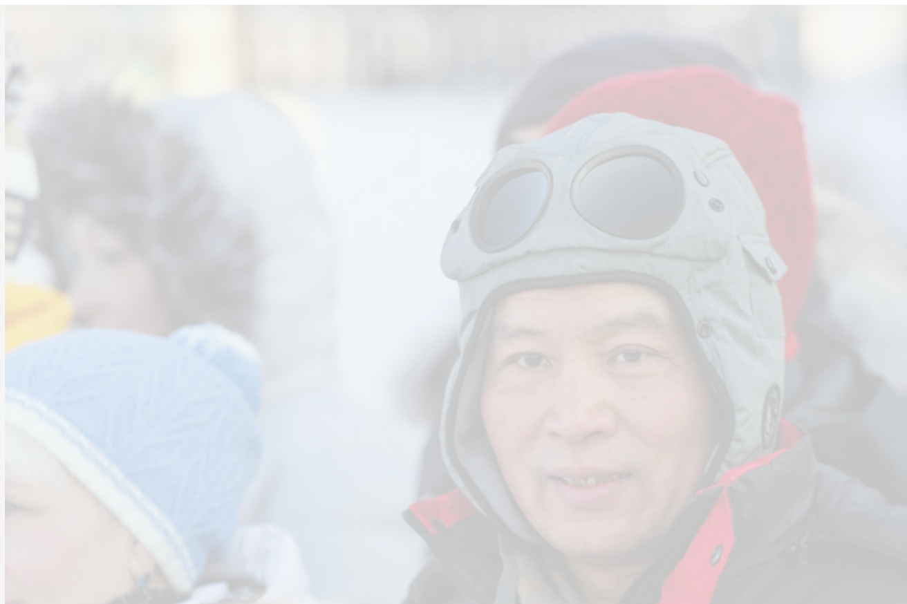
Автор: Кирилл Шипицин Фото из альбома "Байкал - китайские туристы" © Фотобанк "RuBabr"

Местные жители же в большинстве своём пребывают в состоянии неопределённости: с одной стороны, им хочется нормальных очистных сооружений, селезащиты и дорог, по которым можно ездить без вреда для здоровья (и физического, и душевного) и подвески, с другой – ожидаемый наплыв туристов и сплошная рубка леса людей пугают.