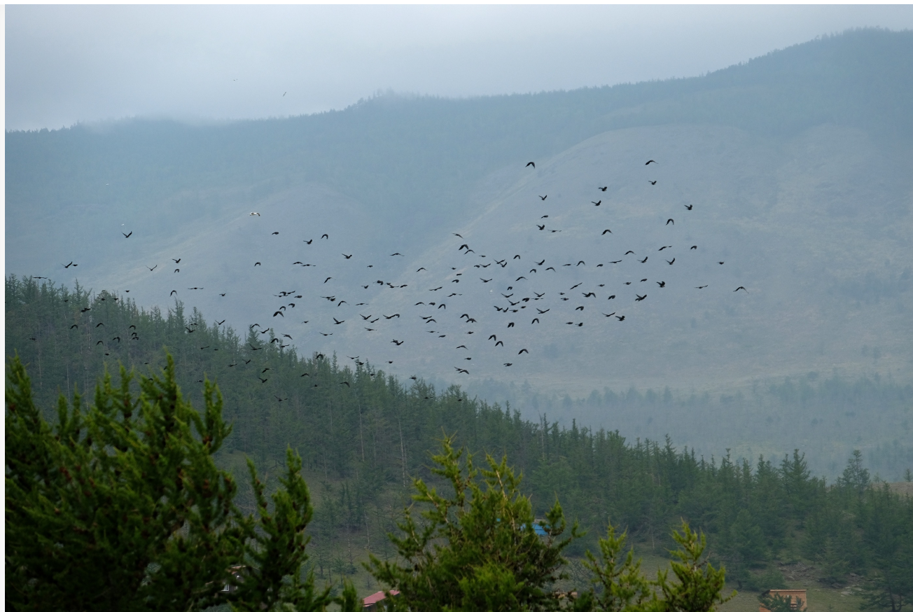
Автор: Алёна Штерн Фото из альбома "Малое море. Виды. Лето" © Фотобанк "RuBabr"

Итак, избавиться от леса можно для строительства, реконструкции и эксплуатации селезащитных и иных гидротехнических сооружений на реках Большая Осиновка, Малая Осиновка, Солзан, Харлахта, Слюдянка, Похабиха, Утулик и Безымянная. Второй пункт разрешает сплошные рубки при строительстве, реконструкции и эксплуатации коммунальной инфраструктуры в населённых пунктах, сведения о которых внесены в ЕГРН. Вырубить лес можно будет и для обеспечения функционирования особой экономической зоны «Ворота Байкала», включая обслуживание канатной дороги, строительство гостиниц, туалетов и кафе/ресторанов. В ОЭЗ представлен список участков, где для этих целей разрешены сплошные рубки. По словам члена комитета Госдумы по экологии Ольги Михайловой, речь идет о территории в 600 га.