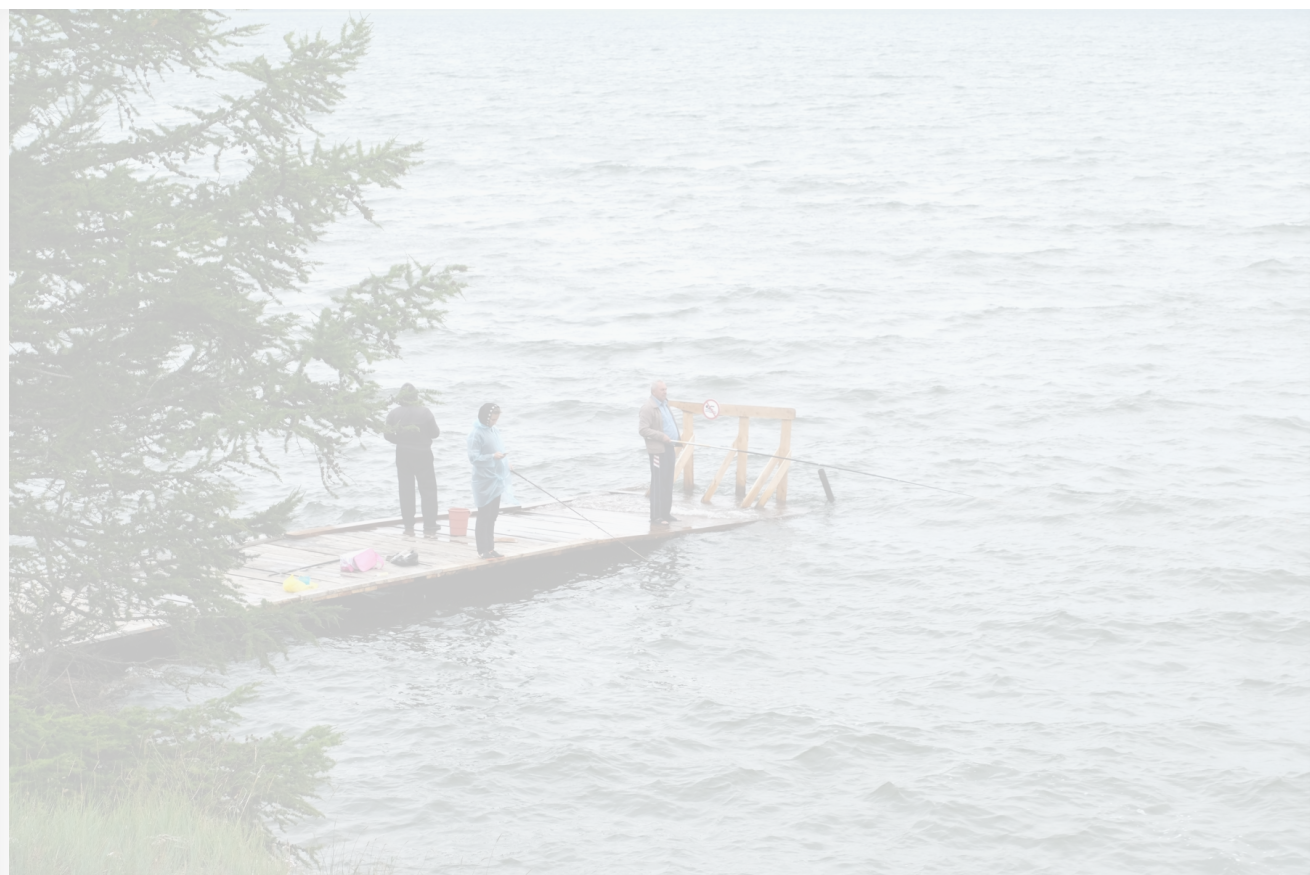
Автор: Алёна Штерн Фото из альбома "Байкал. Рыбаки" © Фотобанк "RuVabr"

И тут становится совершенно понятно, что первостепенный интерес в принятии законопроекта заключается в увеличении турпотока на Байкал, а качество жизни местных второстепенно. Не сказать, что такое положение вещей слишком удивляет в эпоху правления нуворишей. Но точно огорчает.