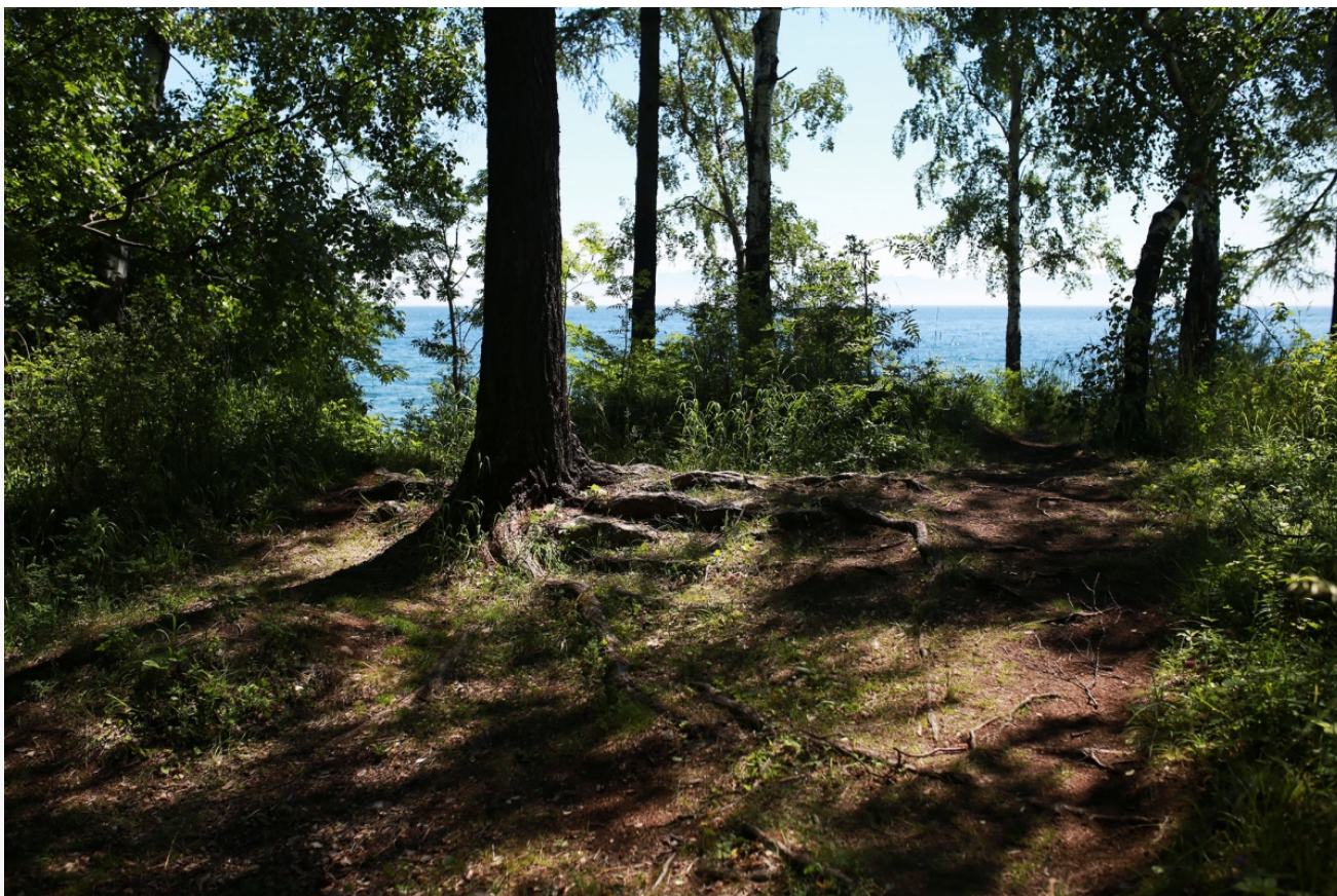
Автор: Регина Ступурайте Фото из альбома "Большая Байкальская тропа" © Фотобанк "RuBabr"

Но собрались мы здесь по другому вопросу – лесному. Ведь в контексте недавних событий нас более всего интересуют именно сплошные рубки леса и тот скандал, который разразился после принятия неоднозначного законопроекта в первом чтении.