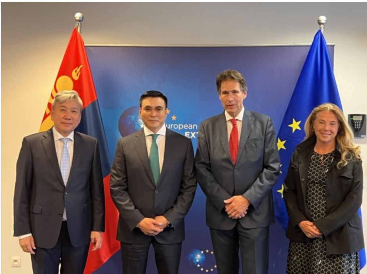
Фото: пресс-служба МИД Монголии

Автор: Денис Большаков © Babr24.com ПОЛИТИКА, ЭКОНОМИКА И БИЗНЕС, ЭКОЛОГИЯ, МОНГОЛИЯ 13793 28.07.2023, 13:45 286