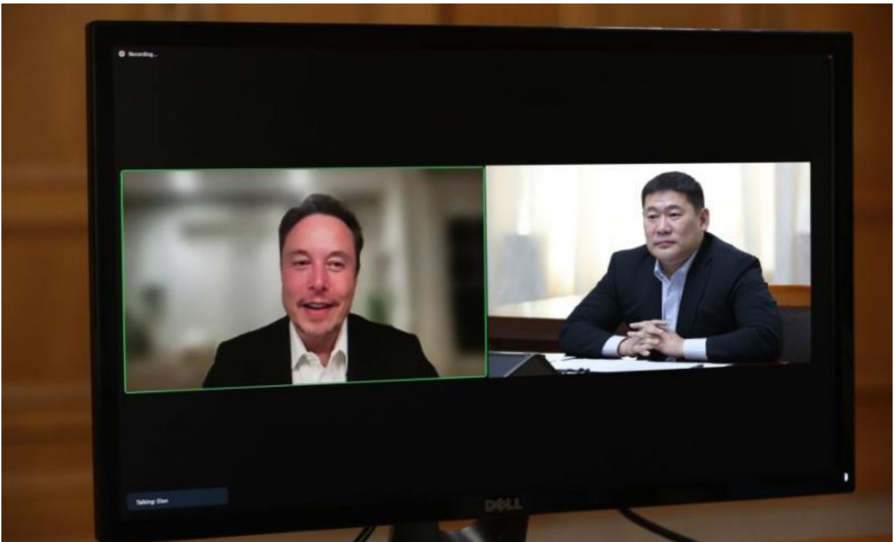
Премьер-министр Монголии проводит онлайн-совещание с главой SpaceX Илоном Маском

Журналисты гонконгского издания Asia Times провели исследование, согласно которому некоторые эксперты в КНР негативно относятся к подключению Монголии к сети Starlink, так как ближайшие к границе спутники SpaceX могут помочь жителям Китая обойти режим строгой цензуры в интернете. Здесь эксперты особенно подчеркнули тот факт, что автономные сервисы сети Starlink невозможно отключить в случае возникновения социальных волнений и люди смогут искать стороннюю информацию на зарубежных ресурсах.