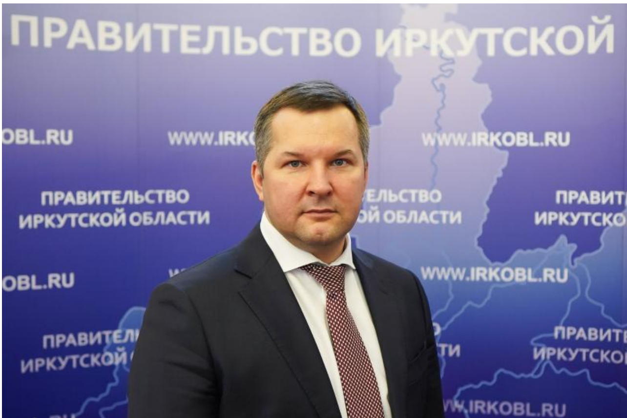
Фото с сайта правительства Иркутской области, СКР

Автор: Ярослава Грин © Babr24.com СКАНДАЛЫ, ЗДОРОВЬЕ, РАССЛЕДОВАНИЯ, ИРКУТСК 👁 30104 24.07.2023, 10:20 📄 338