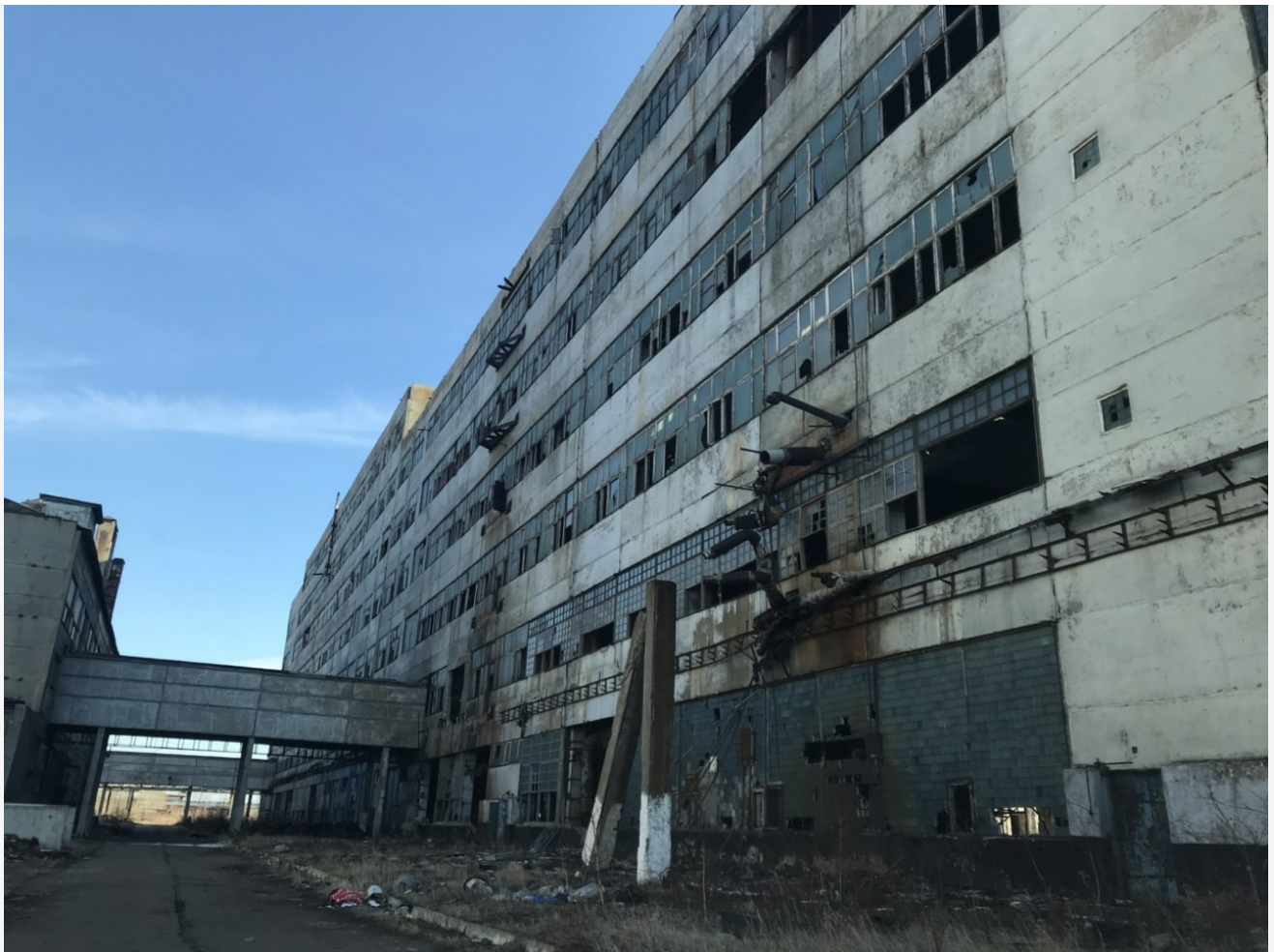
Фото из альбома "Иркутская область. Усольский Химпром" © Фотобанк "RuBabr"

Напомним, что ответственным за утилизацию отходов «Химпрома» в 2020 году был назначен ФГУП «Федеральный экологический оператор», подконтрольный госкорпорации «Росатом». А к 2022 году единственным достижением ФЭО стало перекидывание грязи на сумму 400 миллионов рублей из одной цистерны в другую, сопровождаемое множеством высказываний о процессе «демеркуризации» и «мониторинге». Тогда же демонтаж начали выполнять снизу вверх без предварительного удаления золы из труб, допустив выход химически опасных отходов в атмосферный воздух. Экологическая ситуация на этой площадке остается критической.