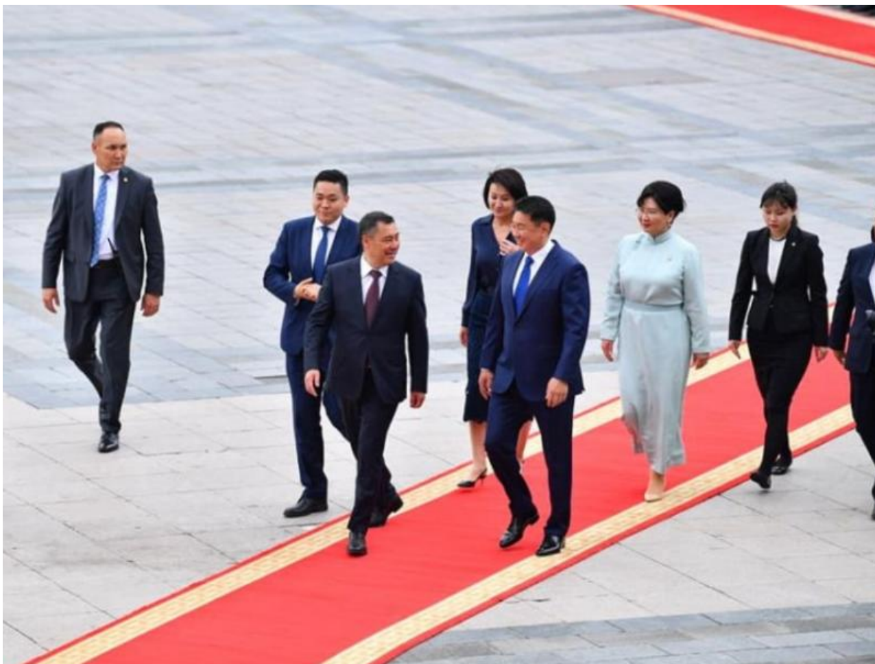
Фото: пресс-служба правительства Монголии, МИД Монголии

Автор: Денис Большаков © Babr24.com ПОЛИТИКА, ЭКОНОМИКА И БИЗНЕС, ОБЩЕСТВО, МОНГОЛИЯ 👁 30235 14.07.2023, 14:54 📌 366