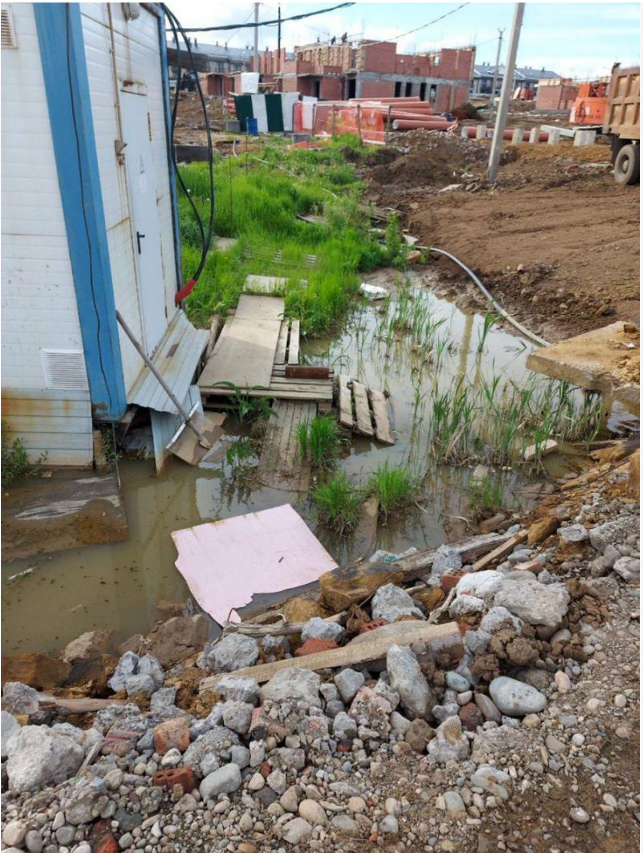
Будущий Датский квартал

Ну что ж, совсем скоро в дружном «семействе» жителей Хрустального парка прибавится «воинов». И битва с обнаглевшим застройщиком продолжится с новыми силами и упорством. Вот только когда уже настанет прекрасное будущее в прекрасном районе, которое так активно рекламировали на старте продажи домов? Вопрос, безусловно, риторический.