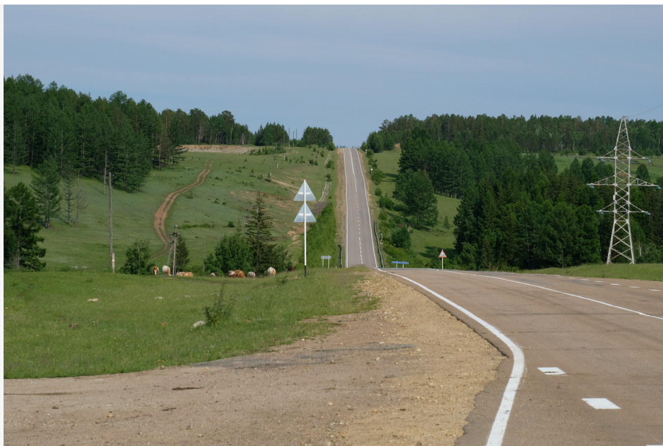
Автор: Алёна Штерн Фото из альбома "Дорога Еланцы- Баяндай" © Фотобанк "RuBabr"

5 июля 2023 года в картотеке арбитражных дел сообщили, что компанию «Байкал-138», которая в прошлом связана с фирмой бывшего главы Прибайкалья Сергея Ерощенко, обязали вернуть более 190 миллионов рублей в связи с признанием недействительным государственного контракта на реконструкцию дороги на острове Ольхон и удовлетворением иска прокуратуры Иркутской области.