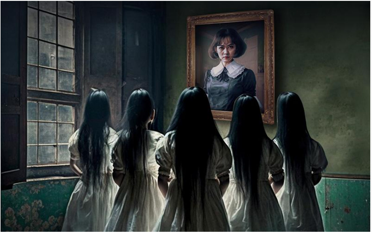
Постер к фильму «Проклятие. Дом с прислугой 2»

Также на экраны выходят японская мелодрама Кодзи Фукады «Личная жизнь» , представленная в сентябре прошлого года в основной программе Венецианского кинофестиваля, американский комедийный детектив Джона Слэттери «Мэгги Мур(ы)» (18+), канадский семейный фантастический фильм Аристомениса Цирбаса «Назад к динозаврам» и казахстанская спортивная драма Алдияра Байракимова «Паралимпиец» .