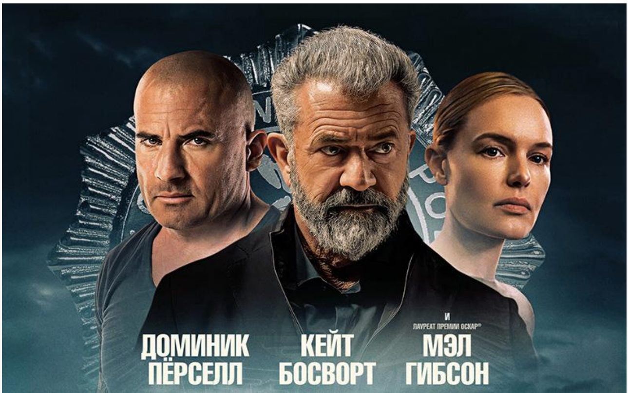
Постер к фильму «Время расплаты»