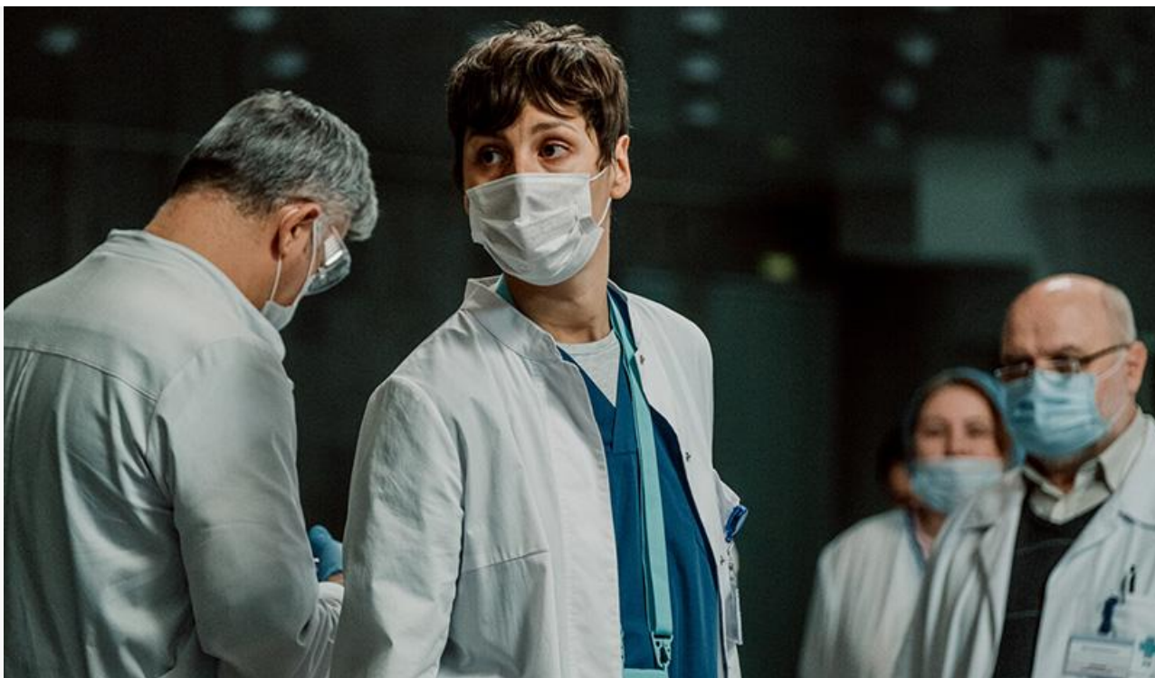
Кадр из фильма «Дыхание»

« Дыхание » же, снятое на основе недавних событий пандемии COVID-19, вышло на экраны 22 июня и за первые четыре дня проката на 1 520 экранах заработало 30,4 миллиона. Не ахти какое достижение, которого тем не менее хватило для первого места.