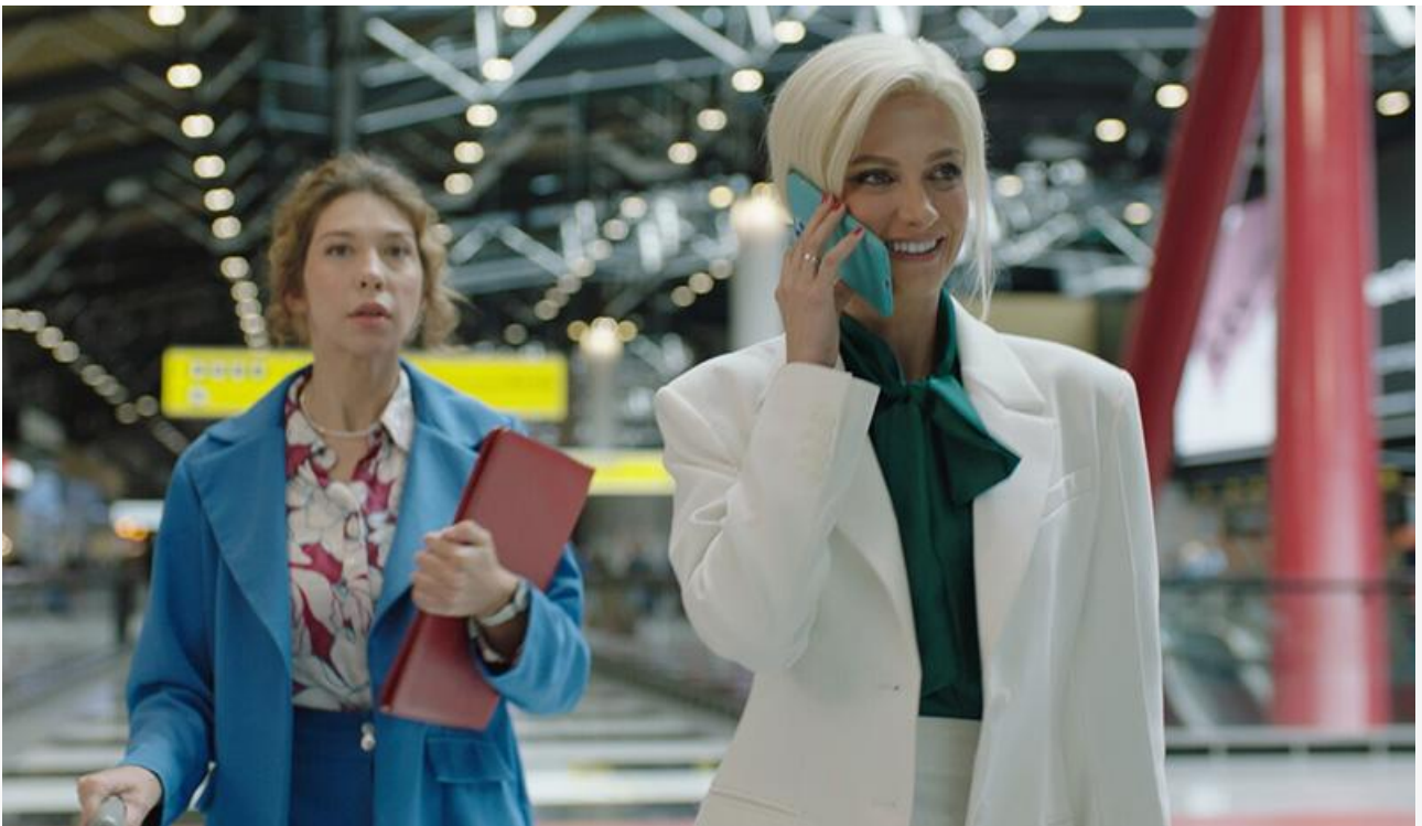
Кадр из фильма «Мальдивы подождут»

Другие фильмы топовой пятёрки расположились довольно плотно между «Дыханием» и «Мальдивами», отставая друг от друга примерно на миллион рублей.