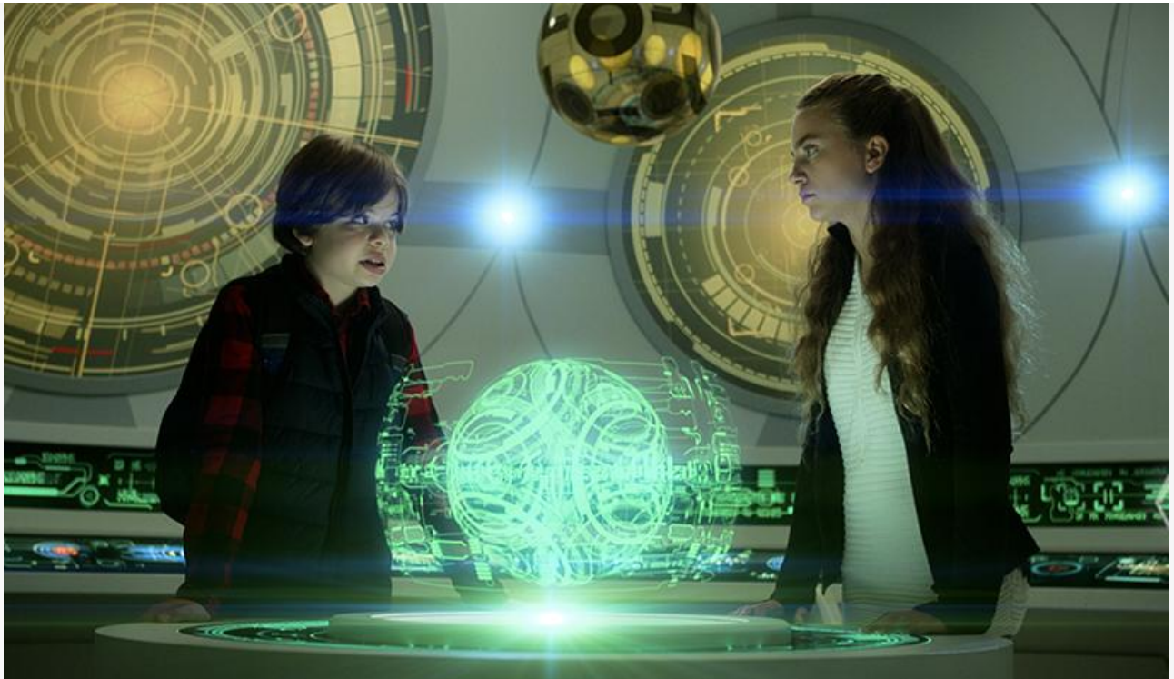
Кадр из фильма «Назад к динозаврам»