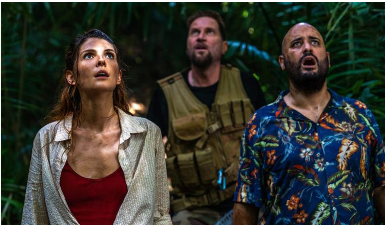
Кадр из фильма «Круиз по джунглям: Тайна Вальверде»