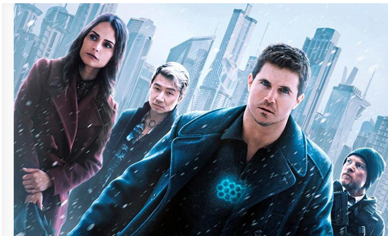
Постер к фильму «Больше, чем люди»