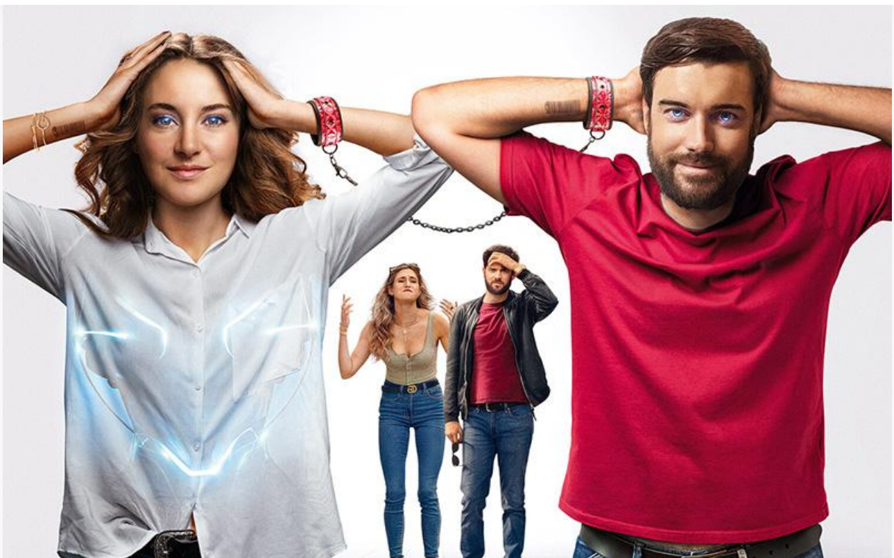
Постер к фильму «(Не)идеальные

Фанатов фильмов ужасов ждут в кинотеатрах американский хоррор Кевина Льюиса « Восставшая из ада » (18+) и американо-индонезийский «ужастик» Стюарта Симпсона « Проклятие. Дом с прислугой 2 ».