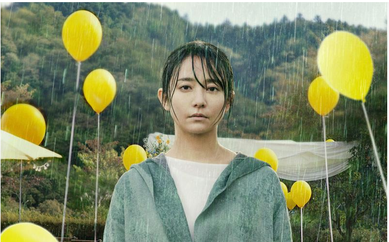
Постер к фильму

В формате перевыпуска зрители смогут вновь посмотреть на больших экранах криминальный триллер Дэна Гилроя 2013 года «Стрингер» (18+).