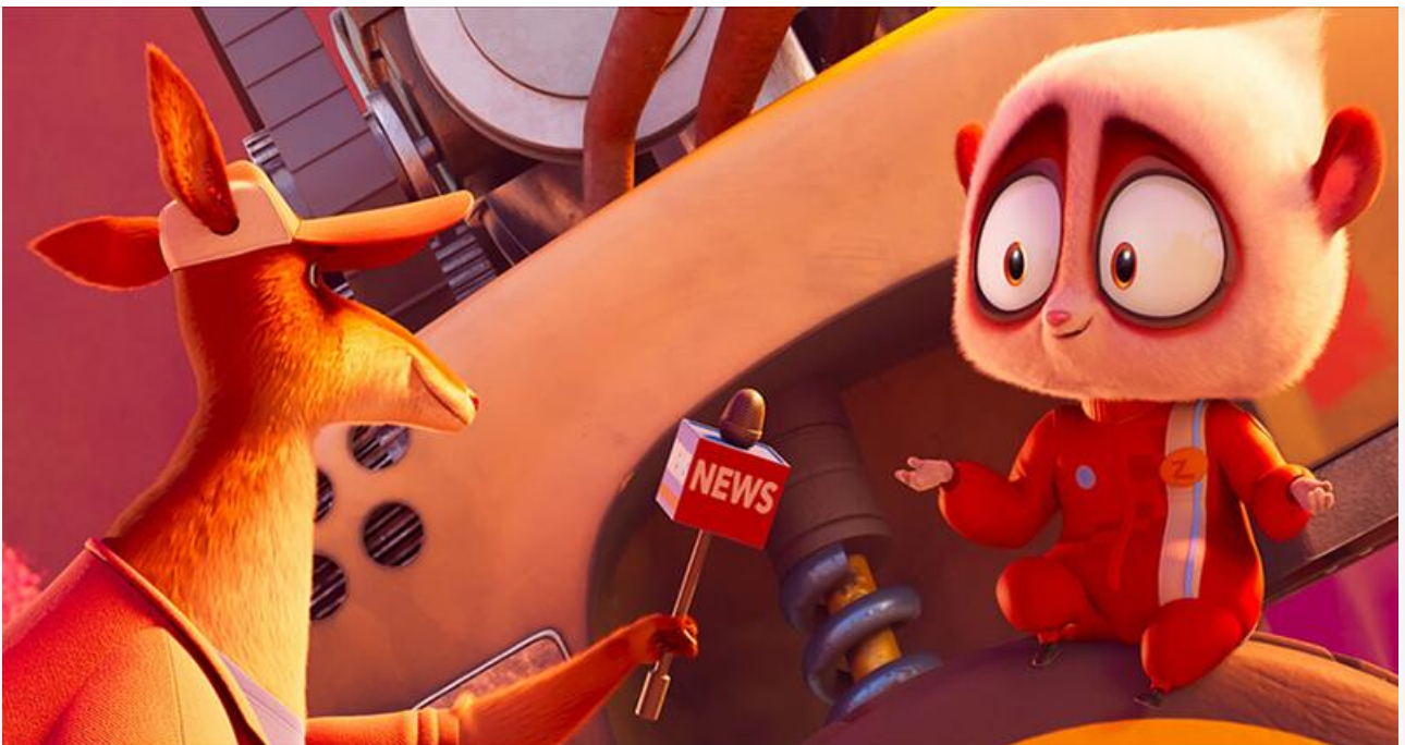
Кадр из фильма «Зверогонщики»

Премьерный британо-американский мультфильм Росса Венокура «Зверогонщики» собрал с семейной аудитории 23,2 миллиона на 1 838 экранах и занял второе место. У «Вызова» Клима Шипенко, разменявшего третий месяц в прокате, копилка пополнилась на 22,4 миллиона. Лидер трёх предыдущих уикендов – «Переводчик» Гая Ричи – потерял в сборах 36 % и с суммой 21,2 миллиона опустился на четвёртую строку чарта.