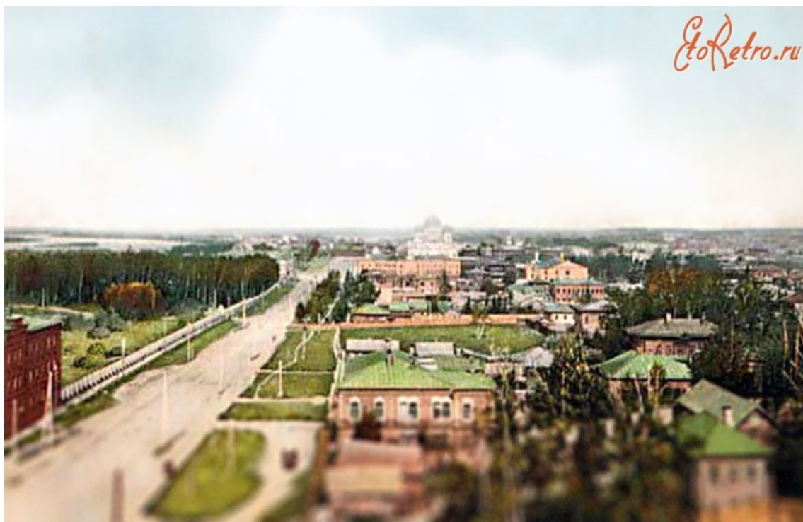
Фото: Александр Петров, etoretro.ru

Автор: Яна Ледина © Babr24.com КУЛЬТУРА, ОБЩЕСТВО, ИСТОРИЯ, ТОМСК 👁 21550 27.06.2023, 00:07 👍 392