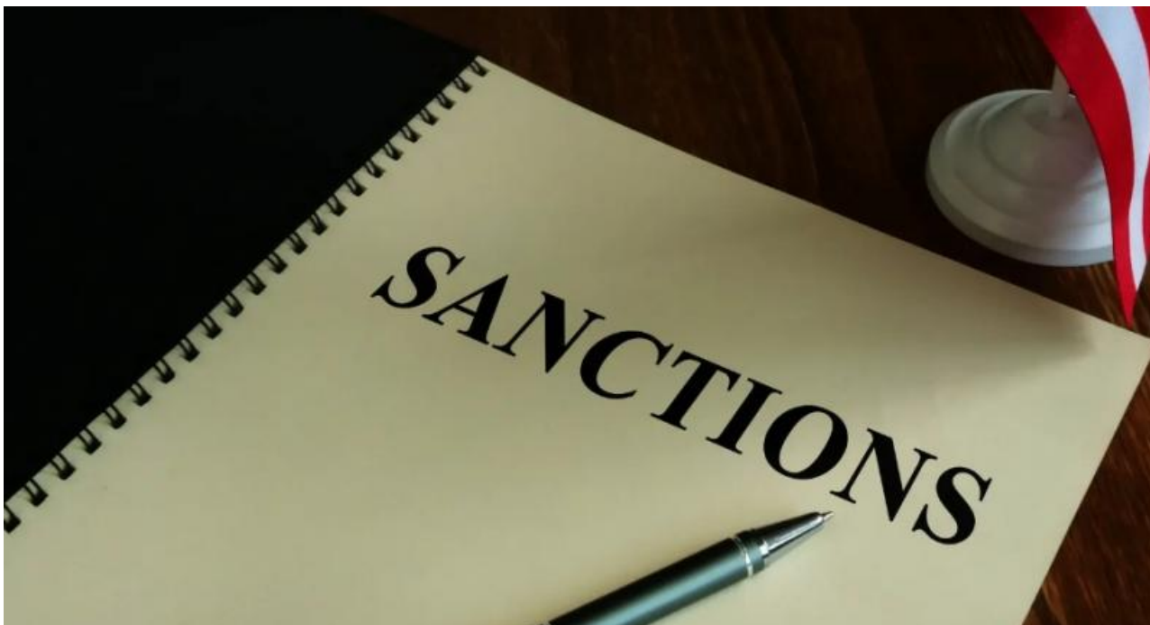
Фото: пресс-служба ПАО «Газпром»

Автор: Денис Большаков © Babr24.com ПОЛИТИКА, ЭКОНОМИКА И БИЗНЕС, МОНГОЛИЯ, КИТАЙ, РОССИЯ 👁 69440 26.06.2023, 19:37 🔄 461