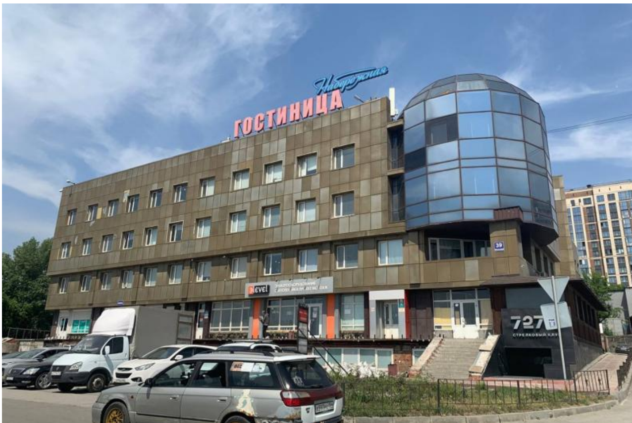
Фото: Виктор Бобровников; Нина Кувшинина; источник НГС; читательница НГС; Виктор Бобровников

Автор: Лев Блиссов © Babr24.com ОБЩЕСТВО, ПРОИСШЕСТВИЯ, ЗДОРОВЬЕ, НОВОСИБИРСК 👁 6823 25.06.2023, 19:03 📄 562