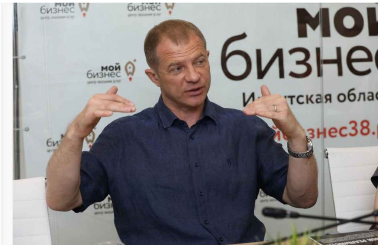
Теперь Евгений Викторович делится новым опытом.

«Мы осваиваем порядка двадцати направлений, в десять уже вложились и получаем доход».