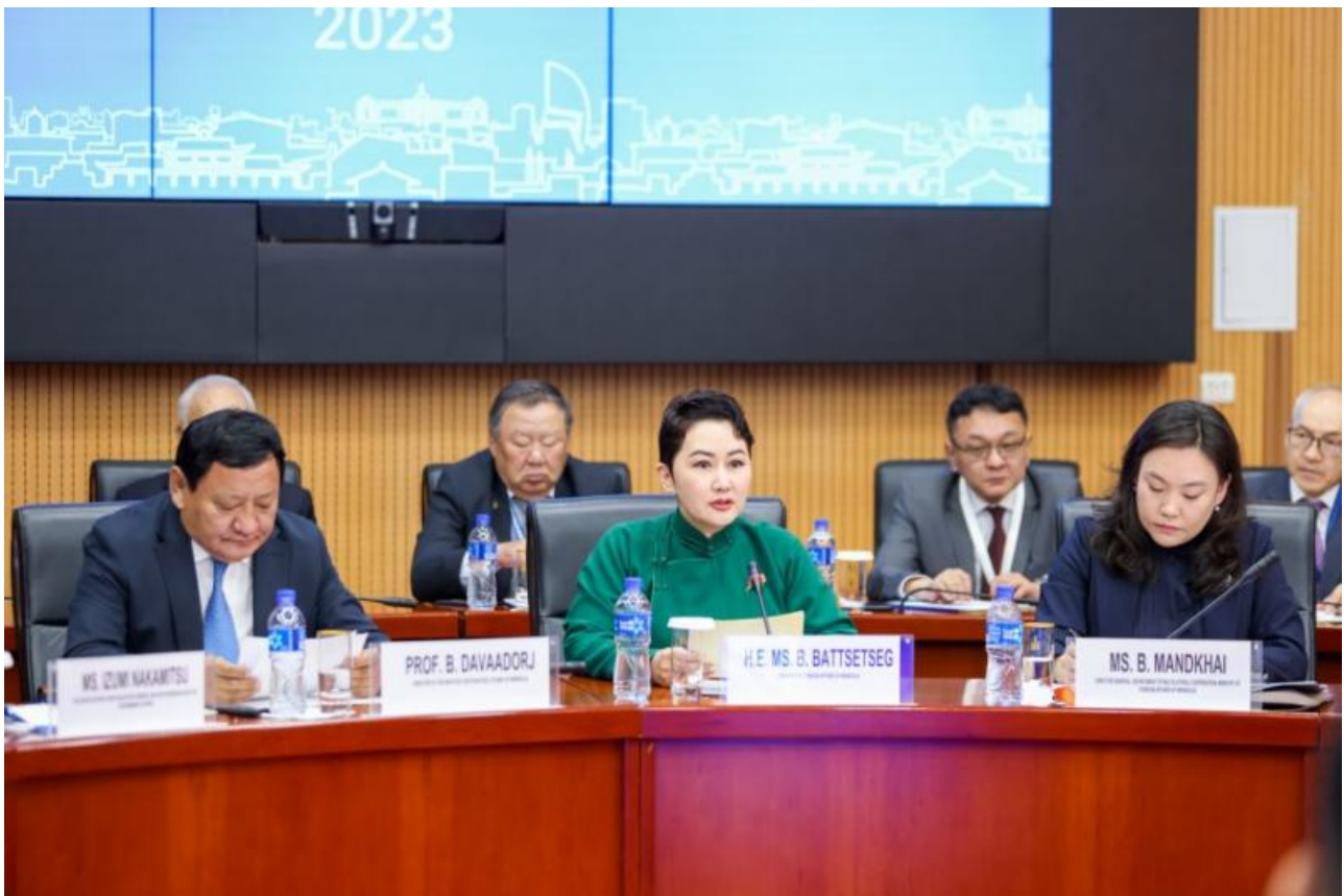
Фото: пресс-служба МИД Монголии

Автор: Денис Большаков © Babr24.com ПОЛИТИКА, ЭКОНОМИКА И БИЗНЕС, ОБЩЕСТВО, МОНГОЛИЯ 15.06.2023, 17:31 395 16808