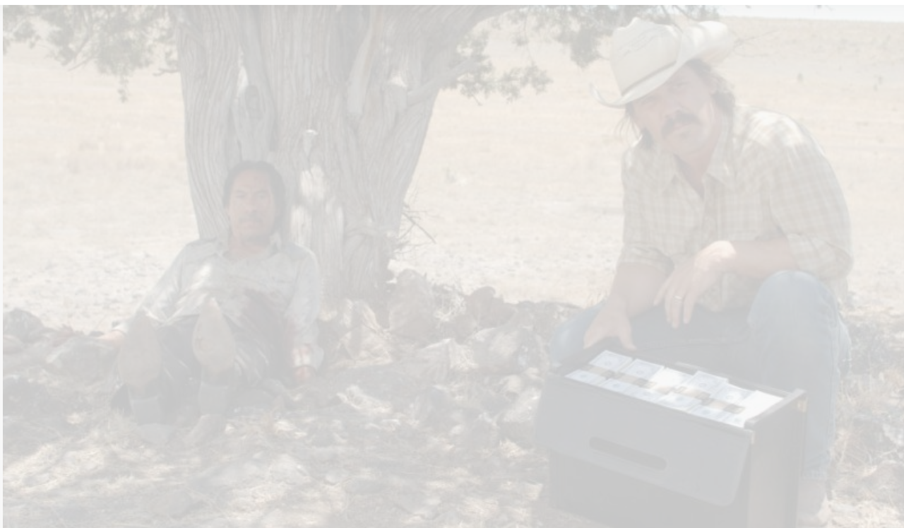
Кадр из фильма «Старикам тут не место» по одноимённому роману Кормака Маккарти, 2007 год

Память людей – штука ненадёжная, и прошлое, которое было, мало чем отличается от прошлого, которого не было.