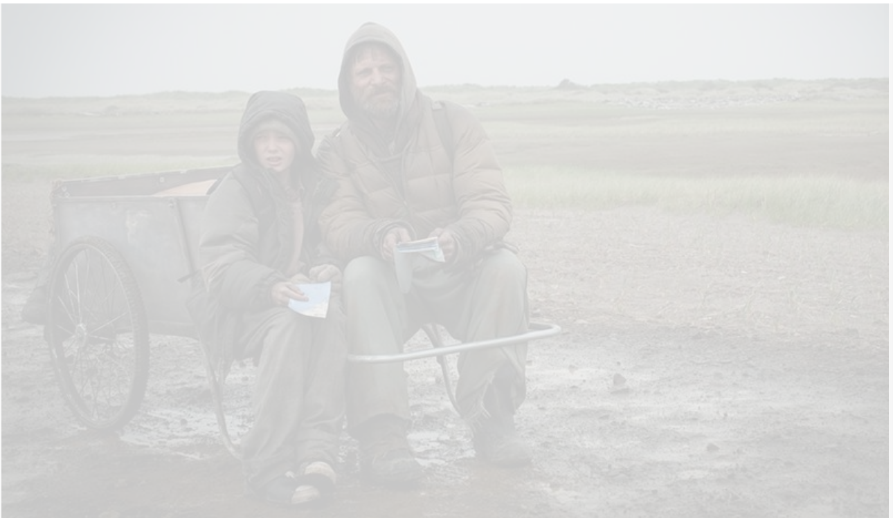
Кадр из фильма «Дорога» по одноимённому роману Кормака Маккарти, 2009 год

Женщинам снятся сны про несчастья, грозящие их близким, а мужчинам – про несчастья, грозящие им самим.