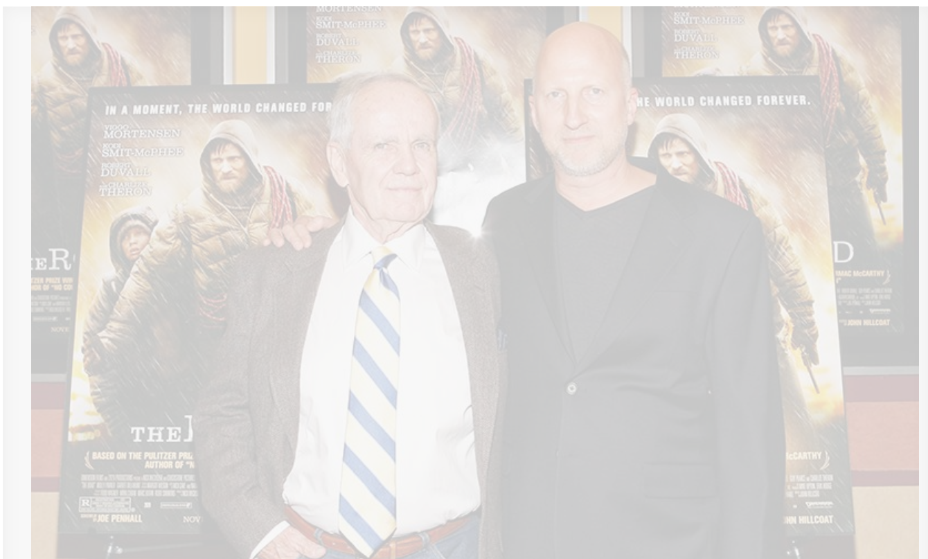
Кормак Маккарти и Джон Хиллкоут на премьере фильма «Дорога», 2009 год

Криминальный триллер Ридли Скотта «Советник» с Майклом Фассбендером, Пенелопой Крус, Кэмерон Диас и Брэдом Питтом снят по оригинальному сценарию Кормака Маккарти. А в апреле 2023 года было объявлено, что режиссёр «Дороги» Джон Хиллкоут приступает к съёмкам фильма по роману Маккарти «Кровавый меридиан».