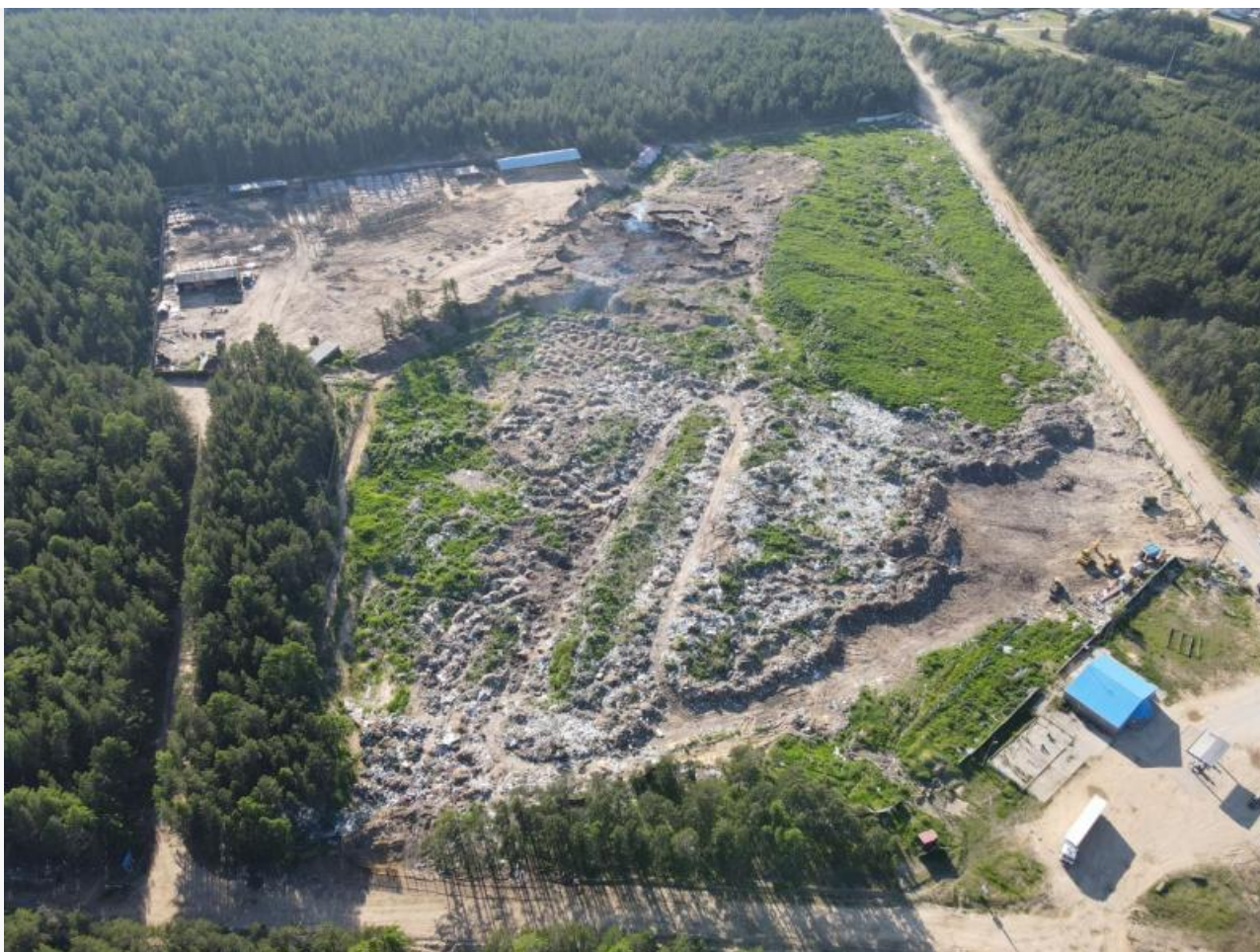
Огромная свалка в Усть-Баргузине

Увидев, что проект и техническое задание практически не предусматривают средств объективного контроля, он дал указание включить маркшейдерские работы на каждом этапе, установку весов и видеокамер, системы наблюдения ГЛОНАСС на грузовики, ее интеграцию с весами, ведение электронных журналов, передачу информации заказчику онлайн и тому подобное, что встретило недовольство подрядчика и непонимание подчиненных, в особенности заместителя Т.