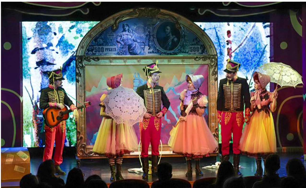
Сцена из спектакля «Сватовство гусара»

Слава богу, хоть «Попрыгунью» с «Перекрёстком» сыграют на Малой сцене. Ну как слава богу... Первая – балет на 6 квадратных метрах, второй – чистой воды драма, замаскированная на афише под «музыкальный спектакль с драматическим звучанием».