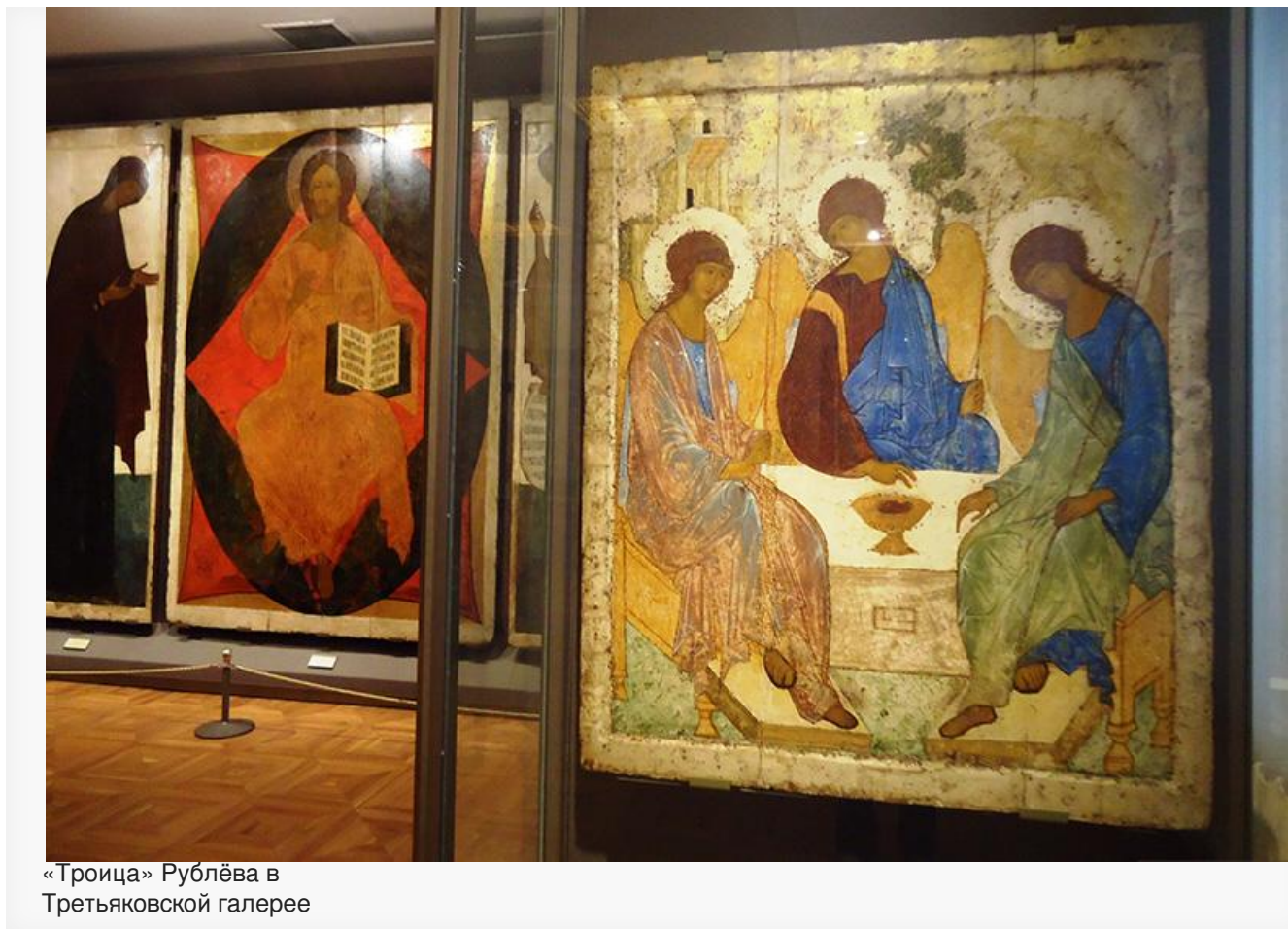
«Троица» Рублёва в Третьяковской галерее

Многочисленные возражения специалистов, убеждённых, что шедевру мировой культуры подписан смертный приговор, растворяются в воздухе, не доходя ни до Кремля, ни до здания Минкульта в Малом Гнезденковском переулке, ни до резиденции патриарха Кирилла.