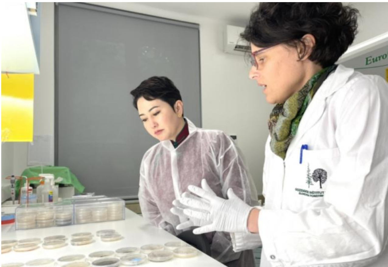
Фото: пресс-служба МИД Монголии

Автор: Денис Большаков © Babr24.com ПОЛИТИКА, НАУКА И ТЕХНОЛОГИИ, ЭКОЛОГИЯ, МОНГОЛИЯ 21607 17.05.2023, 16:51 544