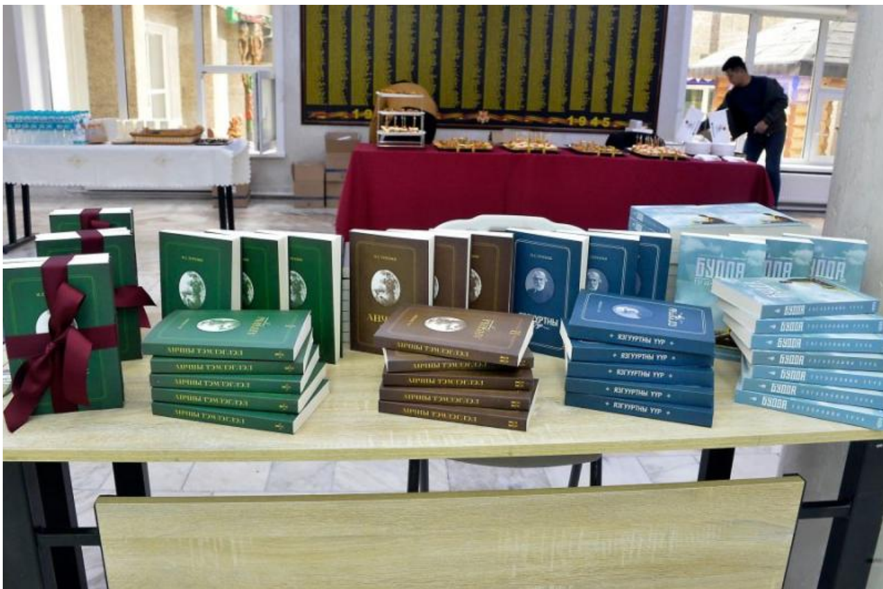
Фото: телеграм-канал «Русский Дом в Улан-Баторе», Монцамэ

Автор: Денис Большаков © Babr24.com КУЛЬТУРА, ОБЩЕСТВО, МОНГОЛИЯ, РОССИЯ 👁 20757 08.05.2023, 13:38 📌 641