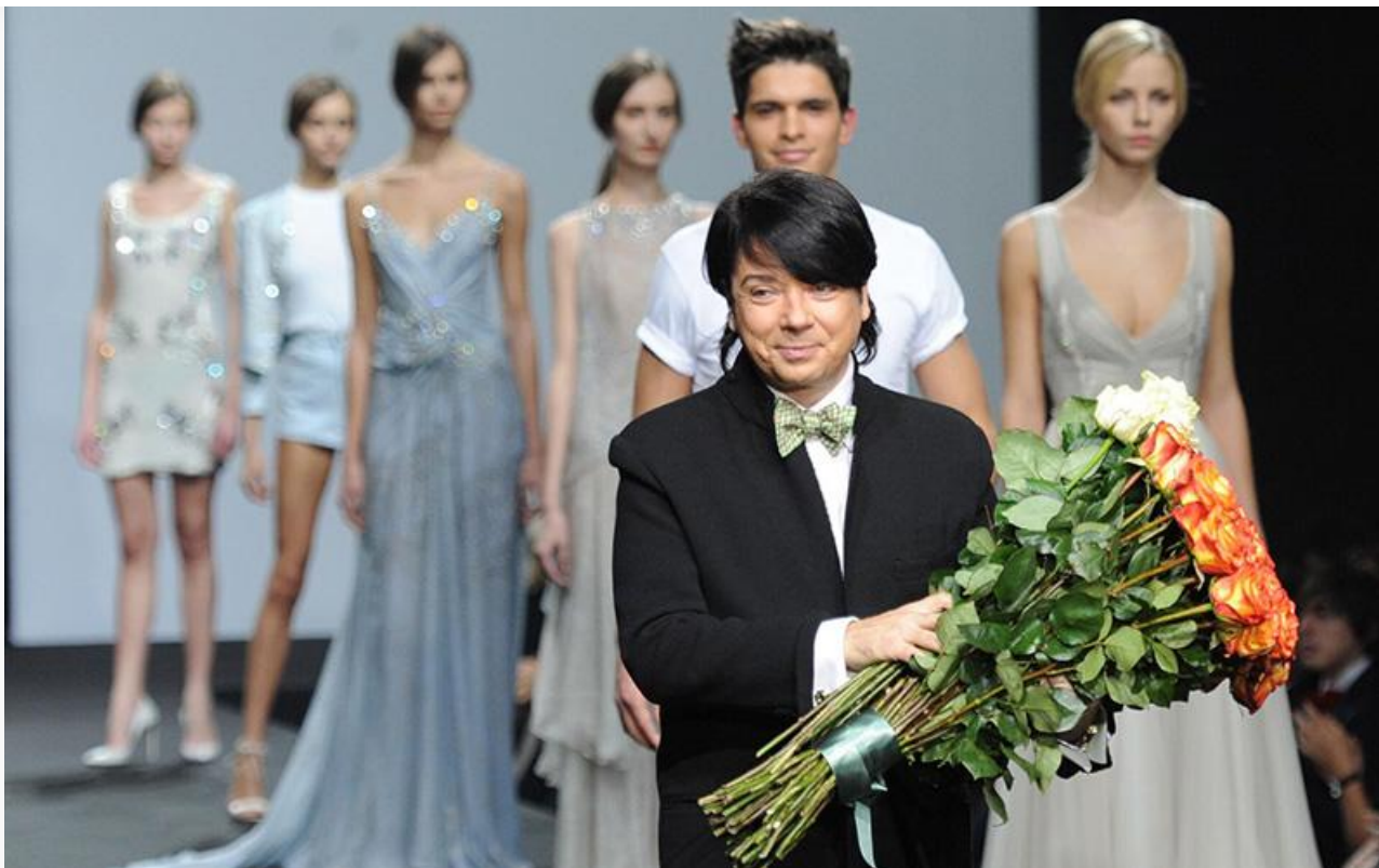
Валентин Юдашкин на открытии Volvo Fashion Week в Москве, 2011 год

У них было много общего, но было и одно принципиальное отличие: второй дважды соглашался стать доверенным лицом Владимира Путина на президентских выборах, а вот первый этой участи сумел избежать.