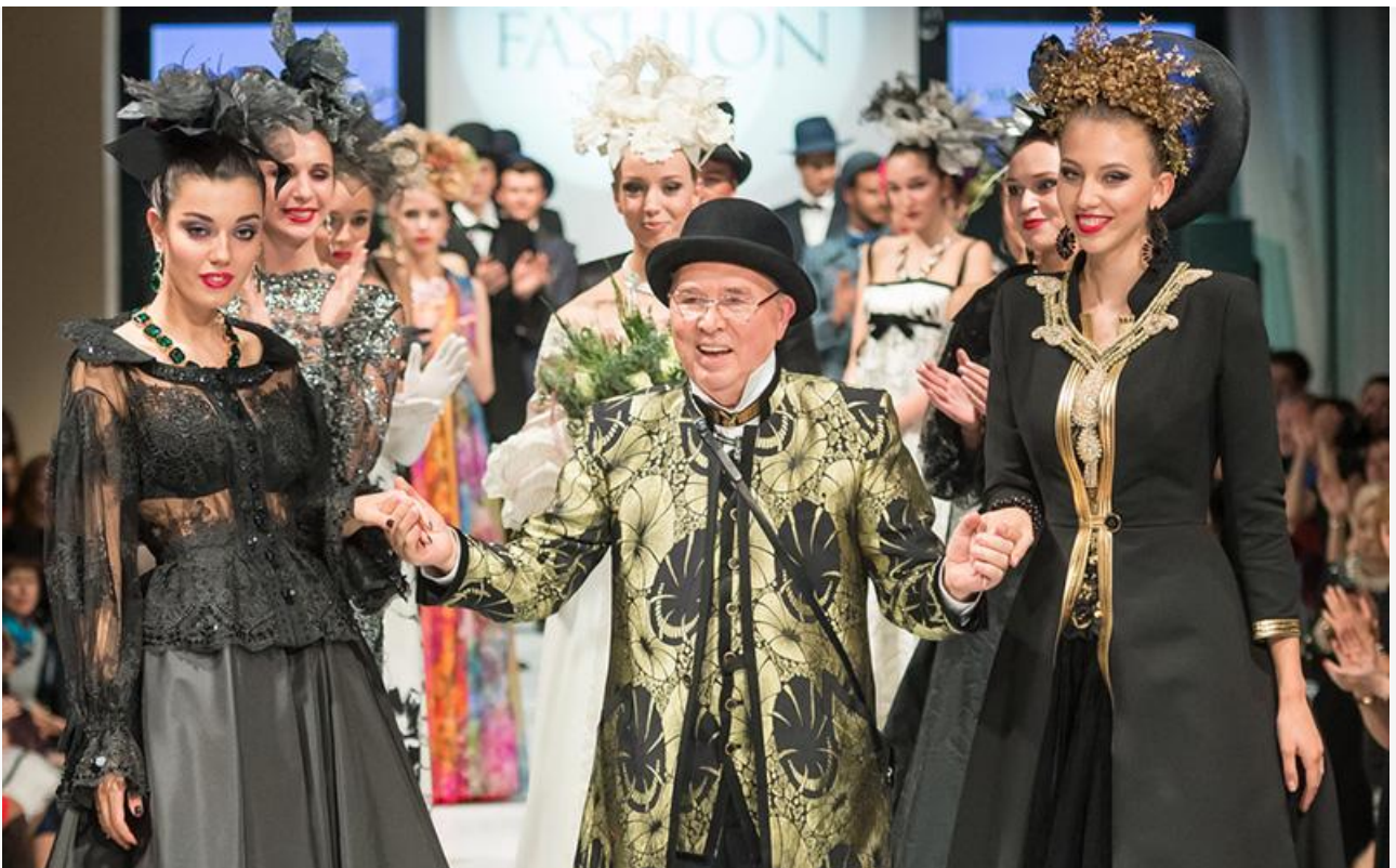
Вячеслав Зайцев на

За плечами «Красного Диора» к тому времени были знаменитые коллекции «1000-летие Крещения Руси» и «Русские сезоны в Париже», показанные в Нью-Йорке и столице Франции. Вскоре после триумфа «Фаберже» собственный Дом моды открыл и «Русский Карден».