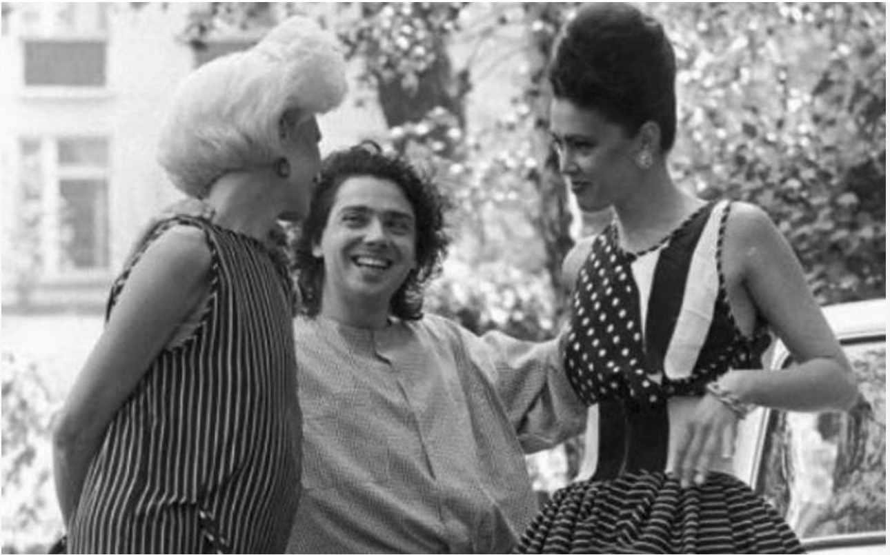
Валентин Юдашкин в молодости

В 1982 году Вячеслав Зайцев стал художественным руководителем нового Дома моделей на проспекте Мира (сейчас Московский Дом Моды Славы Зайцева), где в 1986-м под его руководством проходил преддипломную практику выпускник Индустриального техникума Валя Юдашкин, через пять лет прогремевший на весь мир с коллекцией «Фаберже», показанной в рамках Недели Высокой моды в Париже.