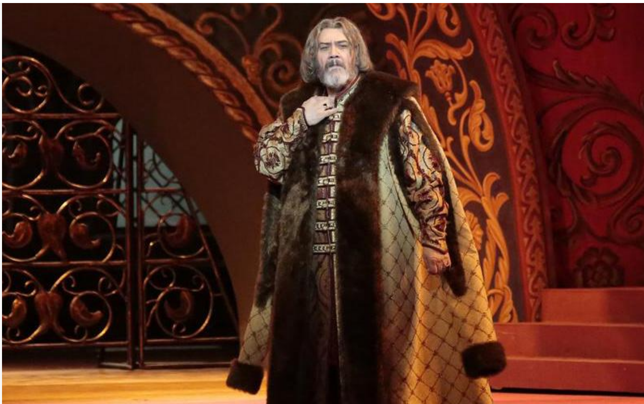
В партии Собакина в опере Римского-Корсакова «Царская невеста». Постановка Большого театра

Среди партий, исполненных певцом на главной сцене страны, – князь Юрий в «Сказании о невидимом граде Китеже и деде Февронии», царь Додон в «Золотом петушке» и Собакин в «Царской невесте» Римского-Корсакова, Годунов, Пимен и Варлаам в «Борисе Годунове» и Иван Хованский и Досифей в «Хованщине» Мусоргского, король Рене в «Иоланте», Гремин в «Евгении Онегине» и Мамыров в «Чародейке» Чайковского, Иван Сусанин в «Жизни за царя» Глинки, Мельник в «Русалке» Даргомыжского, Дон Базилио в «Севильском цирюльнике» Россини.