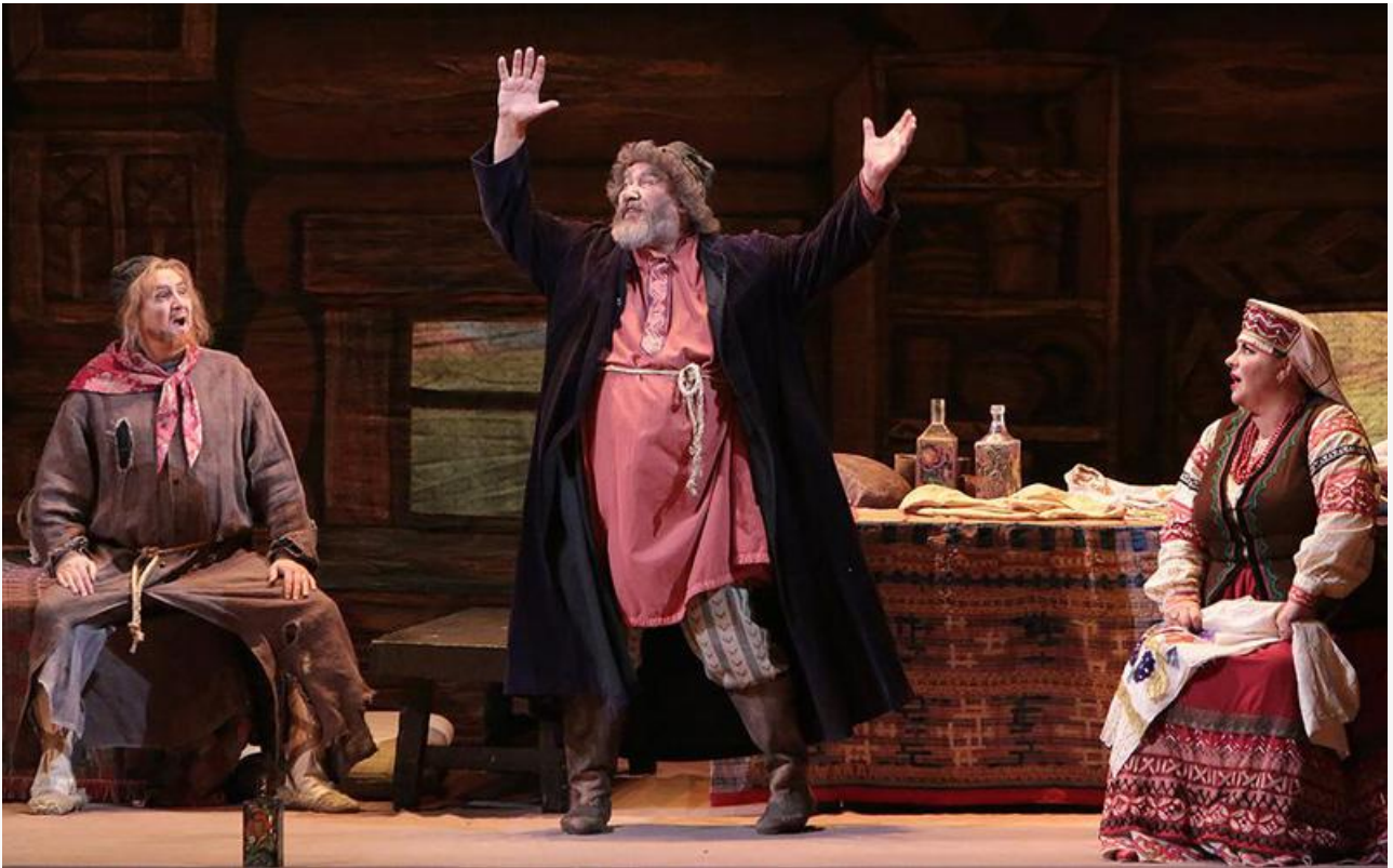
В партии Варлаама в опере Мусоргского «Борис Годунов». Постановка Большого театра

Кроме работы по основному призванию юбиляр активно занимается общественной деятельностью с православным уклоном. В 2006 году им был основан «Фонд возрождения культуры и традиций малых городов Руси», под эгидой которого проводятся Бахрушинский фестиваль, фестиваль «Жемчужины России» и фестиваль православной культуры малых городов и сельских поселений «София».