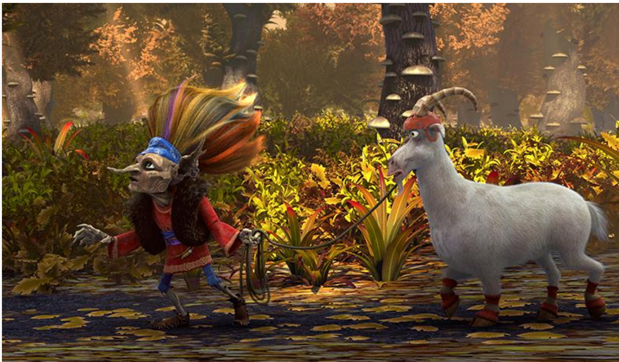
Кадр из фильма «Яга и книга заклинаний»

Главных героев в мультфильме «Яга и книга заклинаний» – Бабу Ягу и Лешего – озвучили Юлия Хлынина и Фёдор Бондарчук.