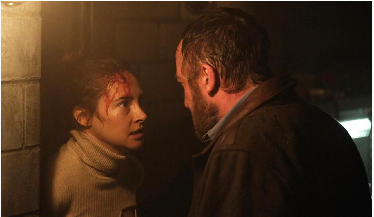
Кадр из фильма «Мизантроп»