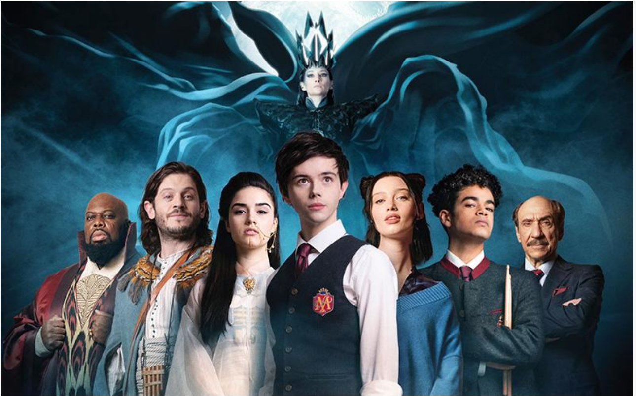
Постер к фильму «Волшебная флейта»