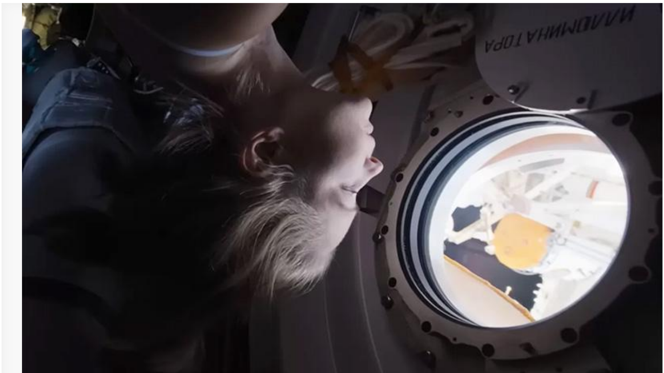
Кадр из фильма «Вызов»

Успешнее «Вызова» стартовали в своё время «Сталинград» и «Вторжение» Фёдора Бондарчука, «Экипаж» Николая Лебедева, «Лёд» Андрея Трофима и «Лёд 2» Жоры Крыжовникова, «Т-34» Алексея Сидорова, «Последний богатырь», «Последний богатырь: Корень зла» и «Чебурашка» Дмитрия Дьяченко.