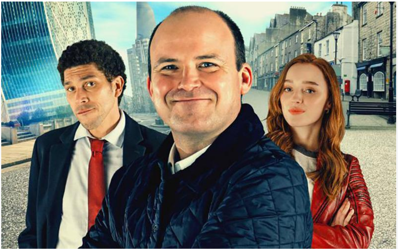
Постер к фильму «Банк Дэйва»