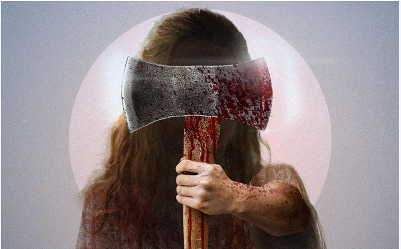
Постер к фильму «Одержимость. Проклятие Лиззи Борден»