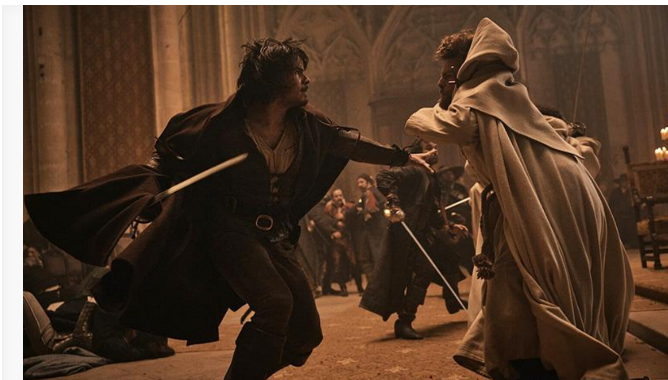
Кадр из фильма «Три мушкетёра: Д'Артаньян»

Общая касса топ-20 фильмов уикенда составила, по информации «Бюллетеня кинопрокатчика», 542 миллиона рублей (с учётом стран СНГ – 591 миллион). Это на 137,6 % больше по сравнению с предыдущими выходными