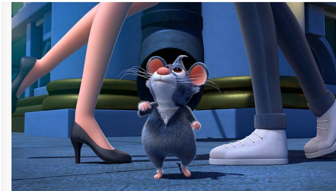
Кадр из фильма «Коты Эрмитажа»

Пореченковым в главной роли вновь, как и в своём стартовом уикенде, не попал в топ-10 успешных фильмов российского проката. На этот раз в активе экранизации поэмы Николая Мельникова 4 миллиона рублей, с огромными усилиями собранных на 1 145 экранах, и 11 место по итогам уикенда.