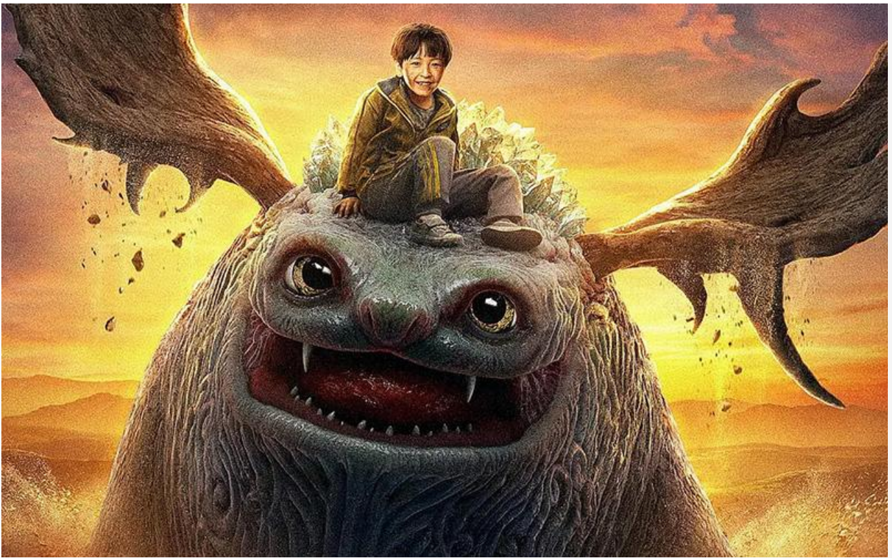
Постер к фильму «Мой монстр»