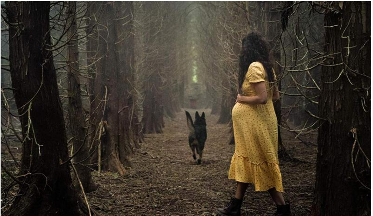
Кадр из фильма «Гремлины: Хранители леса»

С разной степенью потерь в экранах и сборах сохранили места в топ-10 « Коты Эрмитажа » (12 миллионов и четвёртое место), « Моё прекрасное несчастье » (10,8 миллиона и пятое место), « Три мушкетёра: Д'Артаньян » (9,4 миллиона и шестое место), « Зверолэнд » (8,1 миллиона и седьмое место), « Паранормальные явления: Отель призраков » (6,8 миллиона и восьмое место) и « На солнце, вдоль рядов кукурузы » (6,2 миллиона и девятое место).