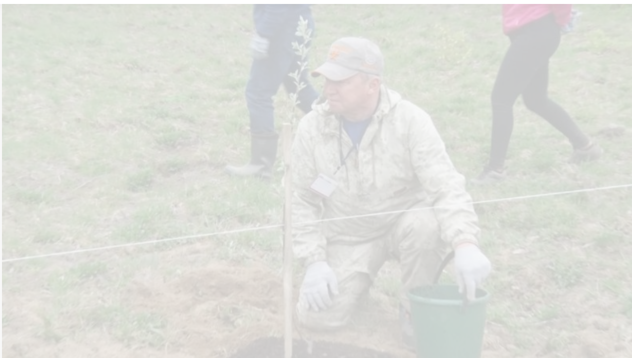
Красивая картинка посадки садов с участием мэра