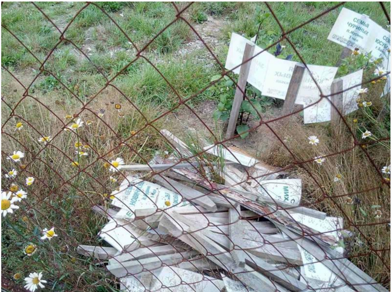
А так выглядят сады не на камеру

Наверное, больно увлекательное это дело, даже при том, что не приносит ни копейки дохода в местный бюджет, не создает рабочих мест, а наоборот – требует постоянной бюджетной подпитки. До такой степени, что ради него можно позорно провалить реализацию национальных проектов на вверенной территории. Широко известными стали истории о срыве строительства школы и отказа от строительства детского сада в Слюдянке, неисполнении поручения Владимира Путина по строительству моста в поселке Новоснежная.