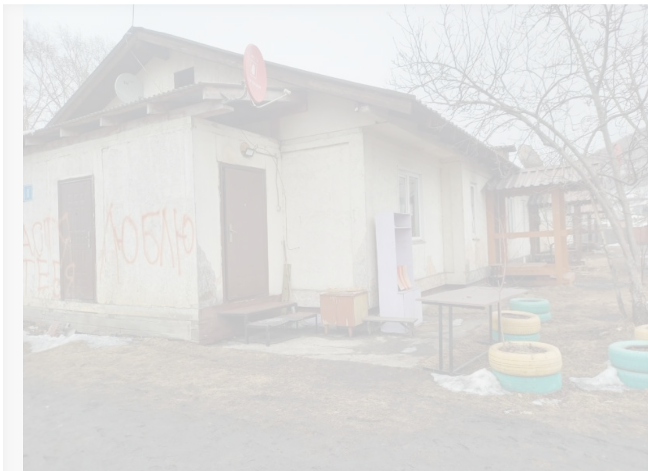
Слюдянка, Иркутская область, XXI век. В такие дома переселяли людей из аварийного жилья при `крепком хозяйственнике`

Еще одним памятником «крепкого хозяйственника» стали дома, в которые переселяли людей из ветхого и аварийного жилья. Построенные в переулках Пакгаузном и Омудевом строения с большой натяжкой можно назвать капитальными – скорее картонными муляжами домов. Спустя всего десять (!) лет они признаны аварийными, а люди ежедневно рискуют совершить увлекательное путешествие в квартиру соседней снизу, провалившись в дыру, ведь полы в этих домах давно и безнадежно сгнили, а ответственности за такое строительство традиционно никто не понес.