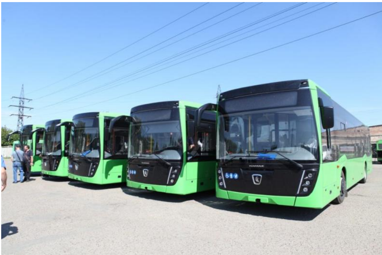
Фото с сайта администрации Иркутска

Автор: Алина Саратова © Babr24.com ПРОИСШЕСТВИЯ, ИРКУТСК 👁 4742 23.04.2023, 14:55