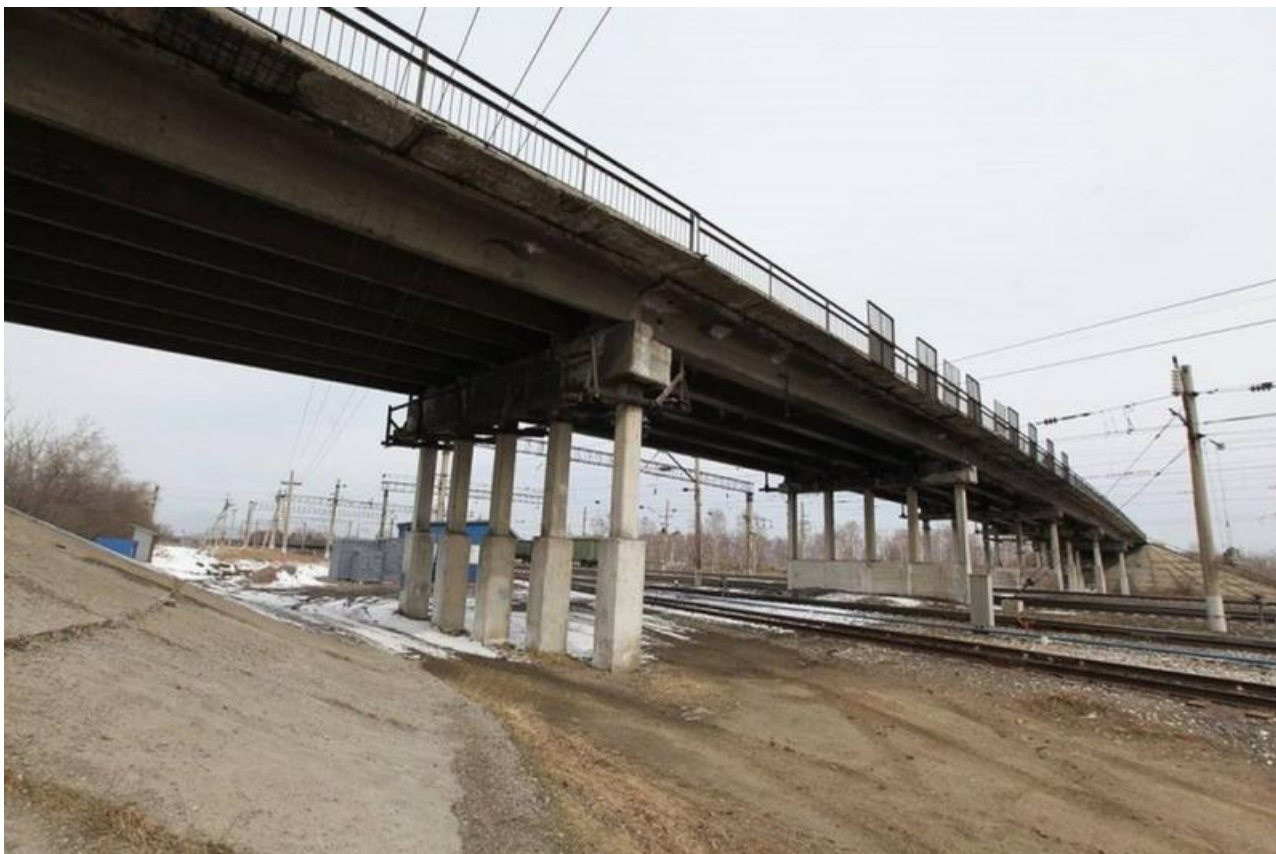
Фото с сайта администрации Иркутска

Автор: Алина Саратова © Babr24.com ПРОИСШЕСТВИЯ, ИРКУТСК 👁 5025 23.04.2023, 14:02 📌 314