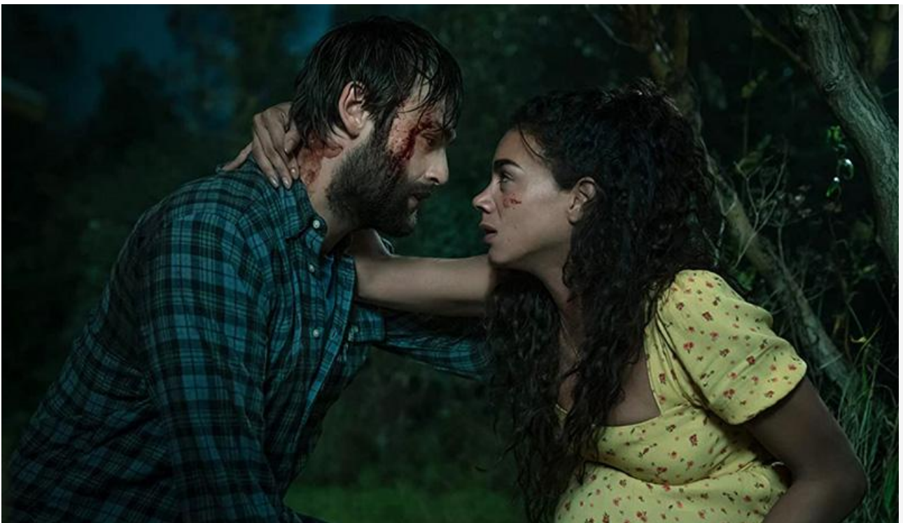
Кадр из фильма «Гремлины: Хранители леса»