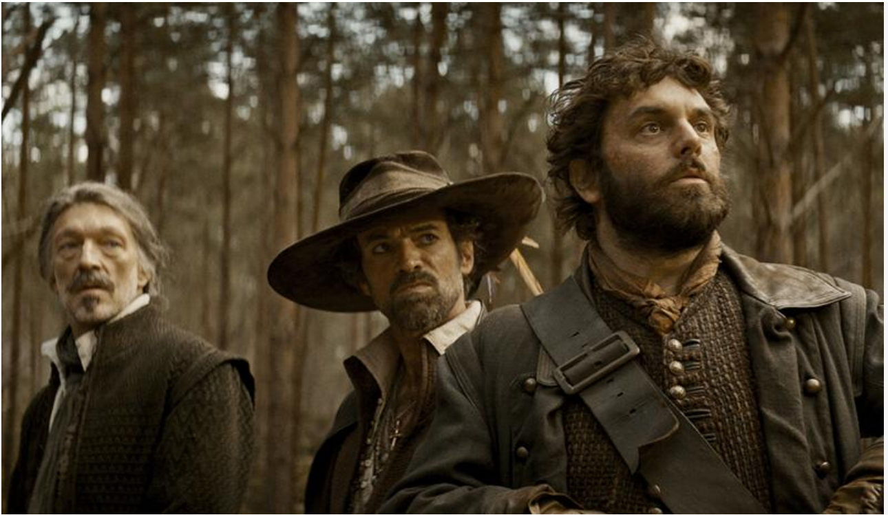
Кадр из фильма «Три мушкетёра: Д'Артаньян»

Тремя премьерными, сумевшими по итогам уикенда пробиться в топовую десятку, стали комедийный хоррор Джеффри Райана « Паранормальные явления. Отель призраков » (16 миллионов и шестое место), китайский фэнтезийный мультфильм « Зверолэнд » (12,7 миллиона и седьмое место) и китайский фантастический боевик Франта Гво « Блуждающая Земля 2 » (11,6 миллиона и восьмое место).