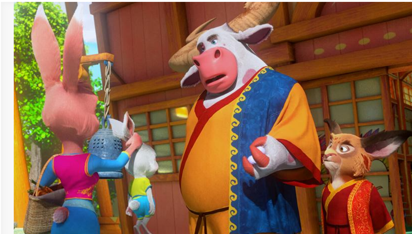
Кадр из фильма «Зверолэнд»

Общая касса топ-20 фильмов уикенда составила, по информации «Бюллетеня кинопрокатчика», 228 миллионов рублей (с учётом стран СНГ – 283 миллиона). Это на 30,1 % меньше по сравнению с предыдущими выходными и худший показатель в 2023 году.