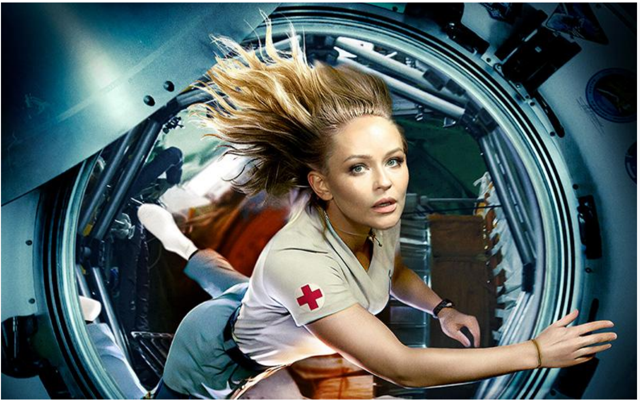
Постер к фильму «Вызов»

Желающих состязаться с «Вызовом» нашлось немного. И всё же есть в списке премьер уикенда пара релизов, которым вполне по силам попасть в топ-10 проката. Это американский детективный экшн-триллер Дамиана Сифрона «Мизантроп» (18+) с Шейлин Вудли и Беном Мендельсоном и британский хоррор Джона Райта «Гремлины: Хранители леса» (18+) с Ханной Джон-Кэймен и Дугласом Буттом.