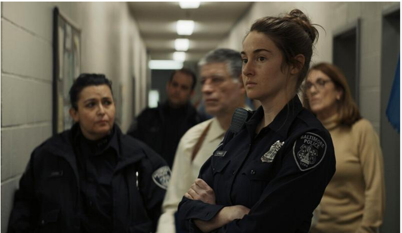
Кадр из фильма «Мизантроп»