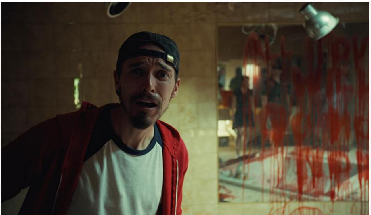
Кадр из фильма «Паранормальные явления. Отель призраков»

Замкнули десятку лидеров, зацепившись за девятое и десятое места, « Бюро магических услуг » (11,2 миллиона) и « Поехавшая » (10,4 миллиона).