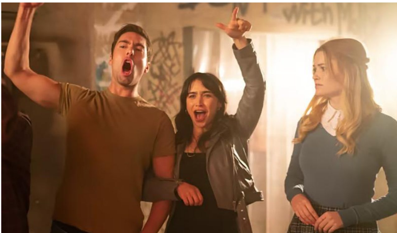
Кадр из фильма «Моё прекрасное несчастье»

«На солнце, вдоль рядов кукурузы» и «Коты Эрмитажа» поменялись местами – в их активе 18,3 и 16,2 миллиона и четвёртое и пятое места соответственно.