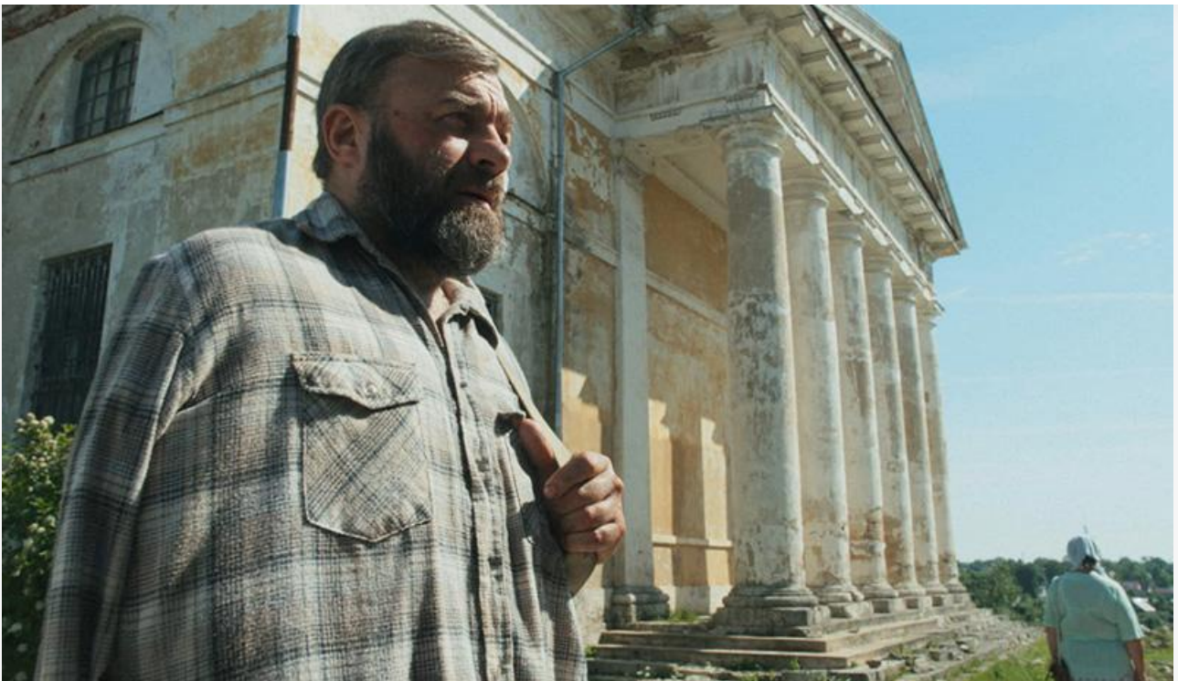
Кадр из фильма «Русский крест»