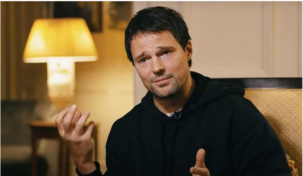
Данила Козловский на интервью Ирине Шихман (признана иноагентом), апрель 2021 года