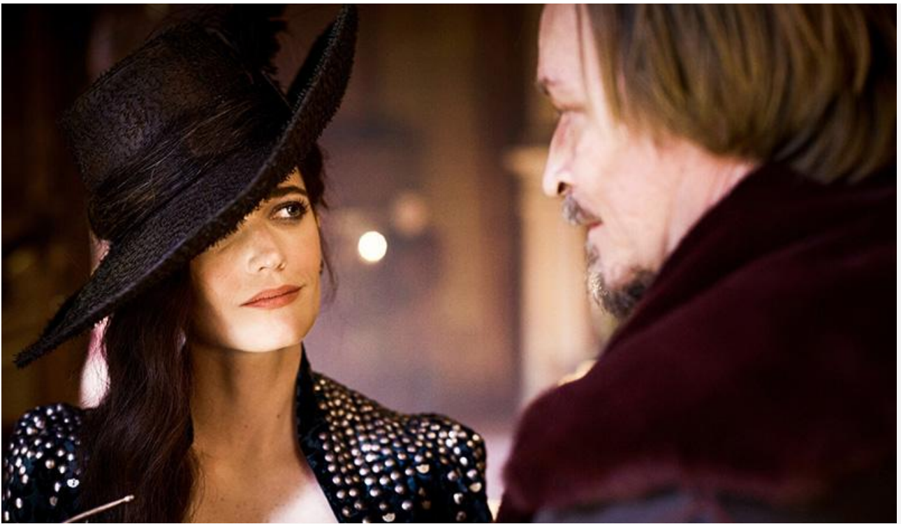
Кадр из фильма «Три мушкетёра: Д'Артаньян»