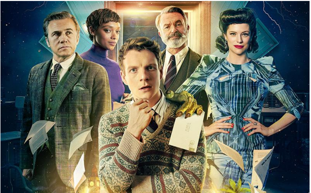
Постер к фильму «Бюро магических услуг»