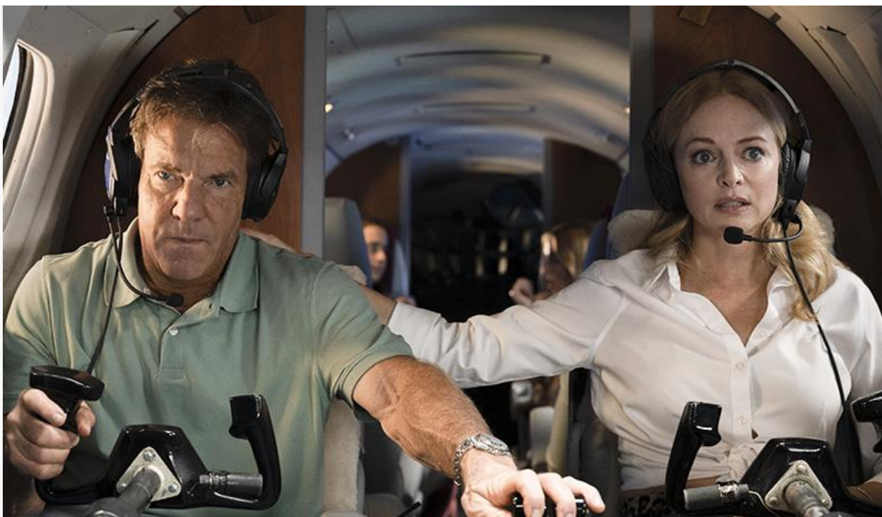
Кадр из фильма «На одном крыле»