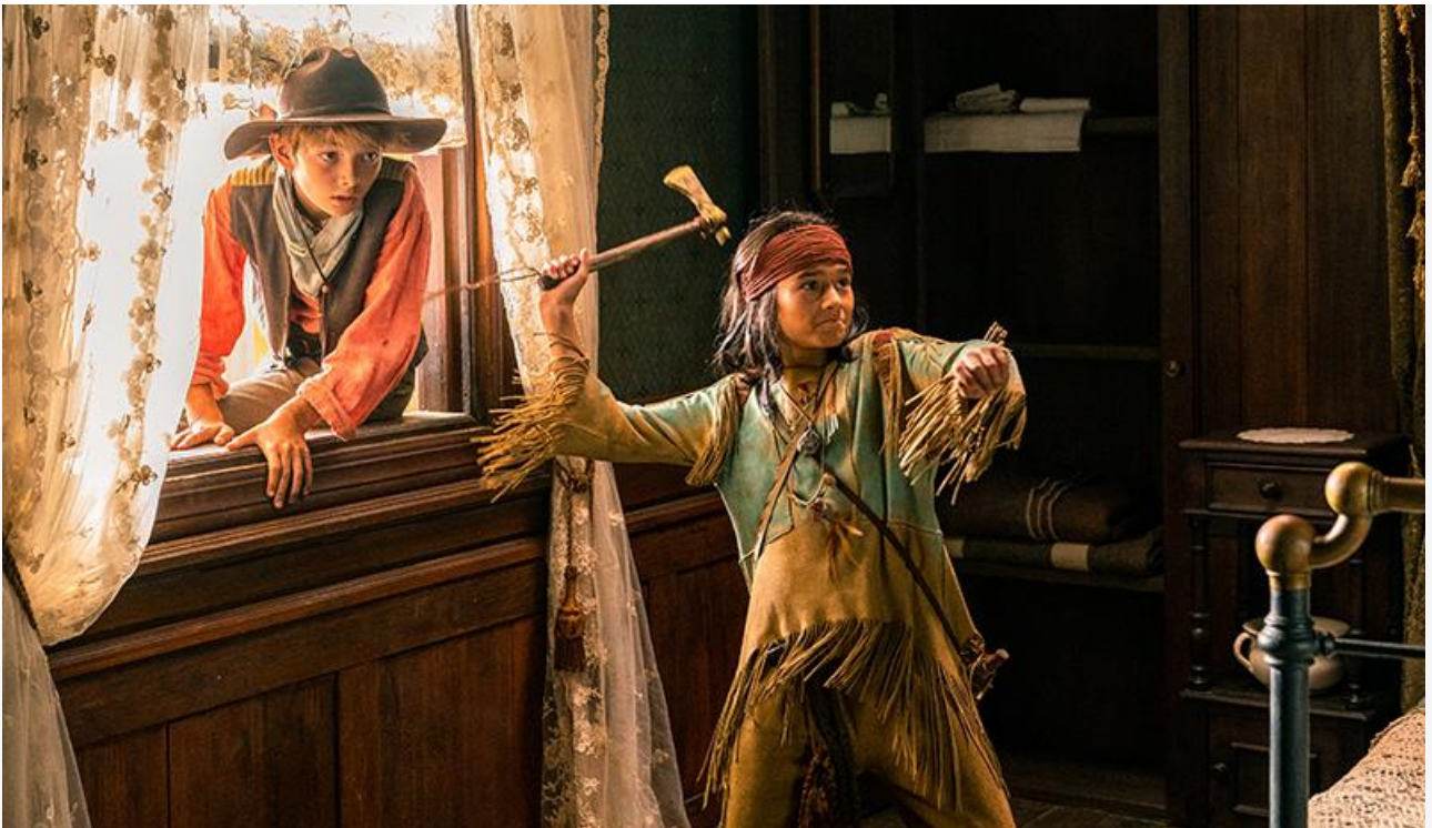
Кадр из фильма «Юный вождь Виннету»