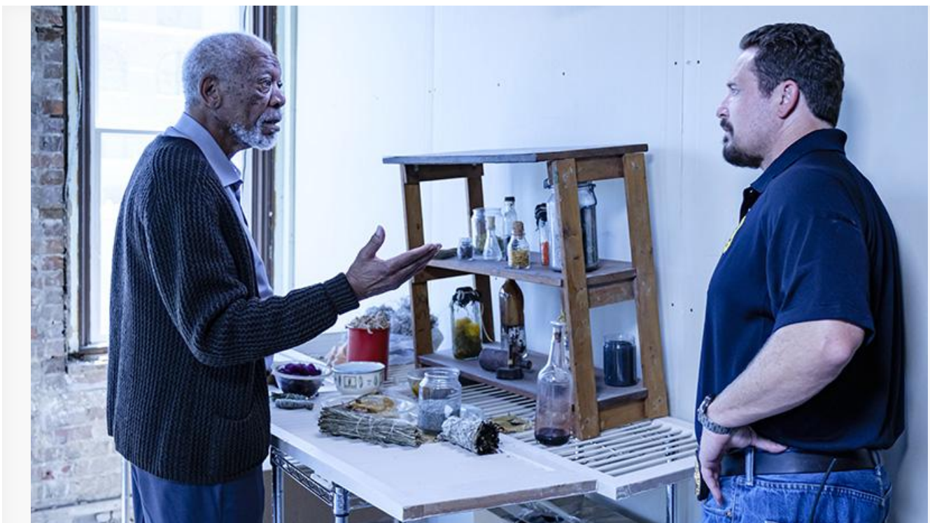
Кадр из фильма «Профессор и призрачный убийца»