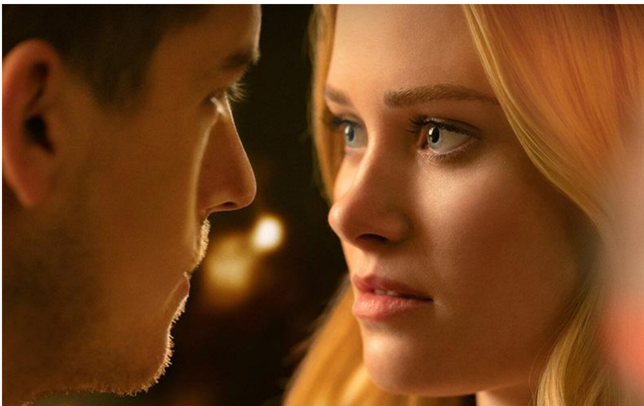
Постер к фильму «Моё прекрасное несчастье»

По данным предпродаж, «Моё прекрасное несчастье» опережает «Трёх мушкетёров». Однако к вечеру воскресенья расклад может измениться, особенно если учесть разницу в возрастных ограничениях.