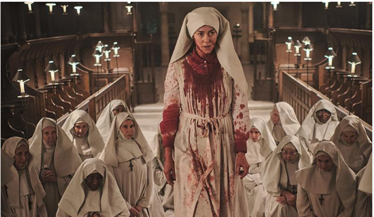
Кадр из фильма «Проклятие: Посвящение»