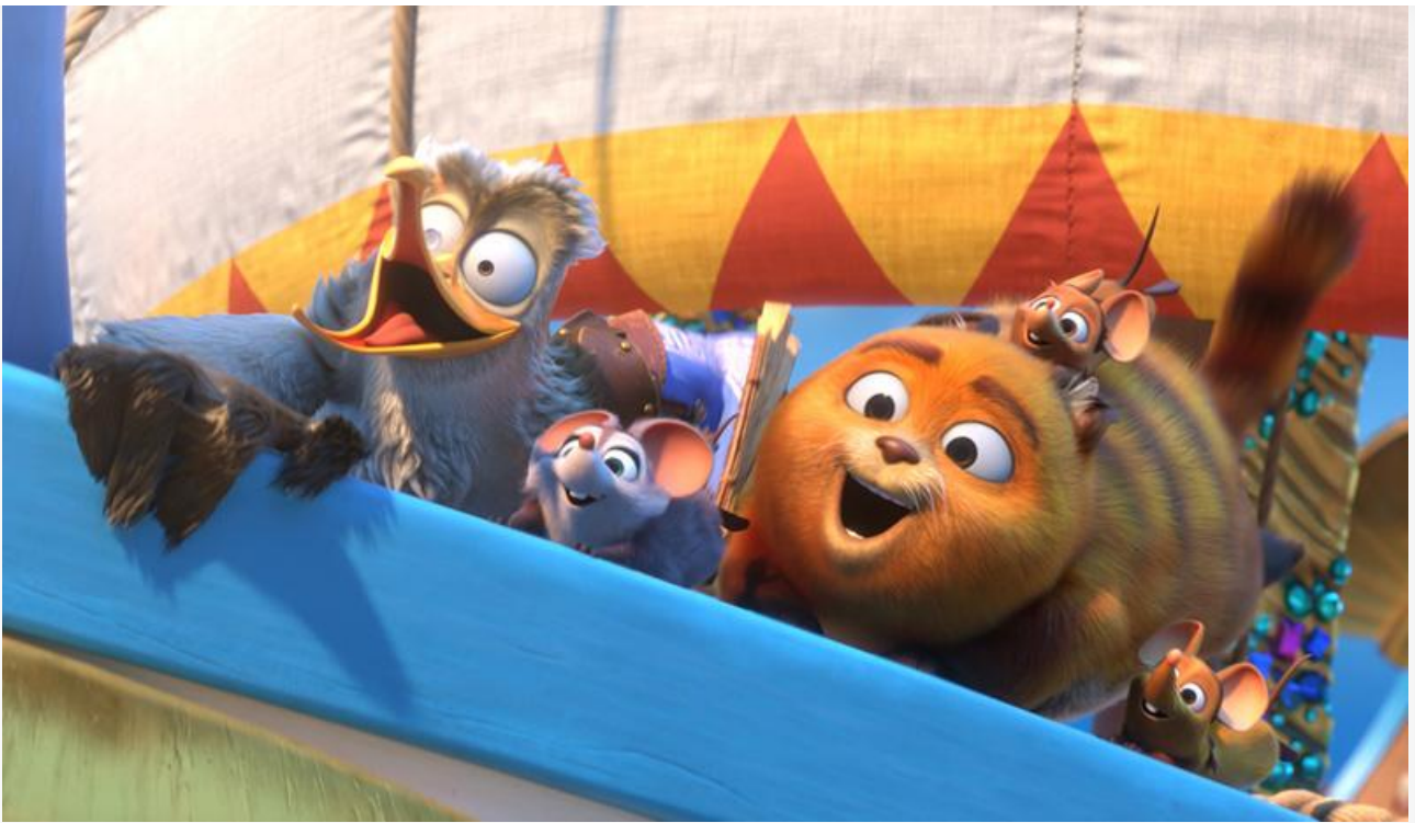
Кадр из фильма «Приключения аргонавтов»