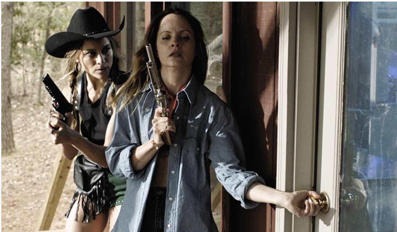
Кадр из фильма «Игра на выживание»

Впервые в России на большом экране будет показана культовая мелодрама Франсуа Трюффо «Нежная кожа», в 1964 году номинированная на «Золотую пальмовую ветвь» Каннского кинофестиваля.