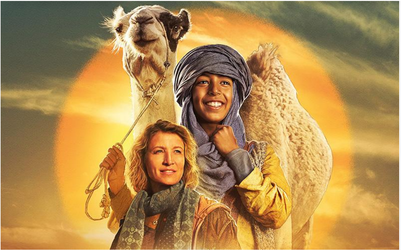
Постер к фильму «Принц пустыни»