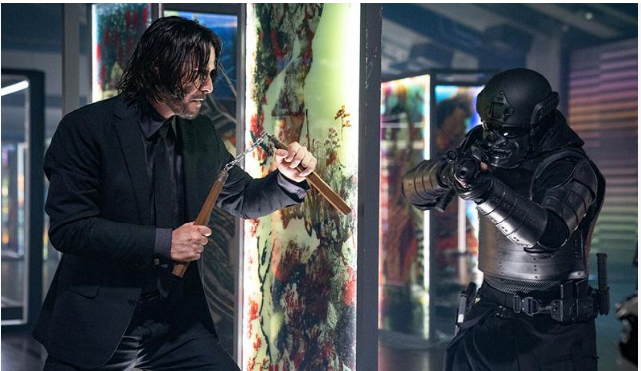
Кадр из фильма «Джон

Также сохранили места в топ-10 проката «Праведник» (12,1 миллиона и восьмое место), «Чебурашка» (9,8 миллиона и девятое место) и «Нюрнберг» (9,4 миллиона и десятое место). Как бы ни было грустно осознавать, но день, когда «Чебурашка» покинет топ-10 проката, не за горами. Напомним, фильм-рекордсмен «пылит» в прокате уже четвёртый месяц.