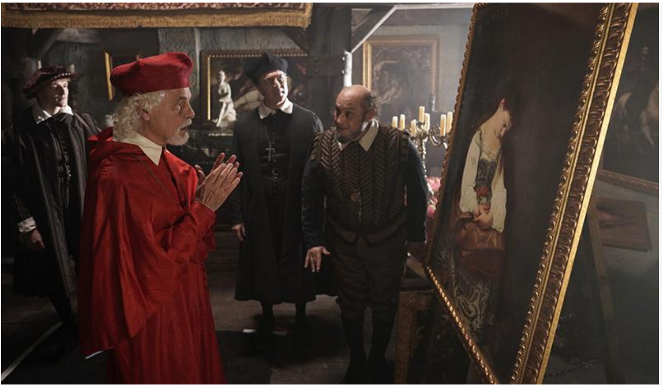
Кадр из фильма «Тень Караваджо»

Несмотря на неизбежные потери в сборах, четвёрка лидеров проката осталась неизменной. Новинкам оказалось не под силу потеснить с вершины ни боевик с Киану Ривзом «Джон Уик 4» (165,8 миллиона на 1 856 экранах), ни мультфильм «Коты Эрмитажа» (68,3 миллиона на 2 296 экранах), ни драму Сарика Андреасяна «На солнце, вдоль рядов кукурузы» (62,9 миллиона на 1 469 экранах), ни комедийную мелодраму Антона Маслова «Поехавшая» (34,9 миллиона на 750 экранах), которая, к слову, держится в топ-5 уже четыре недели и имеет невероятно высокие рейтинги: 8,0 на «Кинопоиске» и 7,0 на «Кинориум».