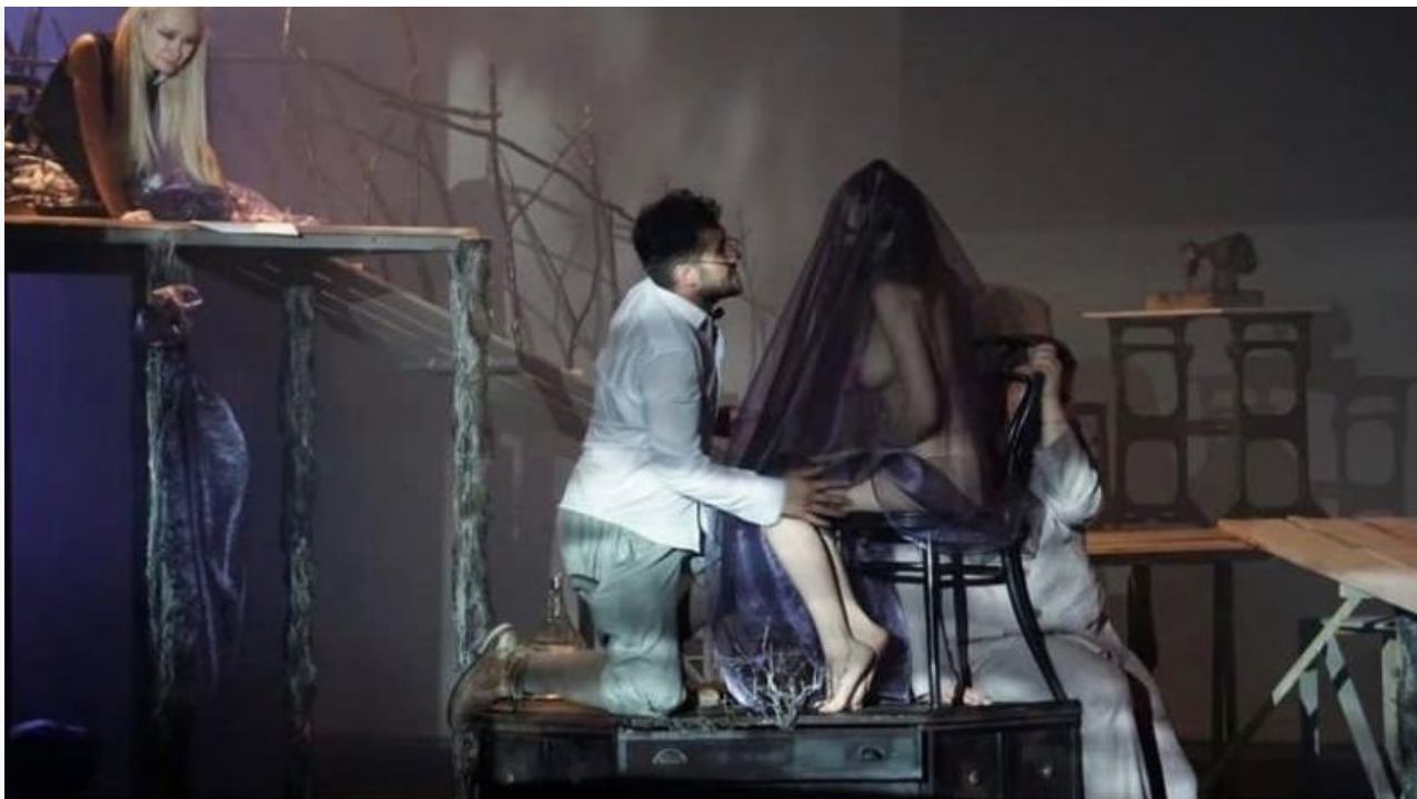
Фрагмент спектакля `Козий остров` в Братском театре драмы