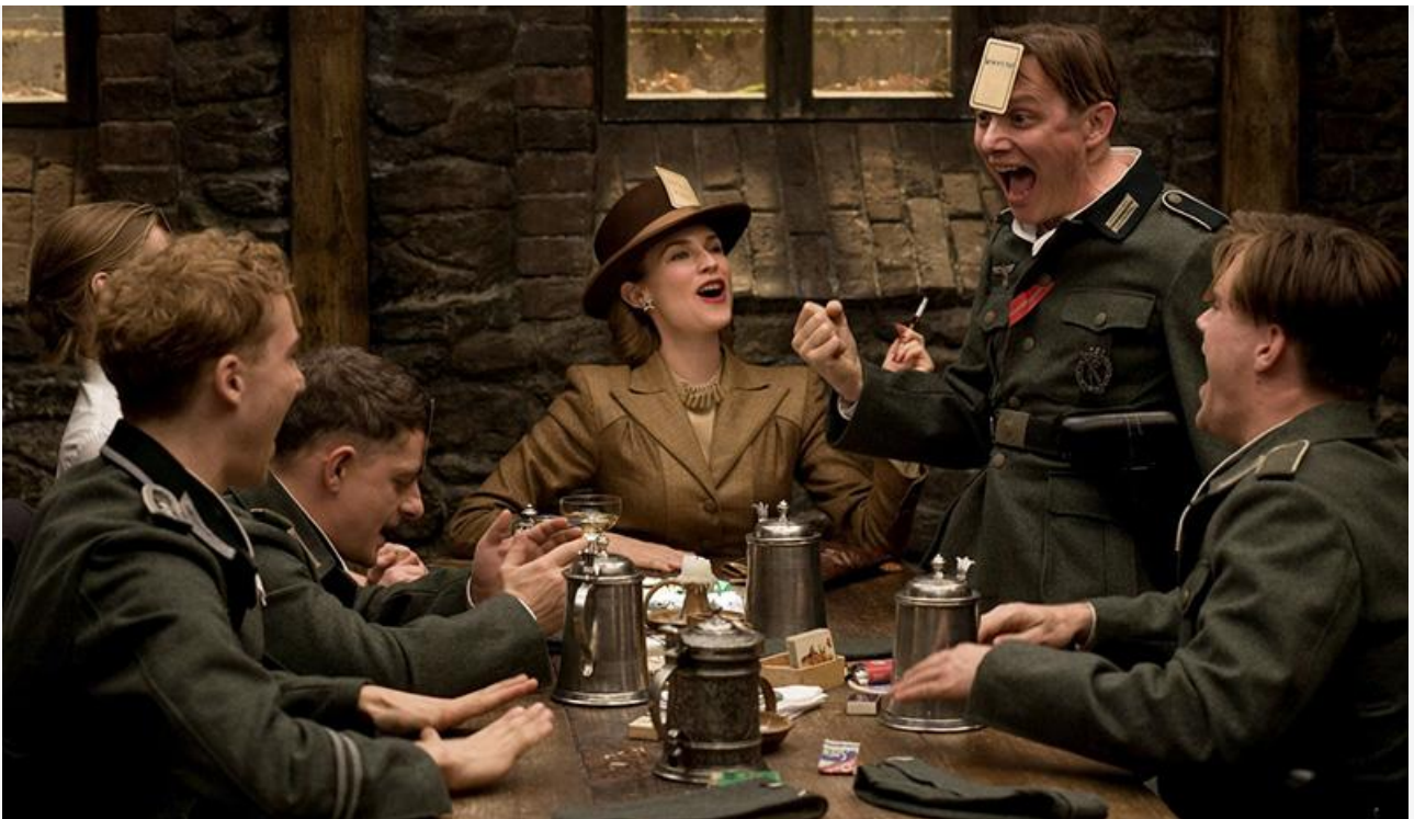
Кадр из фильма «Бесславные ублюдки», 2009 год. Номинация на «Золотую пальмовую ветвь» Каннского кинофестиваля, номинации на премии «Оскар» и «Золотой глобус» в категориях «Лучший фильм»,