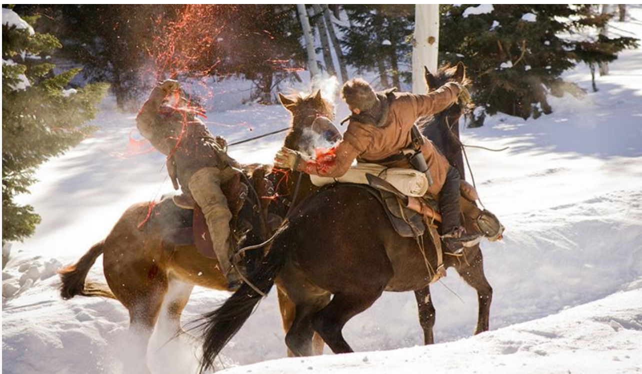
Кадр из фильма «Джанго освобождённый», 2012 год. Премии «Оскар»,