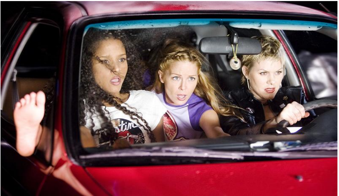
Кадр из фильма «Доказательство смерти», 2007 год. Номинация на «Золотую пальмовую ветвь» Каннского кинофестиваля