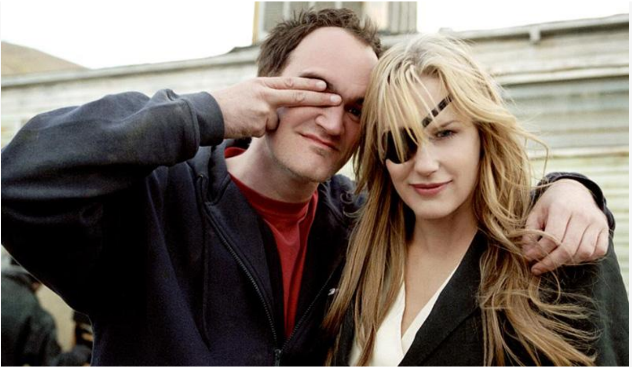
Квентин Тарантино на съёмках фильма «Убить Билла. Часть 2»