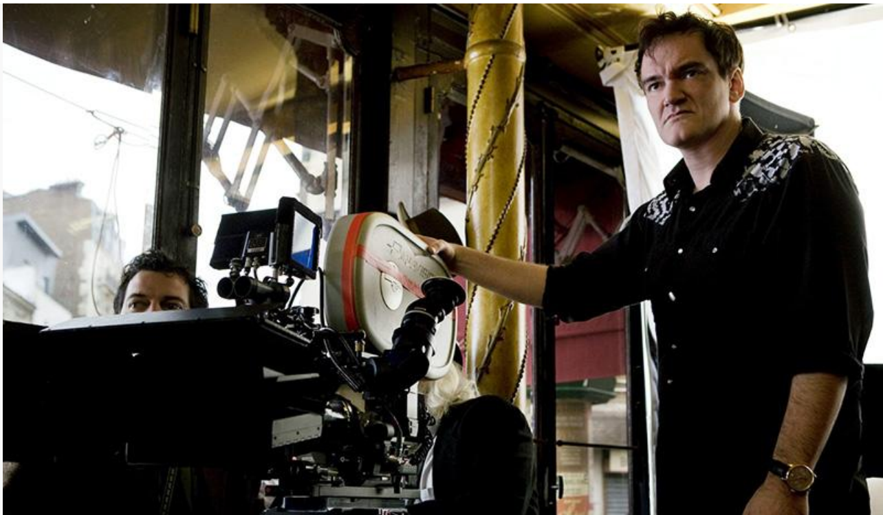
Квентин Тарантино на съёмках фильма «Бесславные ублюдки»

«Лучший режиссёр» и «Лучший сценарий», BAFTA и «Сатурн» в категориях «Лучший режиссёр» и «Лучший сценарий»