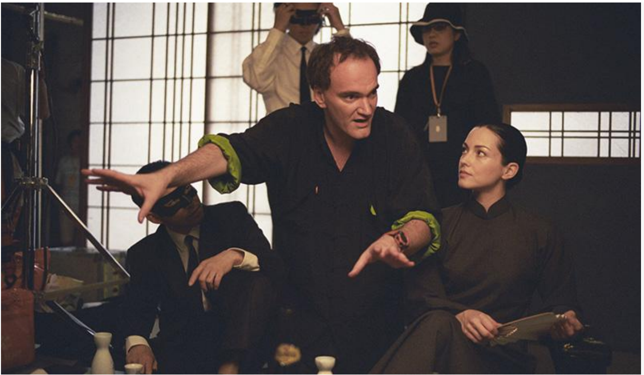
Квентин Тарантино на съёмках фильма «Убить Билла. Часть 1»