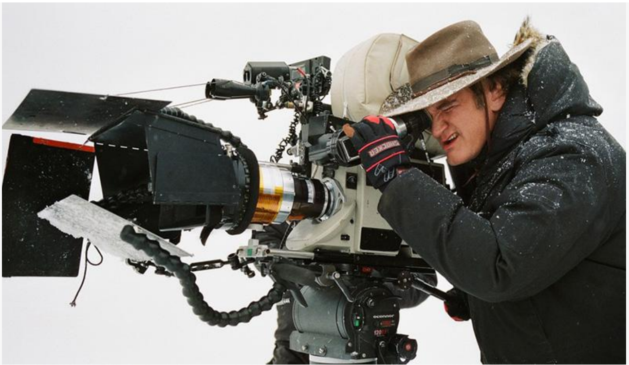
Квентин Тарантино на съёмках фильма «Омерзительная восьмёрка»