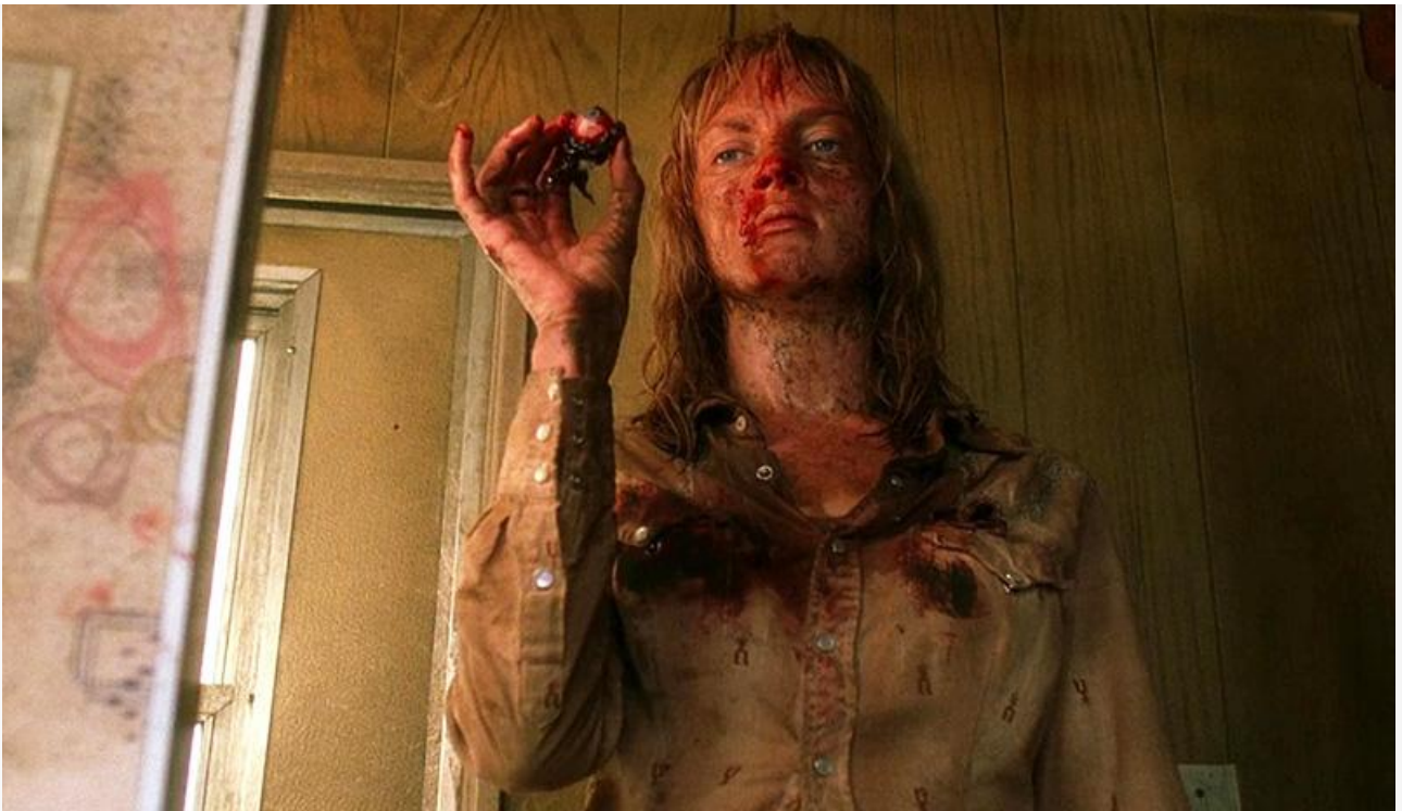
Кадр из фильма «Убить Билла. Часть 2», 2003 год. Три премии «Сатурн», в том числе за лучший фильм, номинации на премию «Сатурн» в категориях «Лучший режиссёр» и «Лучший сценарий»