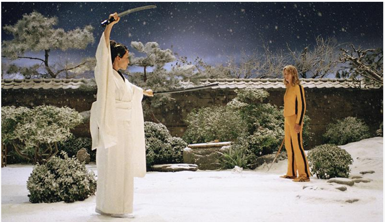
Кадр из фильма «Убить Билла. Часть 1», 2003 год. Две премии «Сатурн», в том числе за лучший фильм, номинации на премию «Сатурн» в категориях «Лучший режиссёр» и «Лучший сценарий»