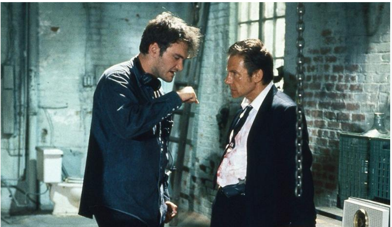
Квентин Тарантино на съёмках фильма «Бешеные псы»