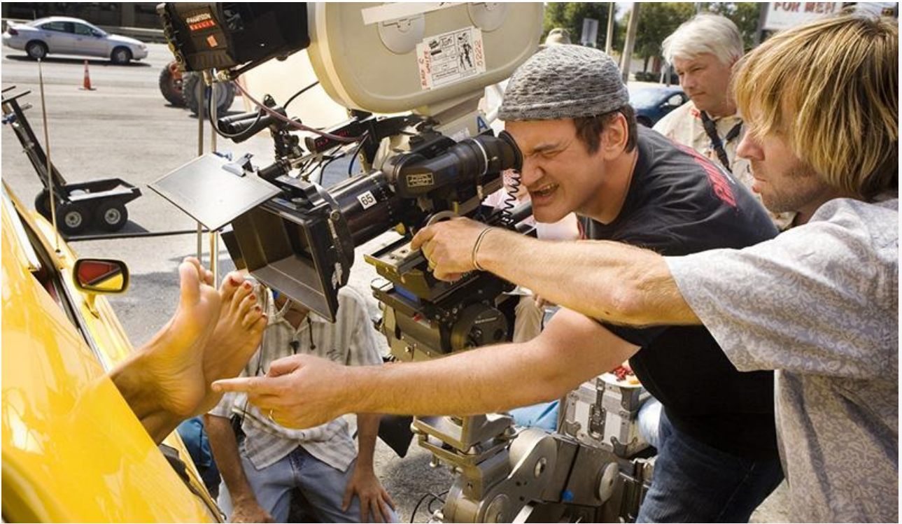
Квентин Тарантино на съёмках фильма «Доказательство смерти»