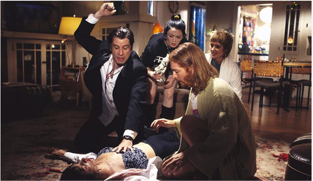
Кадр из фильма «Криминальное чтиво», 1994 год. «Золотая пальмовая ветвь» Каннского кинофестиваля, премии «Оскар», BAFTA и «Золотой глобус» за лучший сценарий, премия «Давид ди Донателло» в категории «Лучший иностраннный фильм», номинации на «Оскар» и «Золотой глобус» в категории «Лучший режиссёр», номинация на премию BAFTA в категории «Лучший фильм»