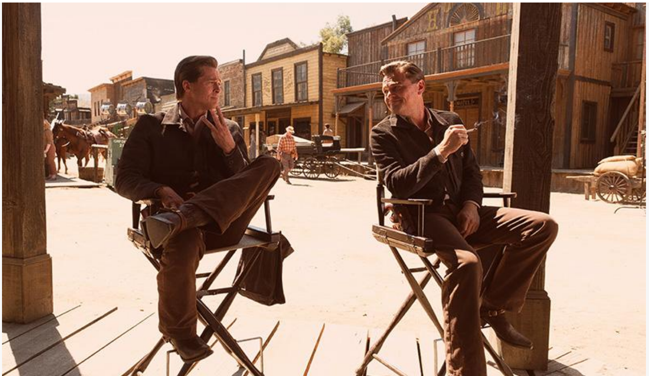
Кадр из фильма «Однажды в... Голливуде», 2019 год. Номинация на «Золотую пальмовую ветвь» Каннского кинофестиваля, премии «Золотой глобус» и «Сатурн» за лучший сценарий, номинации на премии «Оскар» и