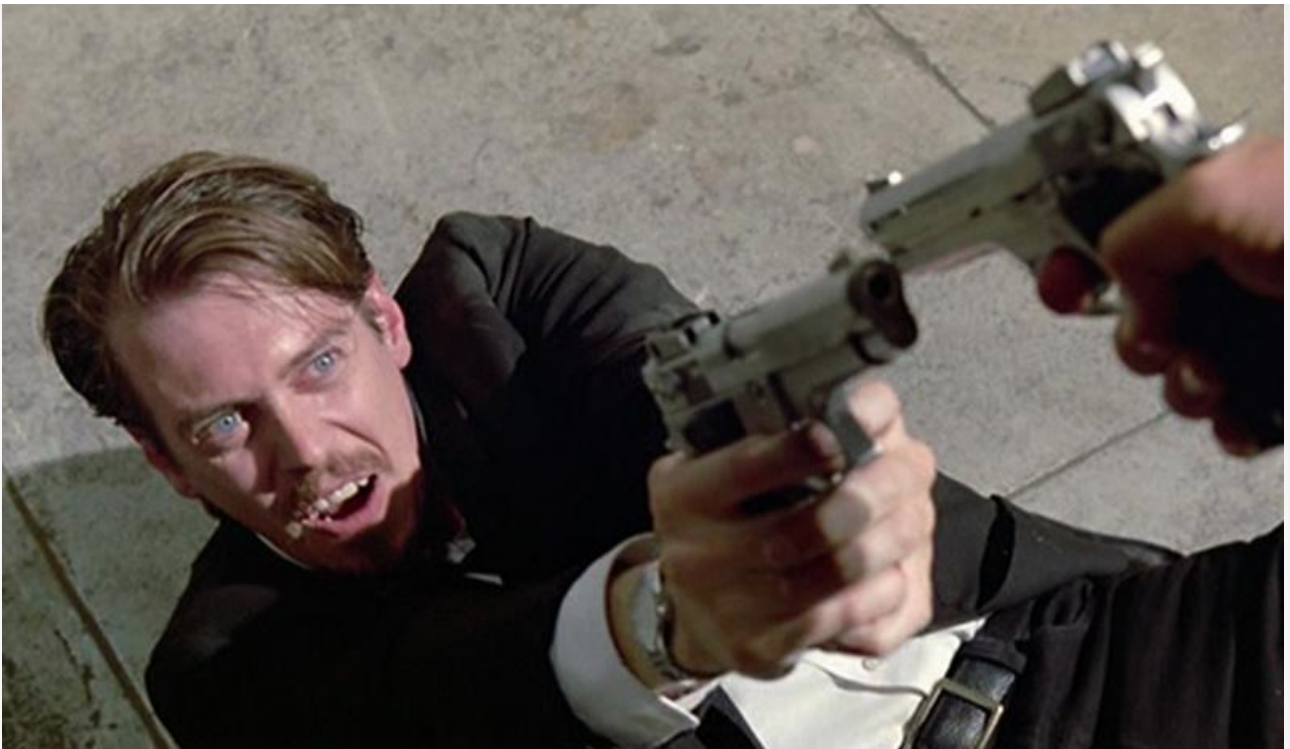
Кадр из фильма «Бешеные псы». Полнометражный дебют режиссёра, 1991 год