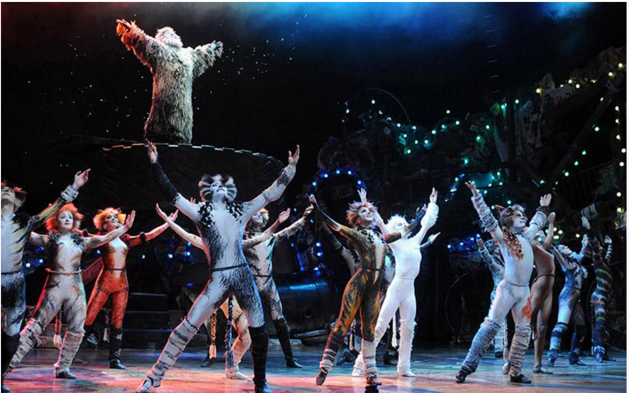
Мюзикл «Кошки» на сцене театра «Лондон Палладиум» в Вест-Энде

На сегодняшний день обойти «Кошек» по продолжительности успеха удалось лишь мюзиклу Клода-Мишеля Шёнберга «Отверженные», продюсером которого также является Макинтош, и «Призраку Оперы» всё того же Уэббера, за которым числится 150 постановок в 30 странах и 35 лет непрерывных показов на Бродвее и в Вест-Энде.