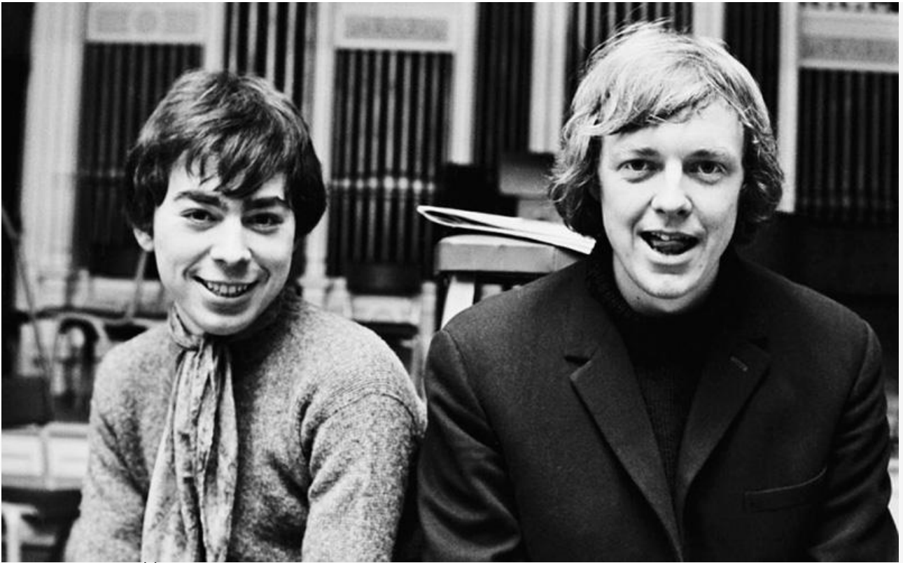
Эндрю Ллойд Уэббер и Тим Райс в молодости

Результатами совместной работы молодых авторов стали их дебютный мюзикл «Такие, как мы», впервые увидевший свет рампы спустя 40 лет после написания, библейская кантата «Иосиф и его удивительный халат снов», расширенная впоследствии до полноценного спектакля, и ставшие культовыми и впоследствии успешно экранизированные библейская рок-опера «Иисус Христос – суперзвезда» и мюзикл «Эвита» о судьбе легендарной первой леди Аргентины Эвы Перон, получивший премию Лоуренса Оливье как лучший мюзикл года и семь премий «Тони».