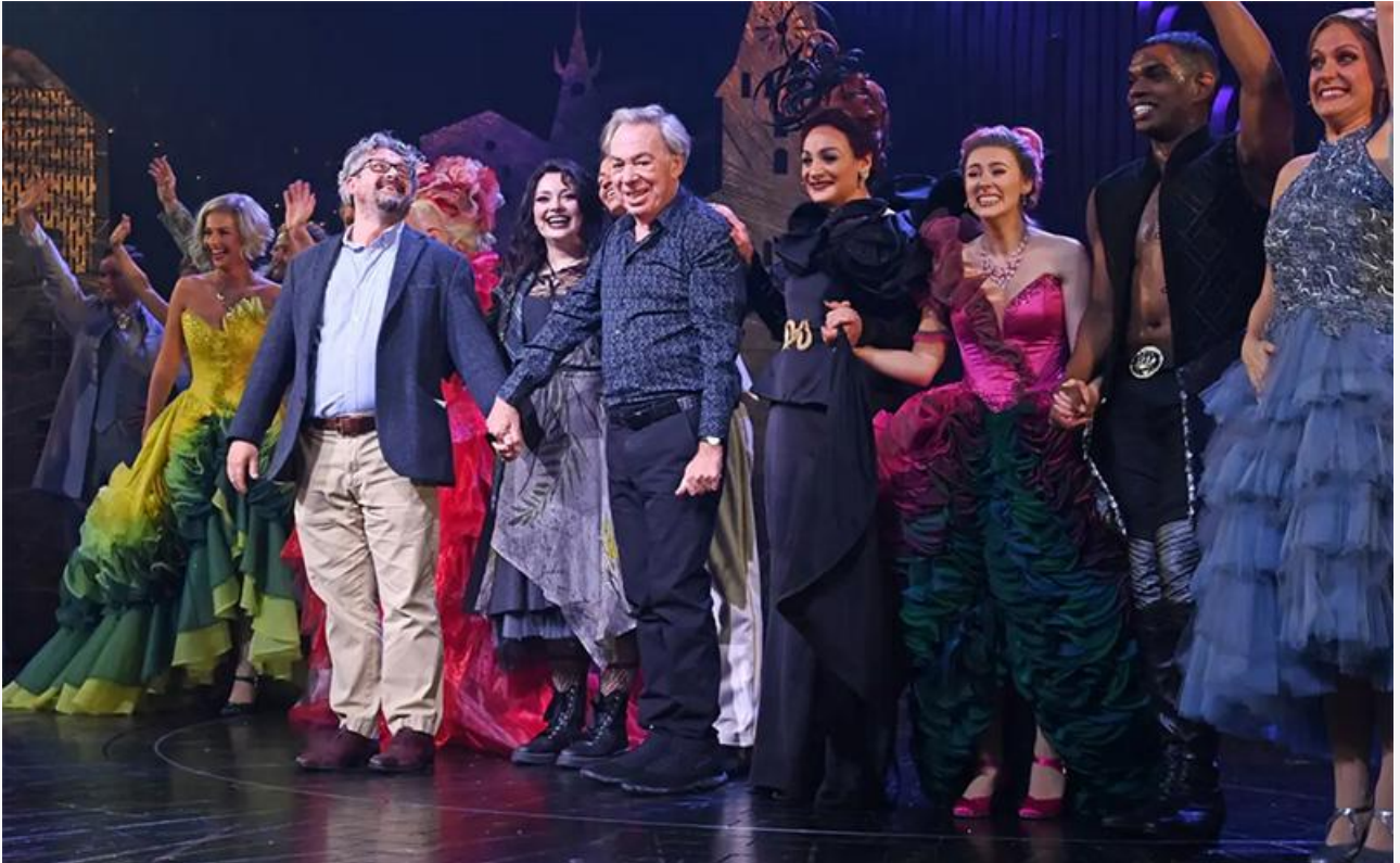
Эндрю Ллойд Уэббер на премьере мюзикла «Золушка» в лондонском Вест-Энде, 2021 год