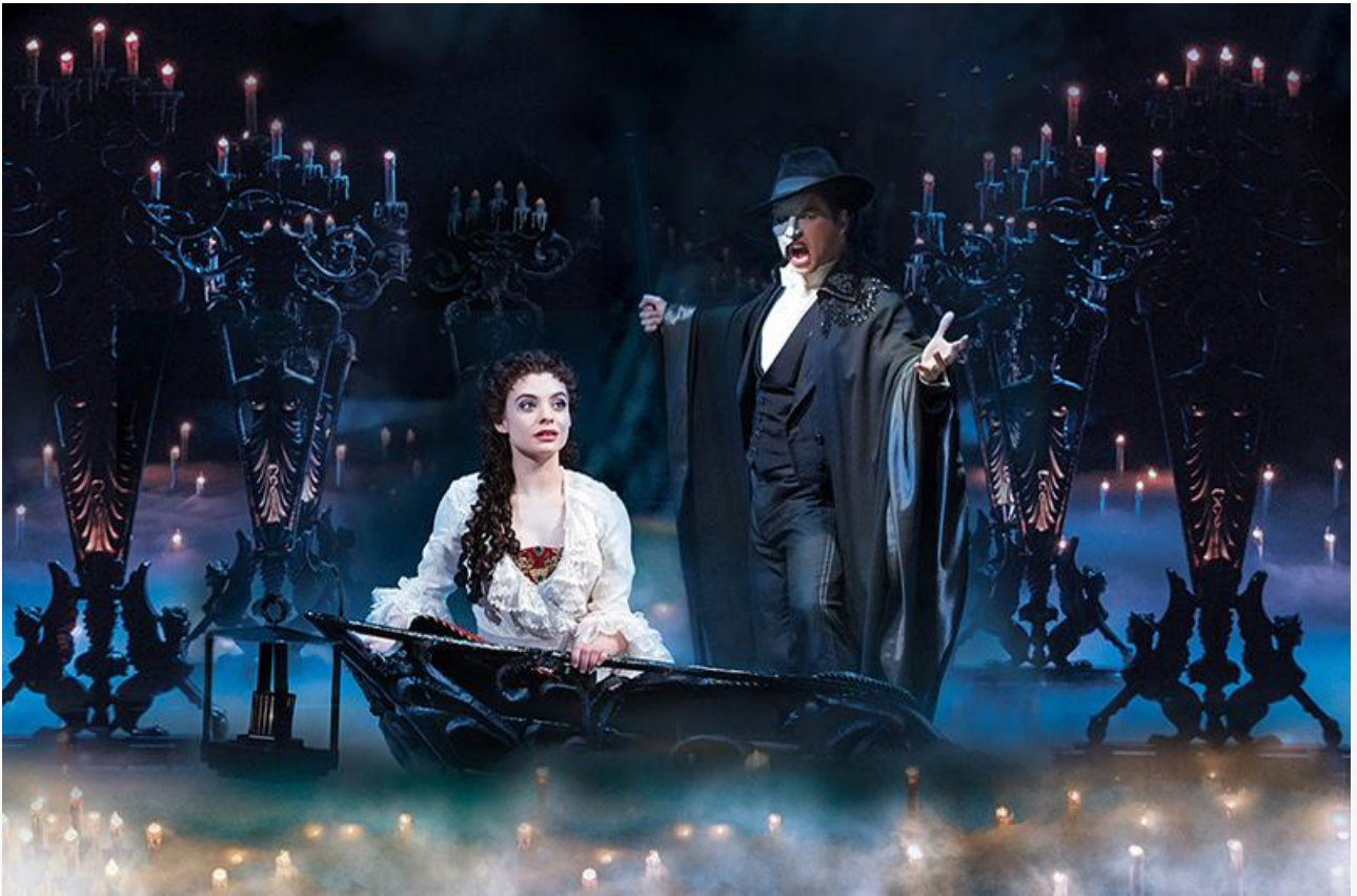
Мюзикл «Призрак оперы» на Бродвее

Всего на сегодняшний день из-под пера юбиляра вышло два десятка мюзиклов разной степени успешности.