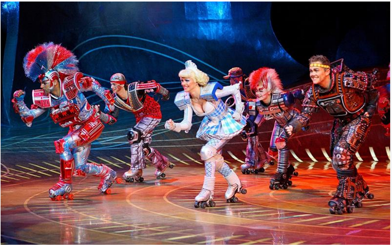
Сцена из мюзикла «Звёздный Экспресс». Немецкая постановка в Бохуме