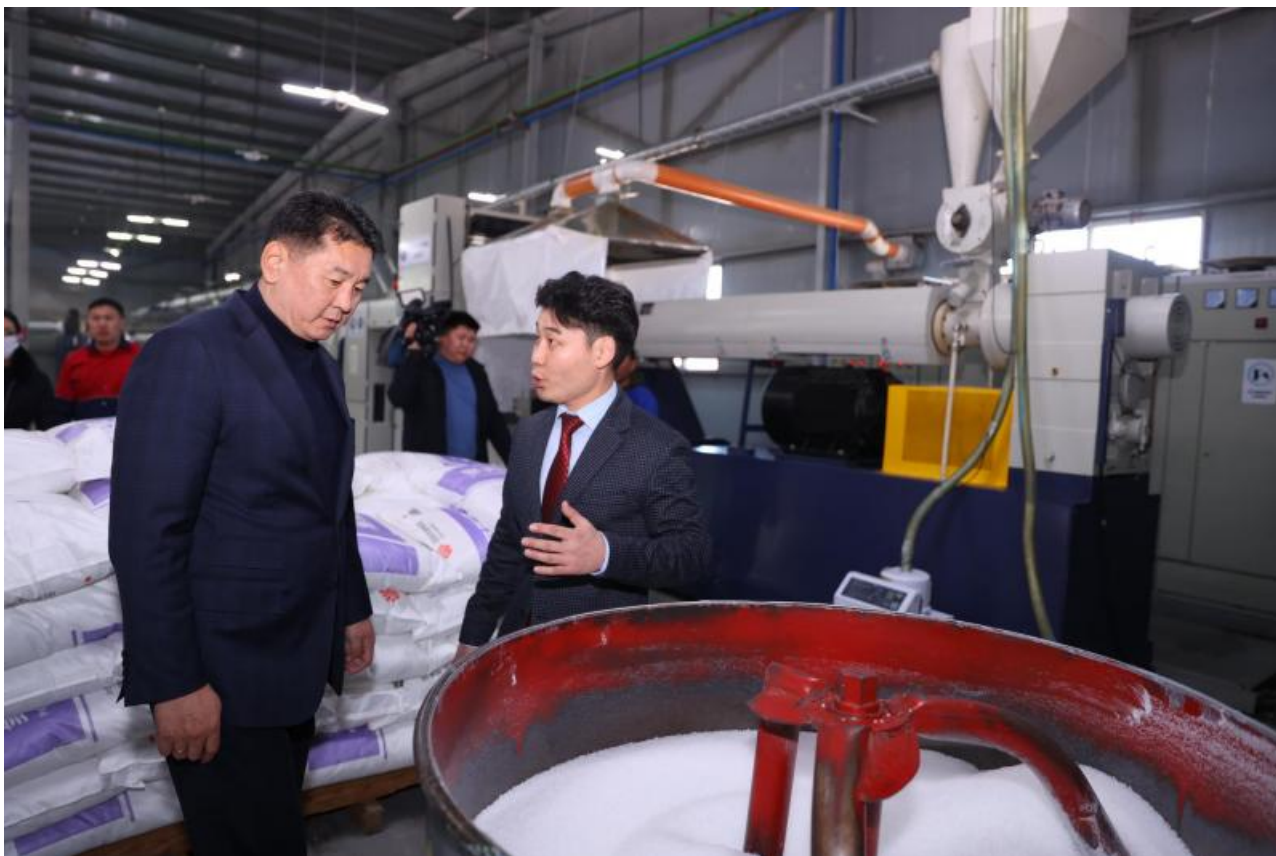
Фото: пресс-служба президента Монголии

Автор: Денис Большаков © Babr24.com ПОЛИТИКА, ЭКОНОМИКА И БИЗНЕС, ОБЩЕСТВО, МОНГОЛИЯ 15559 20.03.2023, 15:33 431