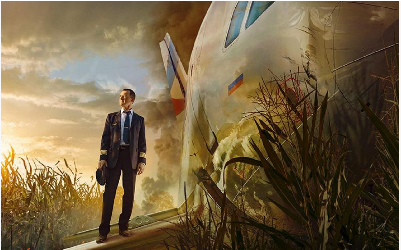
Постер к фильму «На солнце, вдоль рядов кукурузы»

Настоящий праздник в наступившем уикенде пришёл на улицу любителей хорроров. Сразу два релиза этого жанра, с большой долей вероятности, войдут в топ-10 проката. Это отечественный фильм ужасов Игоря Волошина «Медя» (18+) с Ольгой Симоновой, Кириллом Полухиным, Паулиной Андреевой и Павлом Деревянко и американская экранизация рассказа Стивена Kingа «Дети кукурузы» (18+) от режиссёра «Эквилибриума» и «Ультрафиолета» Курта Уиммера.