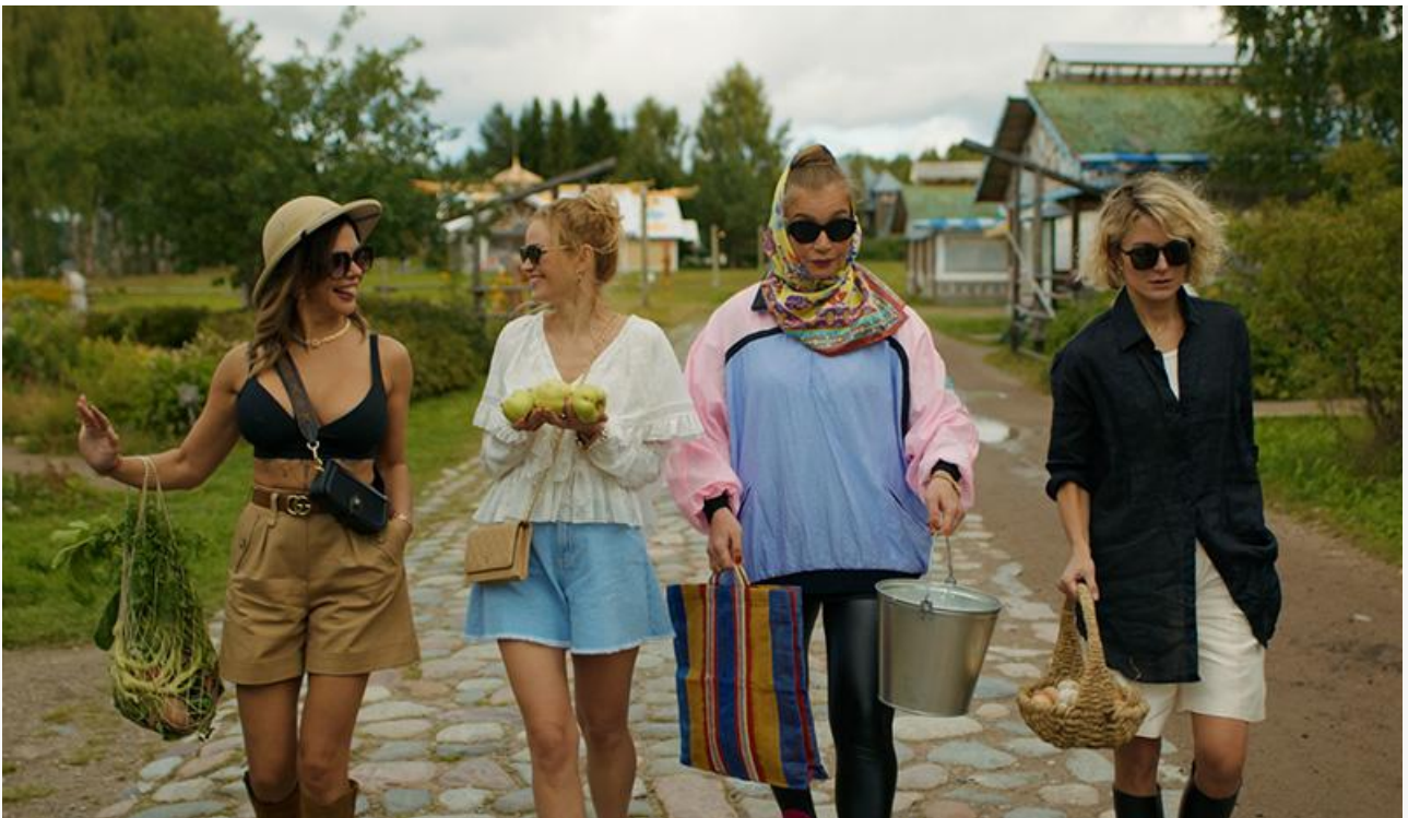
Кадр из фильма «Беспринципные в деревне»

Весомый вклад в общую копилку уикенда внесли «Праведник» Сергея Урсуляка, с доходом 45,2 миллиона ставший четвёртым, и «Чебурашка» Дмитрия Дьяченко, с суммой 27,4 миллиона замкнувший пятёрку лидеров.