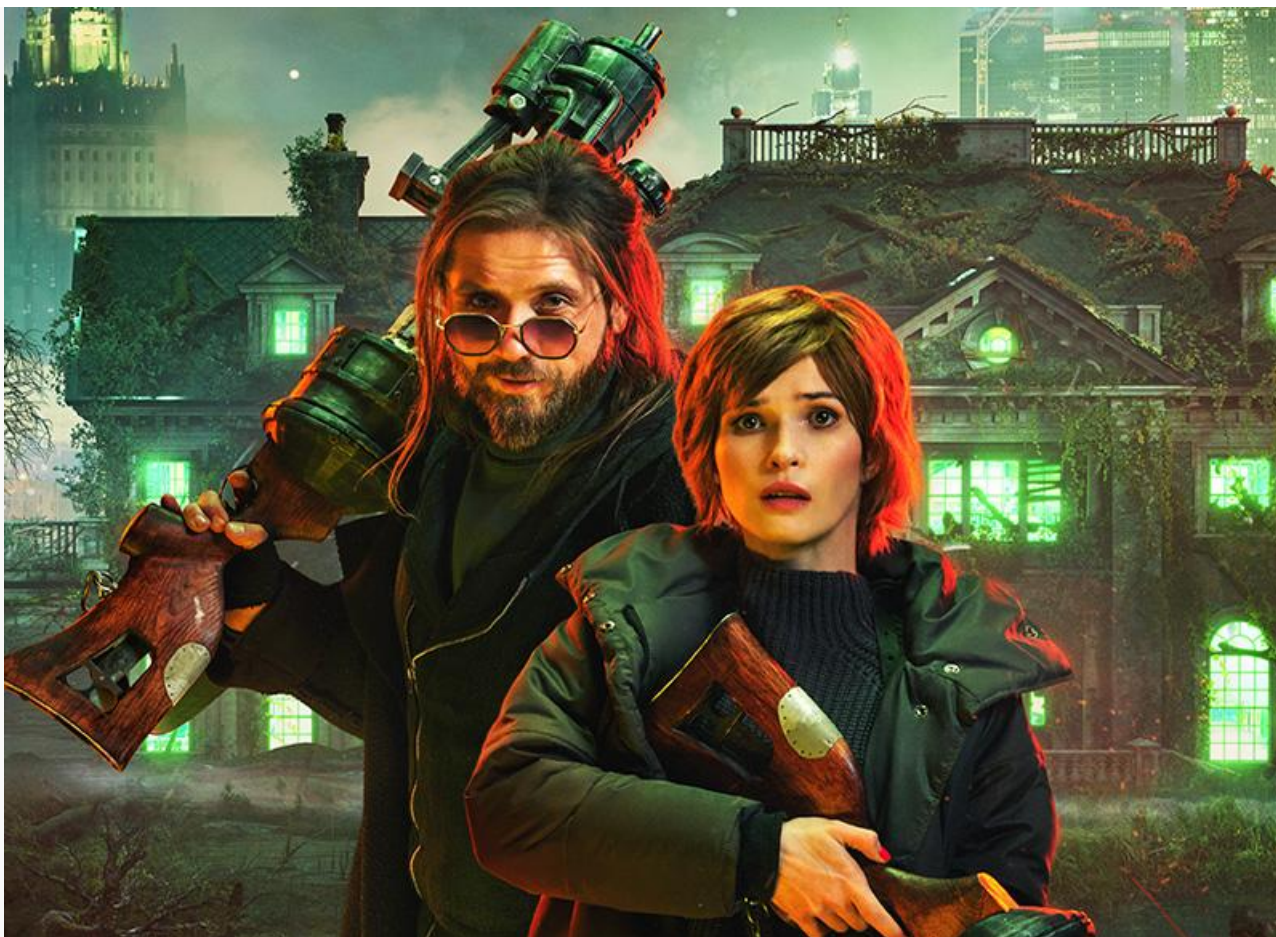
Постер к фильму «Сергей против нечисти: Шабаш»

Также на экраны выходят комедия Ратмира Лутфуллина « Идеальный брат », итальянская мелодрама Элизы Аморузо « Опасная игра » (18+), британская комедия Джека Спринга « Миллионер на три дня » (18+), семейный американско-мексиканский фильм Энн-Мари и Брайана Шмидт « Остров потерянных девчонок », американский фэнтезийный боевик Стивена Шимека « Стражи времени », казахстанский боевик Алёны и Алишер Алмаз « Телохранитель » и американский мультфильм 2017 года « Морские монстрики ».