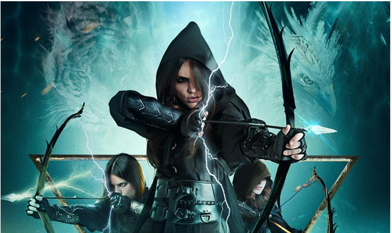
Постер к фильму «Стражи времени»