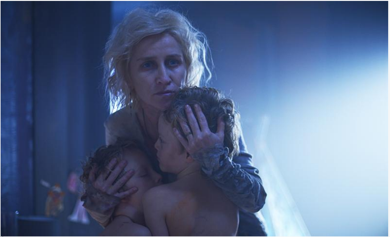
Кадр из фильма «Медея»