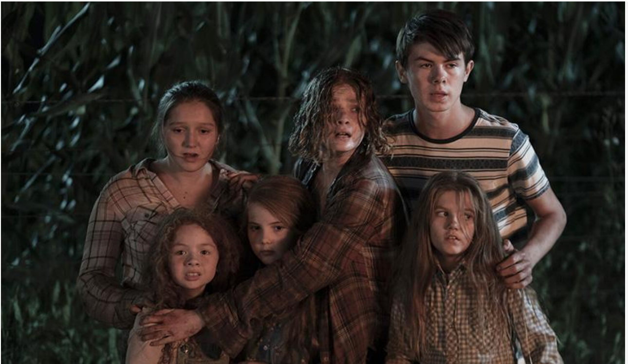
Кадр из фильма «Дети кукурузы»