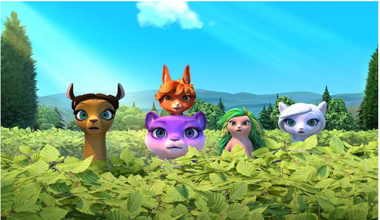
Кадр из фильма «Царевны и Таинственная гостья»