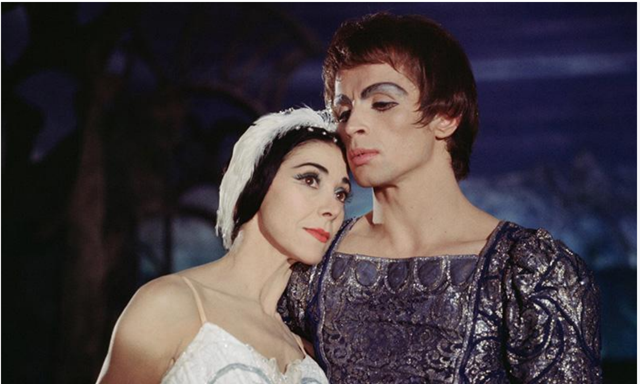
Постер к фильму «Лебединое озеро»

Также впервые на больших экранах зрители смогут посмотреть культовый фильм Владимира Бортко « Собачье сердце », снятый 35 лет назад по одноимённой повести Михаила Булгакова и до этого демонстрировавшийся лишь по телевидению.