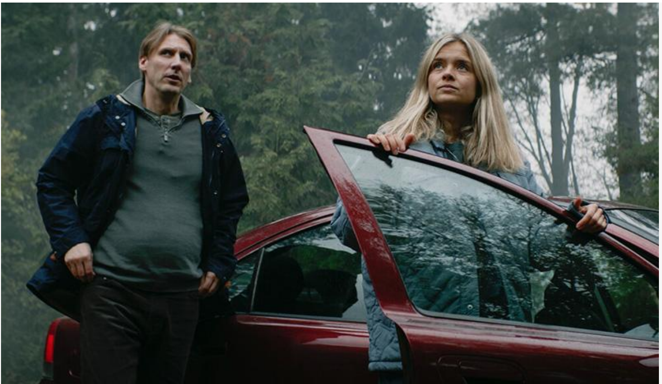
Кадр из фильма «Не стучи»

Общая касса топ-20 фильмов уикенда составила, по информации «Бюллетеня кинопрокатчика», 470 миллионов рублей (с учётом стран СНГ – 518 миллионов). Это на 2,2 % меньше по сравнению с предыдущими выходными , но на 40,3 % выше показателей аналогичного уикенда прошлого года.