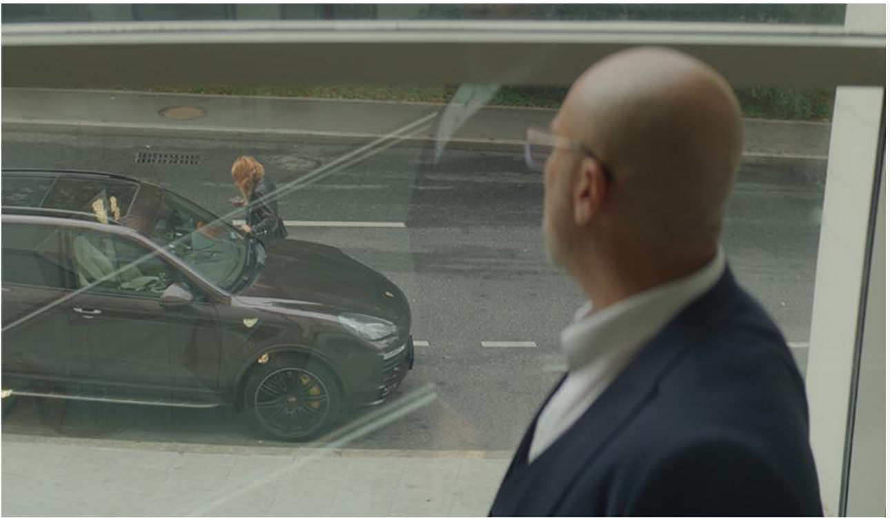
Кадр из фильма «Эскортница»