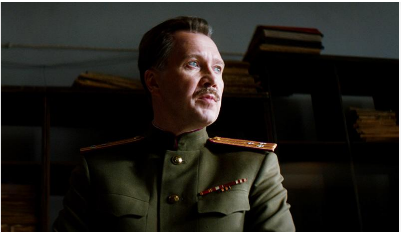
Кадр из фильма «Нюрнберг»

Лидер предыдущего уикенда – комедия Романа Прыгунова «Беспринципные в деревне» – потерял в сборах 45 % и с прибылью 59,9 миллиона был вынужден опуститься на третью строку чарта.