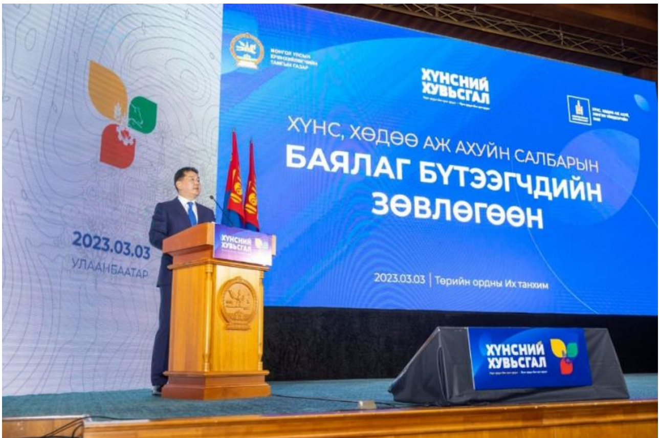
Фото: пресс-служба президента Монголии

Автор: Денис Большаков © Babr24.com ПОЛИТИКА, ЭКОНОМИКА И БИЗНЕС, ОБЩЕСТВО, МОНГОЛИЯ 17020 08.03.2023, 08:53 583