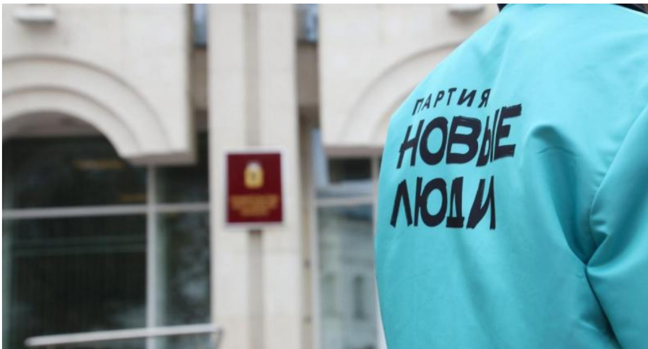
Фото: progorod76 , static.irk , rosotkat.ru

Автор: Лилия Войнич © Babr24.com ПОЛИТИКА, ИРКУТСК 👁 25309 06.03.2023, 05:47 📌 436