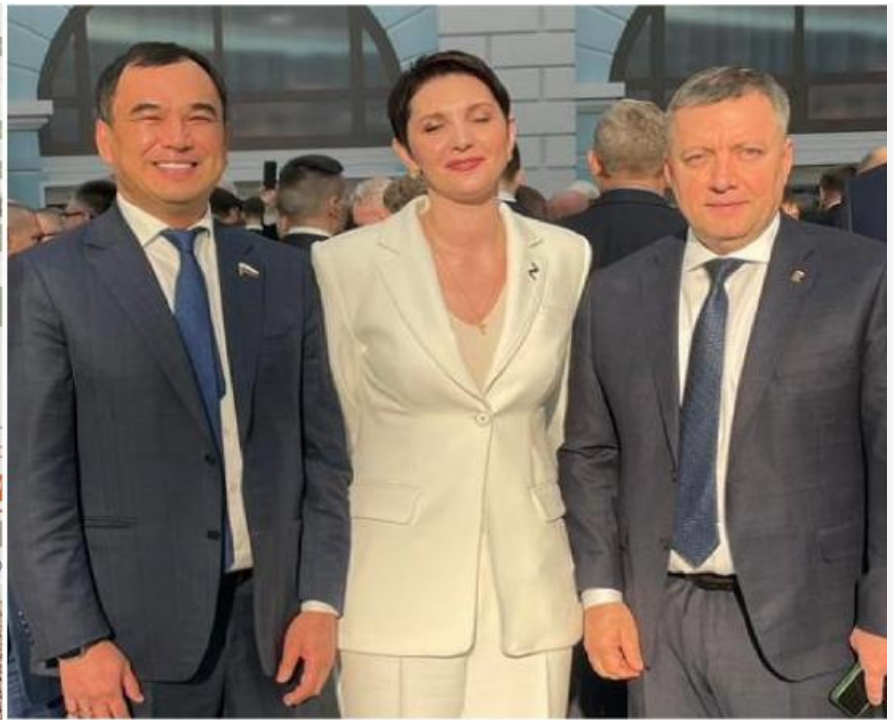
Справа фрагмент коллективного фото